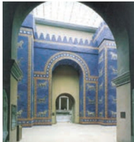
تصویر ۱۶ - بازسازی دروازه ایشتار، بابل، حدود ۵۷۵ پیش از میلاد، موزه دولتی برلین