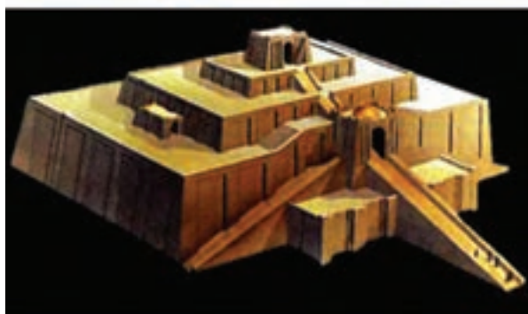
تصویر ۴- معبد (زیگورات) اور و ماکت آن، حدود ۲۰۳۰ سال پیش از میلاد، جنوب عراق