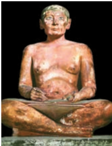
تصویر ۶- کاتب نشسته، سنگ آهک، بلندی ۵۳ سانتیمتر، دوره پادشاهی قدیم، حدود ۲۵۰۰ پیش از میلاد، موزه لوور، پاریس

نقش برجسته‌ها و نقاشی‌های مصری به صورت ترکیب نیم رخ و تمام رخ اجرا می‌شدند (تصویر ۷). هنرمندان مصری مانند میانرودانی‌ها در جانورنگاری از طبیعت‌گرایی پیروی می‌کردند که نمونه برجسته آن غازهای میدم ۱ است (تصویر ۸).