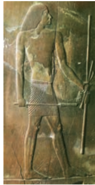
تصویر ۷- بزرگ زاده مصری، حدود ۲۷۵۰ پیش از میلاد، نقش برجسته روی چوب، بلندی ۱۱۴ سانتی متر، موزه مصر، قاهره