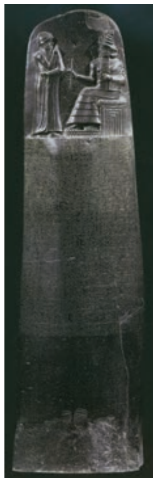
تصویر ۱۵ - الف - قانون نامه حمورابی، لوح سنگی، ارتفاع ۲۱۵ سانتی‌متر، حدود ۲۷۵۰ پیش از میلاد، موزه لوور، پاریس

همسایه همواره خواستار حجاران، نجاران، بنایان و آهنگران بابلی بودند و از آنها در کارهای ساختمانی استفاده می‌کردند. برخلاف آشوریان، هنر بابلی همچون هنر سومری - آکدی در خدمت مذهب و حکومت بود و هنرمندان به ساخت و تزیین معابد، تجسم خدایان و بازنمایی حکام و کارگزاران حکومت می‌پرداختند. بابلی‌ها در ساخت آجرهای لعاب‌دار بسیار توانا بودند و نمونه کار برجسته آنها آجرهای لعاب‌دار منقوش دروازه ایشتار است که از جمله شاهکارهای هنری جهان باستان محسوب می‌شود (تصویر ۱۶ و ۱۷).