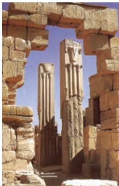
تصویر ۱۴- تزئینات معماری، معبد آمون، کارناک، حدود ۱۴۵۰ پیش از میلاد

نشان می‌دهند که مجموعه آن به نام کتاب مردگان شهرت یافته است (تصویر ۱۲). آخرین فرمانروایان قدرتمند مصر، رامسس دوم و سوم هستند که بار دیگر مصر را به اوج قدرت رساندند. یادگار برجسته معماری عهد آنها کاخ‌ها و معبد آمون در الاقصر است که دارای سر در، تالارهای ستوندار و حیاط است (تصویر ۱۳ و ۱۴).