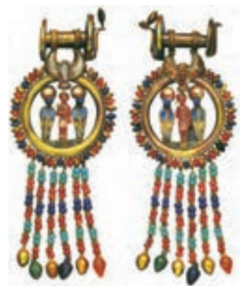
تصویر ۱۵- گوشواره طلا و سنگ‌های قیمتی، مقبره توت عنخ آمون

مصری‌ها در زیورسازی و هنرهای تزئینی هم توانا بودند و موضوع اغلب آثار تزئینی آنها برگرفته از گیاهان کنار رود نیل به‌ویژه نیلوفر و پاپیروس بود (تصویر ۱۵).