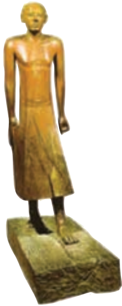
تصویر ۵- تندیس چوبی، حدود ۱۹۵۰ پیش از میلاد، سلسله‌های قدیم