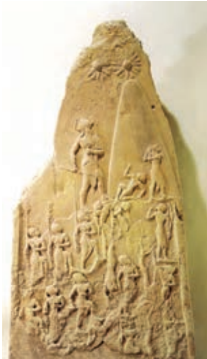
تصویر ۹- لوح پیروزی نارام سین، سنگ، حدود ۲۳۰۰-۲۲۰۰ قبل از میلاد، موزه لوور پاریس

در حدود ۲۴۰۰ قبل از میلاد اقوام سامی نژاد شمال میانرودان به جنوب آمدند و به رهبری سارگون ۱ ، حکومت اکّد را تأسیس کردند. سارگون و جانشینانش خود را پادشاه می خواندند و ادعای فرمانروایی بر سراسر میانرودان را داشتند، در زمان اکّدی ها، هنر سومری وظیفه تجلیل از پادشاه را نیز به عهده گرفت، جالب ترین اثر دوره اکّدی یک سردیس مفرغی است که چهره پادشاهی قدرتمند را مجسم می کند که نگاهی اطمینان بخش و با ابهت دارد ( تصویر ۸). از نارام سین ۲ نوه سارگون نیز یک لوح سنگی باقی مانده که در آن پیروزی نارام سین و سپاهش نقش شده است (تصویر ۹). در لوح نارام سین بزرگی اندازه شاه تأکید بر قدرتمندی و پیروزی او دارد.