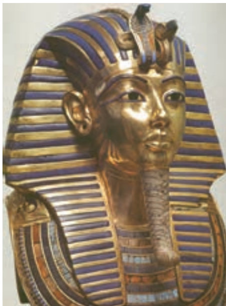
تصویر ۱۱- ماسک زرین تابوت توت عنخ آمون، ارتفاع ۵۴ سانتی متر، ۱۳۲۵ پ.م، موزه قاهره، مصر