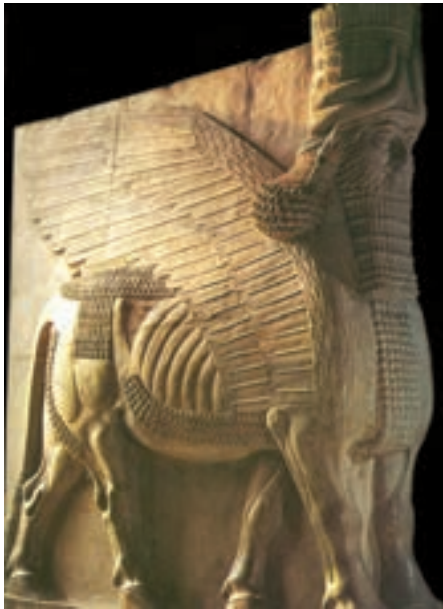
تصویر ۱۴- انسان - گاو (گاو مرد بالدار) سنگ مرمر، دروازه کاخ سارگون دوم آشوری در نینوا، ۷۲۱ - ۷۰۵ پیش از میلاد