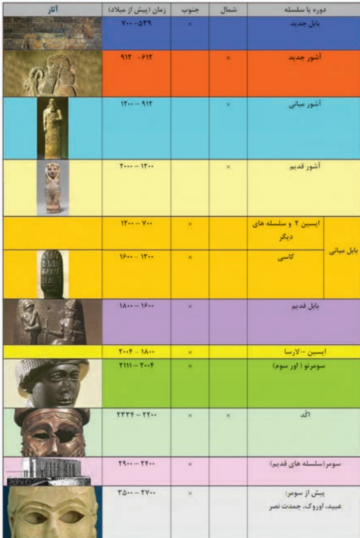
جدول گاهنگاری دوره‌ها و سلسله‌های میانرودان (بین النهرین)