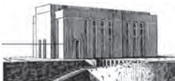
تصویر ۳- معبد خدای آسمان، شهر اوروک، حدود ۳۵۰۰-۳۰۰۰ سال قبل از میلاد، جنوب عراق