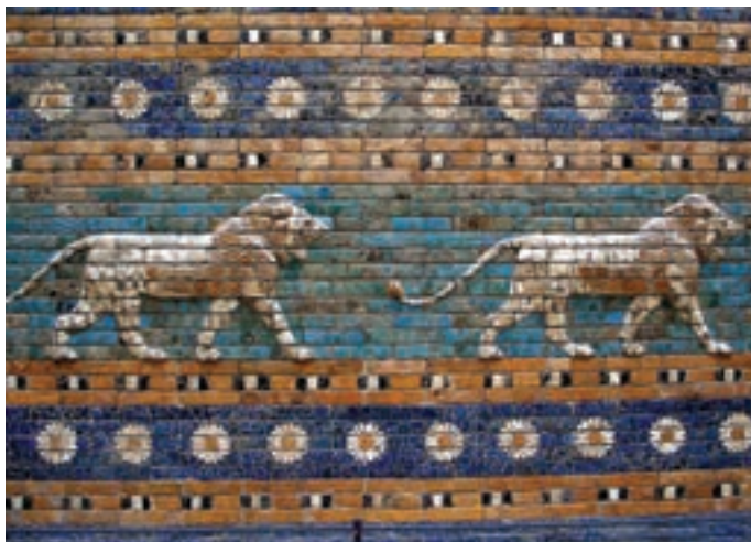
تصویر ۱۷ - آجر لعاب‌دار، کاخ نبوه‌کدنصر، بابل، حدود ۵۷۵ پیش از میلاد. موزه باستان‌شناسی استانبول