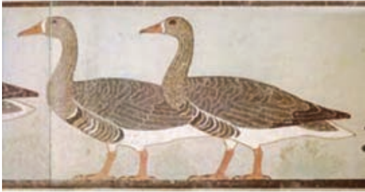
تصویر ۸- غازهای مدم ، سلسله چهارم، حدود ۲۵۵۰ پیش از میلاد. نقاشی دیواری داخل مقبره، بلندی تقریباً ۴۵ سانتی متر، موزه مصر، قاهره