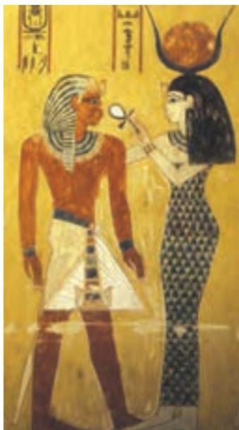
تصویر ۱۲- بخشی از کتاب مردگان، نقاشی دیواری داخل مقبره، ۱۳۹۰ پیش از میلاد، سلسله‌های جدید