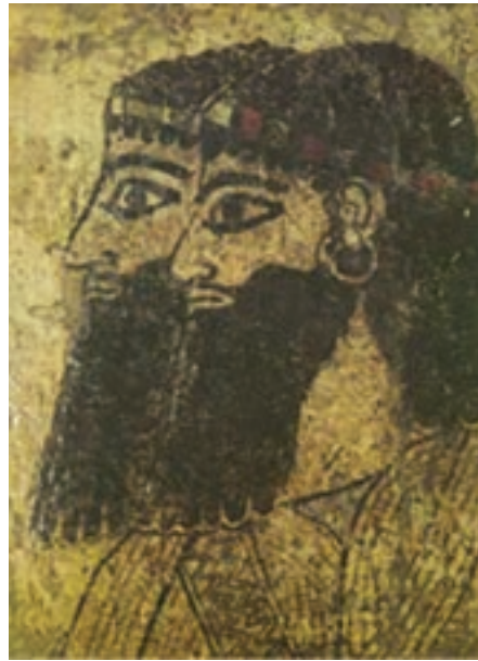
تصویر ۱۳- دو بزرگ زاده آشوری، بخشی از یک نقاشی دیواری، کاخی در سوریه، حدود ۸۵۰ تا ۸۰۰ پیش از میلاد موزه حلب، سوریه