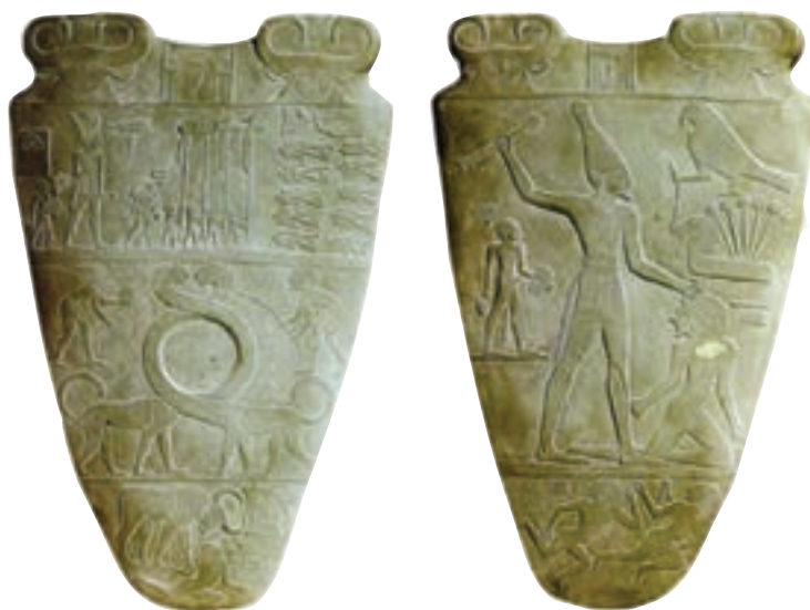
تصویر ۲- لوح سنگی (پشت و رو) منسوب به نارمر، حدود ۳۱۰۰ پیش از میلاد، بلندی ۶۲ سانتی متر، موزه مصر، قاهره

با شروع سلسله‌های اولیه، هنر حجاری، تندیس‌سازی و نقاشی شکوفا شده و در ساخت مصنوعات هنری، قواعدی پایه‌گذاری شد، بطور مثال در حجاری و تندیس‌سازی همیشه پای چپ جلوتر است. مهمترین اثر هنری این دوره که برای شناخت خصوصیات هنر مصر مناسب است یک لوح سنگی است که به شاه نارمر ۱ نسبت داده می‌شود. نقش‌کنده کاری شده در دو سوی این لوح به یک رویداد سیاسی اشاره دارد و گویای اتحاد مصر علیا و سفلی توسط نارمر است (تصویر ۲). در این دوره ساخت مقبره اهمیت یافت. مقبره‌ها را به صورت حفره‌های مستطیل شکل می‌ساختند و متوفی را داخل آن قرار داده و روی آن را با سقف چوبی پوشانده و درون آن هدایا و لوازم زندگی برای جهان بعد از مرگ قرار داده و سطوح داخلی آن را با نقاشی و حجاری تزیین می‌کردند.