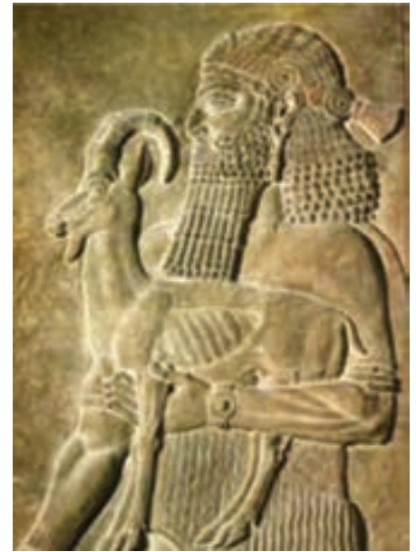
تصویر ۱۲- یکی از هدیه آورندگان، حجاری روی سنگ مرمر، کاخ سارگون دوم، شهر آشور (خورس آباد کنونی)، حدود ۷۲۰ پیش از میلاد، موزه لوور، پاریس

روبرو نشان داده شده است ۱ (تصاویر ۱۲ و ۱۳). در میان مجسمه‌های آشوری، شیران و گاوان بالدار با سر انسان، از همه جالب‌تر هستند. این تندیس‌ها اغلب در دو سوی ورودی کاخ‌ها قرار می‌گرفتند. وظیفه این موجودات حمایت از کاخ‌های سلطنتی و دفع نیروهای شر بود. حجاران انسان - گاو‌ها را با پنج پا بازنمایی کرده‌اند که قصدشان القای حرکت از دید جانبی بوده است (تصویر ۱۴).