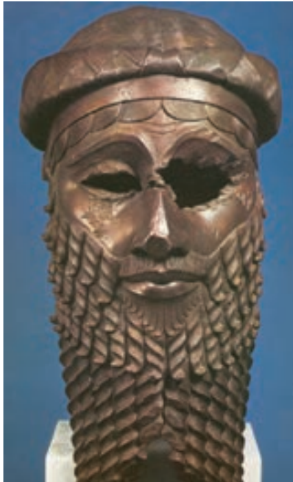
تصویر ۸- سر حاکم اکّدی (احتمالاً سارگون)، مفرغ، نینوا، حدود ۲۳۰۰ تا ۲۲۰۰ پیش از میلاد، موزه عراق