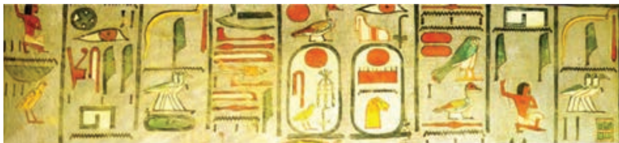
تصویر ۱- خط تصویری هیروگلیف، مقبره رامسس اول، ۱۲۹۰ پیش از میلاد، مصر

مصریان باستان میراث هنری ارزنده‌ای از خود به یادگار گذاشتند که با هنرهای دیگر تمدن‌های جهان تفاوت دارد، آنها همیشه جلوه‌های خوب زندگی را در آثارشان منعکس می‌کردند و برای زنده‌نمایی پیکره‌ها از رنگ استفاده می‌کردند. نقاشی‌ها و نقوش برجسته آنها دو بعدی و توصیفی است. طبق سنت آنها، پیکره باید از بهترین زاویه نمایش داده شود. از این رو در نقاشی‌های افراد مهم، سر با نمای نیم رخ، اما چشم‌ها و شانه‌ها از روبرو، سینه‌ها از نیم رخ، کمر و کفل در نمای سه رخ، و پاها از نیم رخ و در حالتی آرام و با وقار نشان داده شده‌اند، ولی افراد فرودست پرتحرک و زنده هستند. هنر مصری هنر محافظه کار، ایستا و با دوامی است که در طول تاریخ خود یکسان مانده است. هنر مصری به خاطر استفاده آگاهانه از هندسه در معماری، شیوه تندیس سازی، خوشنویسی (خط هیروگلیف، تصویر ۱)، ساخت تالارهای ستون‌دار بر تمدن‌های یونان و روم و دیگر تمدن‌های خاورمیانه تأثیر گذار بوده است.