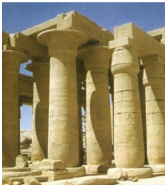
تصویر ۱۳- ستون‌های معبد رامسس دوم، حدود ۱۲۶۰ پ.م