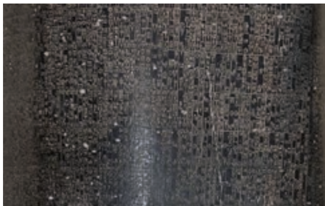
تصویر ۱۵ - ب - بخشی از خط نوشته لوح سنگی حمورابی