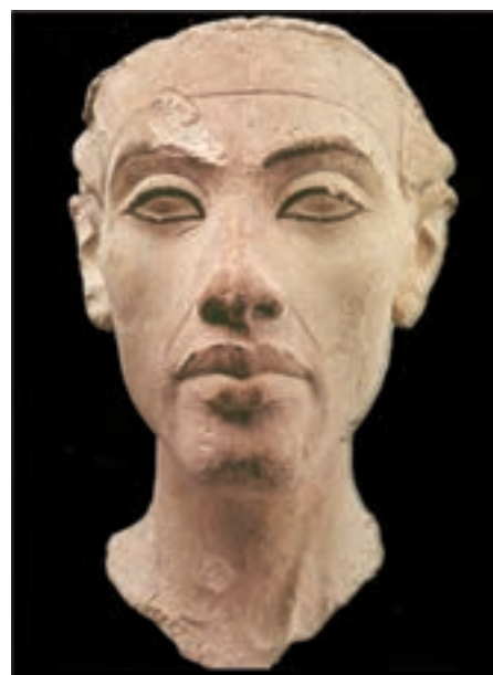
تصویر ۱۰- سر اخناتون، سلسله‌های جدید، ارتفاع ۲۶ سانتی متر، ۱۳۴۰ پ.م، برلین

نشان می‌دهند که مجموعه آن به نام کتاب مردگان شهرت یافته است (تصویر ۱۲). آخرین فرمانروایان قدرتمند مصر، رامسس دوم و سوم هستند که بار دیگر مصر را به اوج قدرت رساندند. یادگار برجسته معماری عهد آنها کاخ‌ها و معبد آمون در الاقصر است که دارای سر در، تالارهای ستوندار و حیاط است (تصویر ۱۳ و ۱۴).