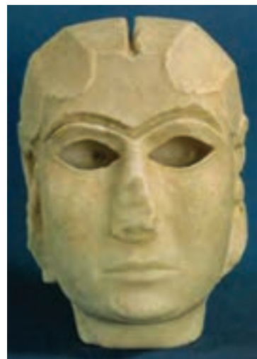
تصویر ۲- سردیس ملکه اوروک از سنگ مرمر، اوروک، حدود ۳۳۰۰ تا ۳۰۰۰ سال پیش از میلاد، موزه عراق

و حاکمان و نیایشگران در حالت‌های ایستاده و نشسته ساخته شده‌اند. نیایشگران معمولاً ایستاده و دست به سینه مجسم شده‌اند. در ساخت این تندیس‌ها کمتر به جزئیات توجه شده و بیشتر به بالا تنه و چشم‌ها تأکید شده است. یکی از هنرمندان‌ترین آنها، سردیس زنانه‌ای از مرمر سفید است که احتمالاً به ایزد بانویی تعلق دارد و بسیار خوش ساخت است و به احتمال زیاد حفره چشم‌ها و ابروها با ماده‌ای رنگین ترصیع شده بوده‌اند. لب و چانه با ظرافت حجم پردازی شده و برجستگی نرم گونه‌ها که با نگاه خیره و بزرگ چشم‌ها همراه شده، حالتی از قدرت و حساسیت را به وجود آورده است (تصویر ۲).