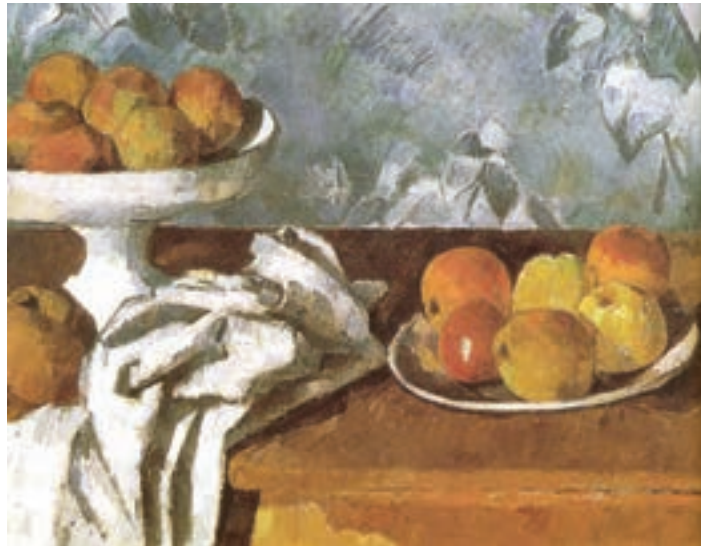
تصویر ۱۷- نقش اشیا، اثر پل سزان، حدود سال‌های ۱۸۸۲-۱۸۷۹ میلادی، رنگ روغن روی بوم، ۴۶×۵۵ سانتی‌متر، کلکسیون خصوصی

«سزان» ۶ از دیگر نقاشان این مکتب، با روش علمی در صدد یافتن قواعد جدیدی برای نظم دادن به تجربه و ادراک رنگ بود (تصویر ۱۷). از نظر سزان «نقاش باید طبیعت را به شکل استوانه، کره و مخروط نشان دهد».