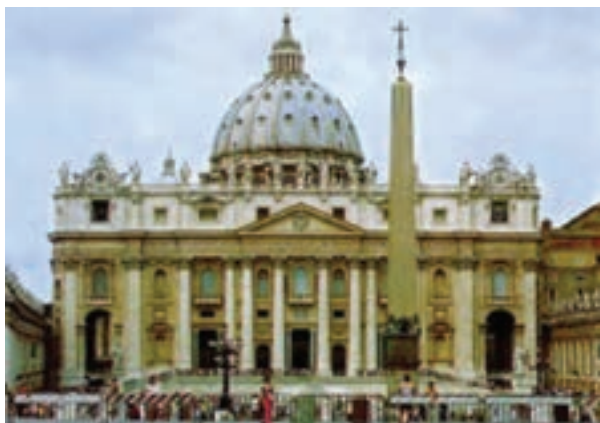
تصویر ۱- کلیسای سن‌پیر روم، نما اثر کارلو مادرنو، ستون کاری اثر برنینی، حدود ۱۶۱۲-۱۶۰۷ میلادی

معماری باروک با ساخت کلیساهای بزرگ از شهر رُم شروع شد. معماران این عصر نیز مانند دوره رنسانس هم پژوهشگر و هم در چند رشته تخصص داشتند، معماری باروک بنا به سلیقه معمار یا سفارش‌دهنده از سنت‌های مختلفی چون کلاسیک باستان، گوتیک و رنسانس در یک بنا سود می‌برد و تلاش می‌کرد بین عناصر مختلف هماهنگی ایجاد کند. در معماری باروک استفاده از شکل بیضی به جای دایره در گنبدها، پنجره‌ها و سقف رایج شد. سطوح محدب و مقعر، تأکید بر مرکز ساختمان، ارتباط معماری با فضای پیرامون، تأکید تزئینات داخلی و تلاش برای هماهنگی میان معماری، نقاشی و تندیس‌سازی بود. کارلو مادرنو ۲ و برنینی ۳ از بنیان‌گذاران معماری باروک در شهر رُم بودند. نما و صحن بیرونی