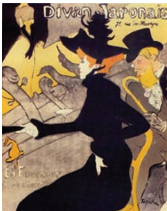
تصویر ۱۹- پوستر، اثر هانری دو تولوز- لوترک، ۱۸۹۲