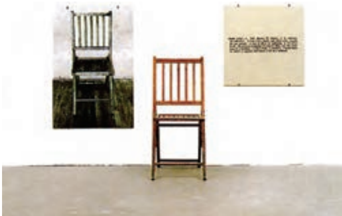
تصویر ۱۵- هنر مفهومی، یک و سه صندلی اثر جوزف کازوت، ۱۹۶۵

شکل‌های جدید هنر: از سوی دیگر محیط ۲ ، چیدمان ۳ و اجرای نمایشی ۴ و تمام جاذبه‌های هنری مستتر در این سه عنصر توجه هنرمندان را به خود جلب کرد. امروزه فعالیت‌های نمایش گونه و ژست‌های اجتماعی، رخداد هنری تلقی می‌شوند. هنر جدید در اشکال هنرچیدمان، هنر ویدئو، هنر عکس و هنر محیطی ظاهر شده است (تصویر ۱۷).