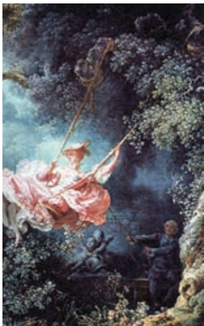
تصویر ۷- بخشی از تابلو به نام تاب، اثر فراگونار

اصطلاحی در تاریخ هنر برای توصیف هنر تزئینی در زمینه‌های مختلف، چون تزئینات معماری، نقاشی، تندیس‌سازی، طراحی ائانیه، اشیای زینتی و غیره پدید آمد. واژه روکوکو از واژه فرانسوی روکای به معنی «سنگریزه» گرفته شده است و به سنگریزه‌ها و صدف‌هایی اطلاق می‌شود که برای تزئین فضای داخل غارها و سرداب‌های مصنوعی به کار برده می‌شوند. واتو ۲ از برجسته‌ترین هنرمندان سده هجدهم میلادی سبک خاصی را آفرید که پس از او به روکوکو انجامید. نقاشی این دوره، سرشار از جلوه‌های پراحساس و حتی شاد و فریبنده با موضوع‌های دنیوی و سبکسرا، رنگ‌های لطیف و خطوط منحنی و منطبق با سلیقه اشرافیت است. فراگونار ۳ ، که نقاشی‌های او تزئینی با رنگ‌های چشم‌نواز است از نمایندگان این سبک به‌شمار می‌رود (تصویر ۷).