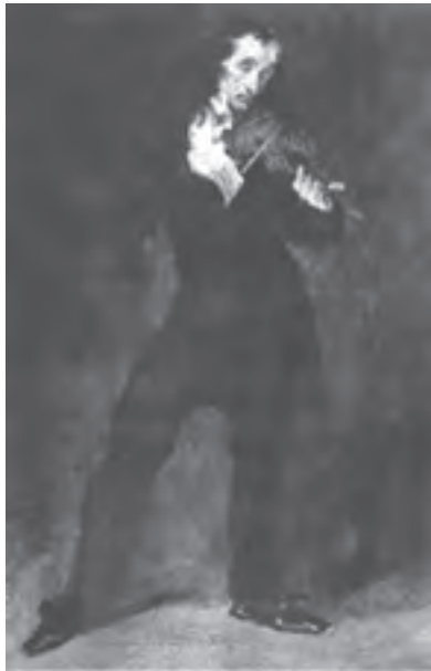
تصویر ۱۰- باگانی، انر اوژن دلاکروا، حدود ۱۸۳۲، رنگ روغن روی مقوا، ۲۸×۴۲ سانتی‌متر، مجموعه فیلیس، واشنگتن

جنبش‌های اجتماعی این عصر سبب دگرگونی در ذهن انسان اروپایی شد. در این مکتب نقاشان کارگاه نقاشی را رها کردند. آنها به طبیعت عشق می‌ورزیدند و براساس عاطفه و ذهن هنرمند رنگ‌ها را تابناک و سرزنده به تصویر می‌کشیدند. موضوعات معمولی و چهره‌های عادی را انتخاب و جایگزین تناسبات رسمی و قراردادی کردند. لازم به ذکر است که اینها همه در عصر «انقلاب صنعتی» یعنی گریز از ماشین و پناه بردن به دامان طبیعت بود. شاخص‌ترین هنرمند رمانتیک دلاکروا ۲ است که دامنه امکانات بیانی این هنر را گسترش فراوان داد. او شیوه رنگ‌پردازی و قلم‌زنی خود را به نقاشان بعدی مخصوصاً به امپرسیونیست‌ها انتقال داد. هنر نقاشی در عصر رمانتیسیسم، بیشتر موضوعات را از ادبیات الهام می‌گرفت. دلاکروا نیز داستان‌های تابلوهایش را عموماً از ادبیات و رخدادهای روزگار خود بر می‌گزید (تصویر ۱۰).