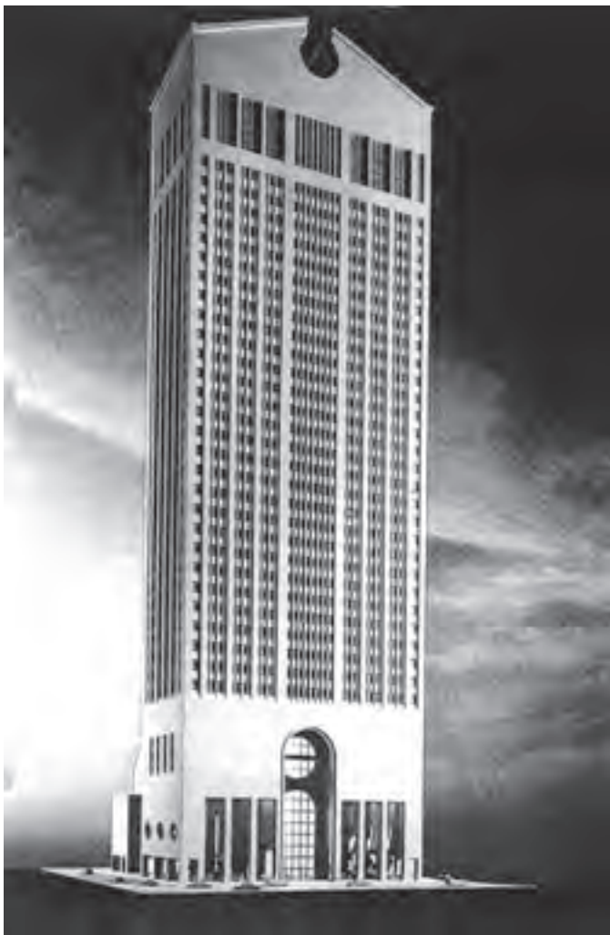
تصویر ۱۶- معماری پست مدرن، ساختمان سونی، اثر فیلیپ جانسون ۱۹۸۳، نیویورک (یادآور کمد قدیمی)