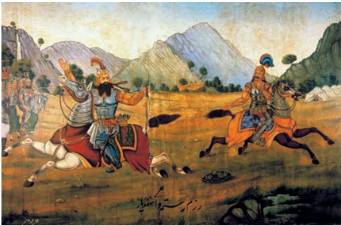
تصویر ۷۰-۲- جنگ رستم و اسفندیار، اثر محمد مدّیر، رنگ روغن روی بوم.

نقاشی قهوه‌خانه‌ای با نقاشانی هم‌چون حسین قولر آقاسی و محمد مدّیر در اوایل سده‌ی حاضر به اوج خود رسید و بر هنر معاصر تأثیر گذاشت. این نقاشان شاگردانی چون حسین همدانی، حسن اسماعیل‌زاده و عباس بلوکی‌فر را پرورش دادند. امروزه با رشد ارتباطات و رسانه‌هایی نظیر رادیو و تلویزیون، این‌گونه آثار روایی که با نقّالی (و نمایش سنتی تعزیه) ارتباطی نزدیک داشت و دیگر کارکرد خود را از دست داده‌اند، از رونق افتاده است (تصاویر ۷۰-۲، ۷۱-۲ و ۷۲-۲).