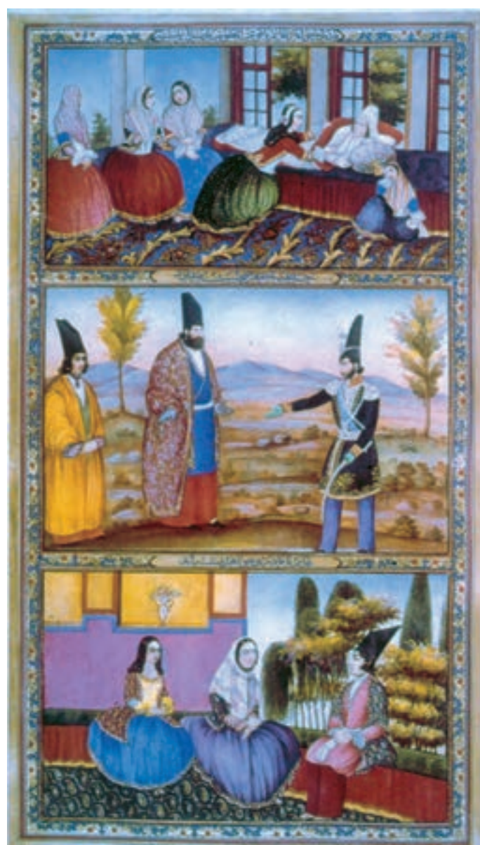
تصویر ۶۰-۲- برگي از کتاب هزار و یک شب، اثر صنیع الملک، آب رنگ روی کاغذ ۱۲۷۵ هـ. ق.