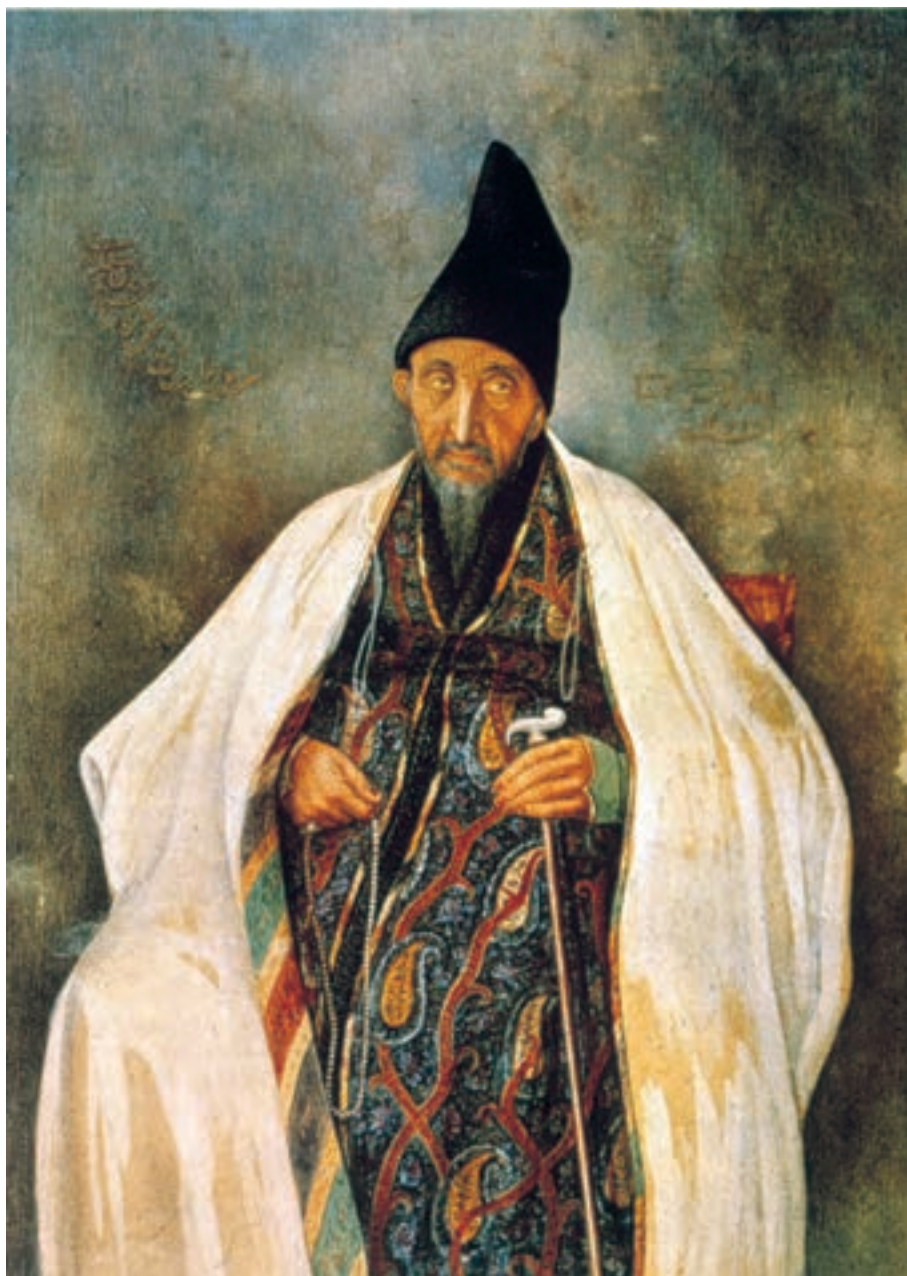
تصویر ۵۸-۲- چهره‌ی حاج‌میرزا آغاسی، اثر صنیع‌الملک، رنگ روغن روی بوم، حدود ۱۲۷۰ ه.ق

۱۳۱۳-۱۲۶۴ ه.ق) به ایران بازگشت و با لقب صنیع‌الملک به مقام نقاش‌باشی دربار منصوب شد. غفاری اگرچه اصول و قواعد علمی طبیعت‌نگاری را درک کرده بود ولی سنت‌های هنر ایرانی را نیز از نظر دور نمی‌داشت. برخی از اولین روزنامه‌های ایران، از جمله روزنامه‌ی دولت علیّه‌ی ایران، به همت وی و به دستور ناصرالدین‌شاه انتشار یافت، به همین مناسبت وی را می‌توان پدر هنر گرافیک ایران نامید. غفاری چهره‌پرداز توانایی بود و چهره‌ی رجال را برای چاپ در روزنامه‌ها طراحی می‌کرد. از طرفی دیگر، وی اولین مدرسه‌ی آموزش هنر نقاشی را با عنوان مجمع‌الصنایع در تهران راه‌اندازی کرد و در این مجموعه‌ی هنری شیوه‌های هنر واقع‌گرای نقاشی غربی را آموزش داد. هم‌چنین توسط ناصرالدین‌شاه مصورسازی کتاب هزارویک شب به او سپرده شد که توانست با کمک همکاران و شاگردانش بیش از هزار تصویر برای این کتاب ۶ جلدی بسازد (تصاویر ۵۸-۲، ۵۹-۲ و ۶۰-۲).