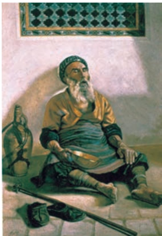
تصویر ۶۷-۲- سقای خسته، اثر رسام ارژنگی، رنگ روغن روی بوم، ۱۳۰۱ ه.ش.