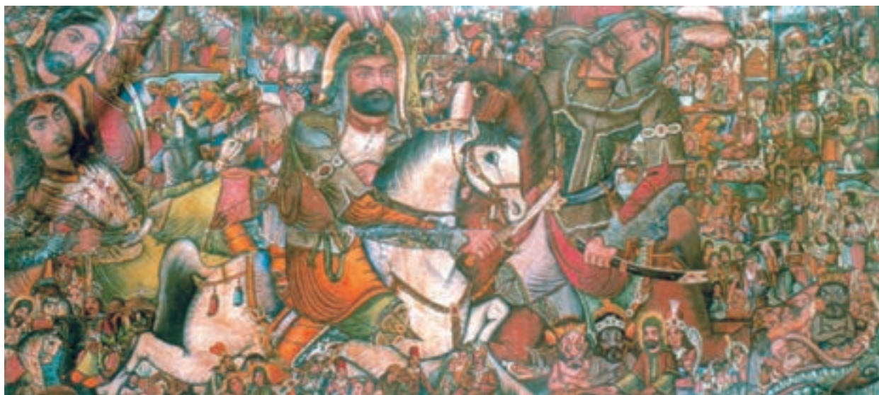
تصویر ۷۲-۲- جنگ حضرت ابوالفضل (ع)، اثر حسین همدانی، رنگ روغن روی بوم، ۱۳۳۰ ه.ش.

ج) نگارگری جدید: در دوره‌ی قاجار نگارگران و تذهیب کارانی در اصفهان یا تهران بودند که اغلب به تقلید از آثار مکتب اصفهان می‌پرداختند. اینان در واقع در حاشیه‌ی عرصه‌ی هنر قرار داشتند تا آن که در اوایل حکومت رضاشاه تلاش‌هایی برای احیای هنرهای سنتی و صنایع دستی صورت گرفت. از جمله حرکتی تازه در زمینه‌ی نگارگری آغاز شد و مراکزی برای توسعه‌ی این هنر تأسیس گردید.