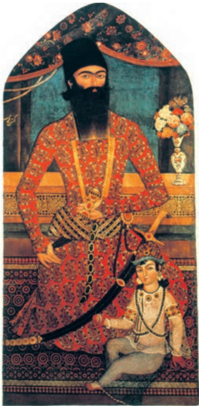
تصویر ۵۷-۲- شاهزاده‌ی قاجار، اثر محمد حسن افشار، رنگ روغن روی بوم، حدود ۱۲۴۰ هـ.ق