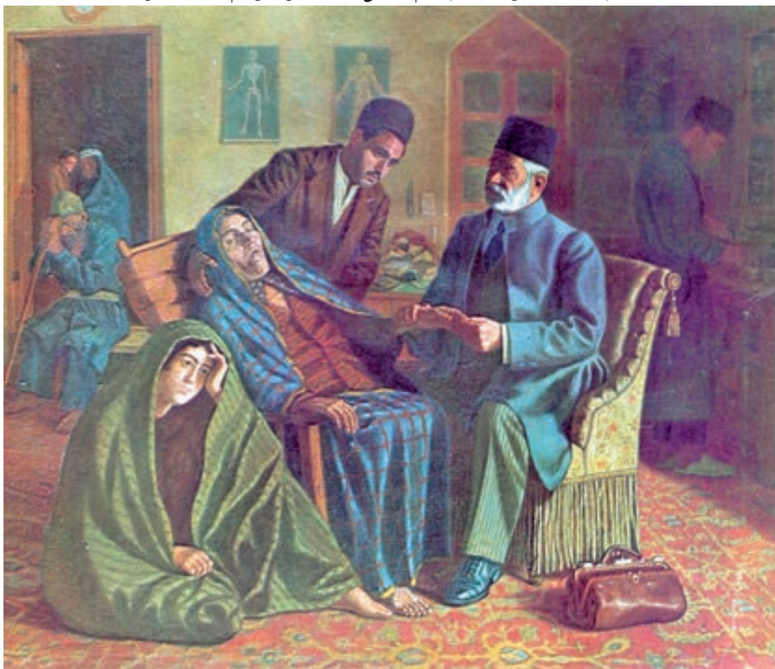
تصویر ۶۸-۲- طبیب و بیمار، اثر حسین شیخ، رنگ روغن روی بوم، ۱۳۱۵ ه.ش.