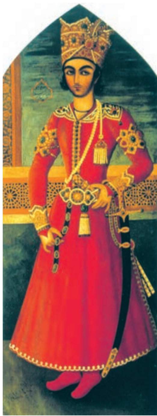
تصویر ۵۶-۲- چهره‌ی عباس میرزا، اثر عبدالله خان، رنگ روغن روی بوم، حدود ۱۲۴۰ هـ.ق