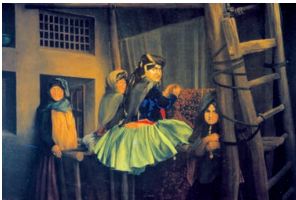
تصویر ۲-۶۳- کارگاه قالی‌بافی، اثر موسی ممیزی، رنگ روغن روی بوم، ۱۲۹۳ ه.ق