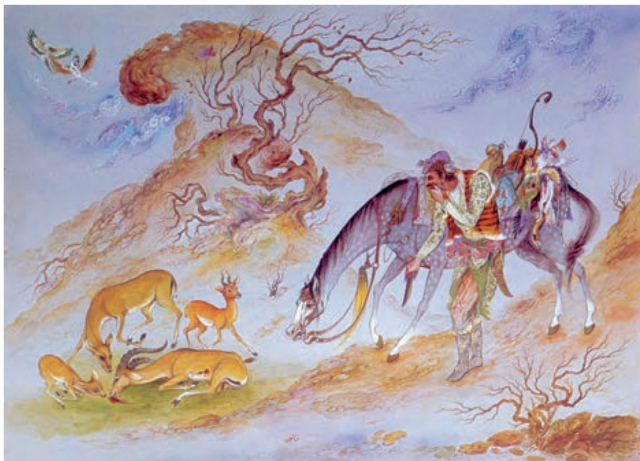
تصویر ۷۵-۲- شکار، اثر محمود فرشچیان، حدود ۱۳۴۰ ه.ش

د- نقاشی نوگرا (مدرن): نفوذ گسترده‌ی گرایش‌های نقاشی مدرن به داخل ایران، همزمان با جنگ جهانی دوم و به موازات رفتن رضاشاه از ایران و برقراری مختصر آزادی‌های اجتماعی و سیاسی، اتفاق افتاد. تشکیل دانشکده‌ی هنرهای زیبا، اعزام گسترده‌ی دانشجویان برای فراگیری هنر به اروپا و تدریس استادان اروپایی در مراکز هنری ایران و توسعه‌ی ارتباطات جهانی، عواملی بود که گروه‌های تحصیل کرده و نوجوی هنر را به سوی هنر مدرن اروپایی کشاند. البته این درحالی بود که حدود ۷۰ سال از پیدایش مکتب‌های مدرن در اروپا می‌گذشت.