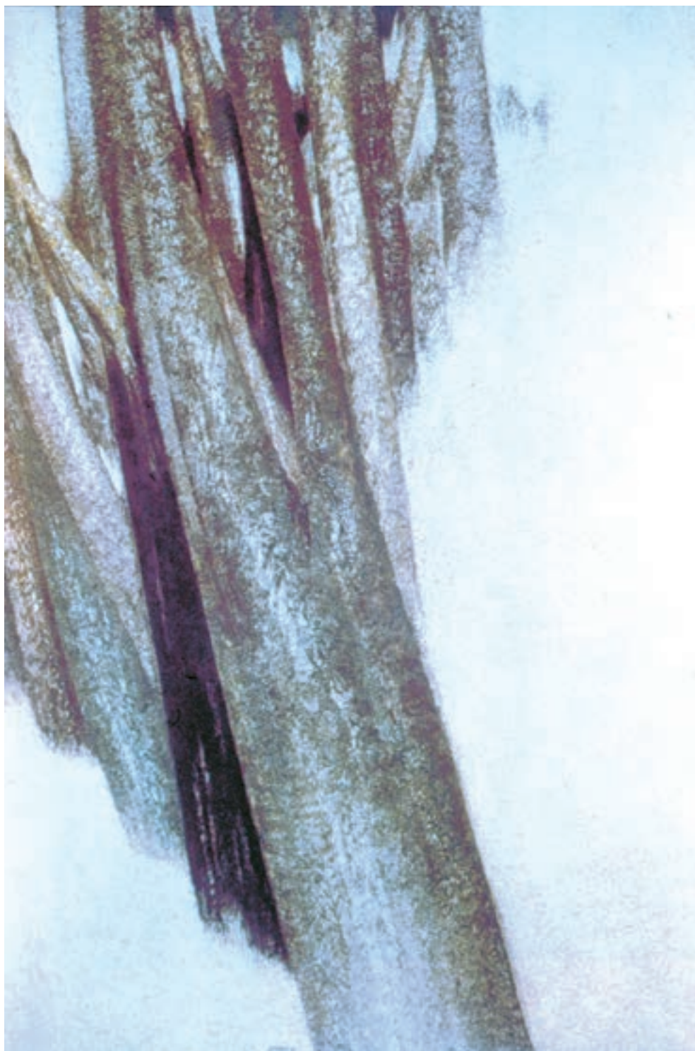
تصویر ۲-۷۶- درخت‌ها، اثر سهراب سپهری

نقش‌های چسباندنی (کولاژ) و یا از مواد و مصالحی متنوع شکل گرفته‌اند. از هنرمندان گرایش‌های مدرن در نقاشی ایران می‌توان به جلیل ضیاپور، جواد حمیدی، منصور قندریز، فرامرز پیلارام، حسین زنده‌رودی و سهراب سپهری و ... اشاره کرد (تصاویر ۲-۷۶ و ۲-۷۷).