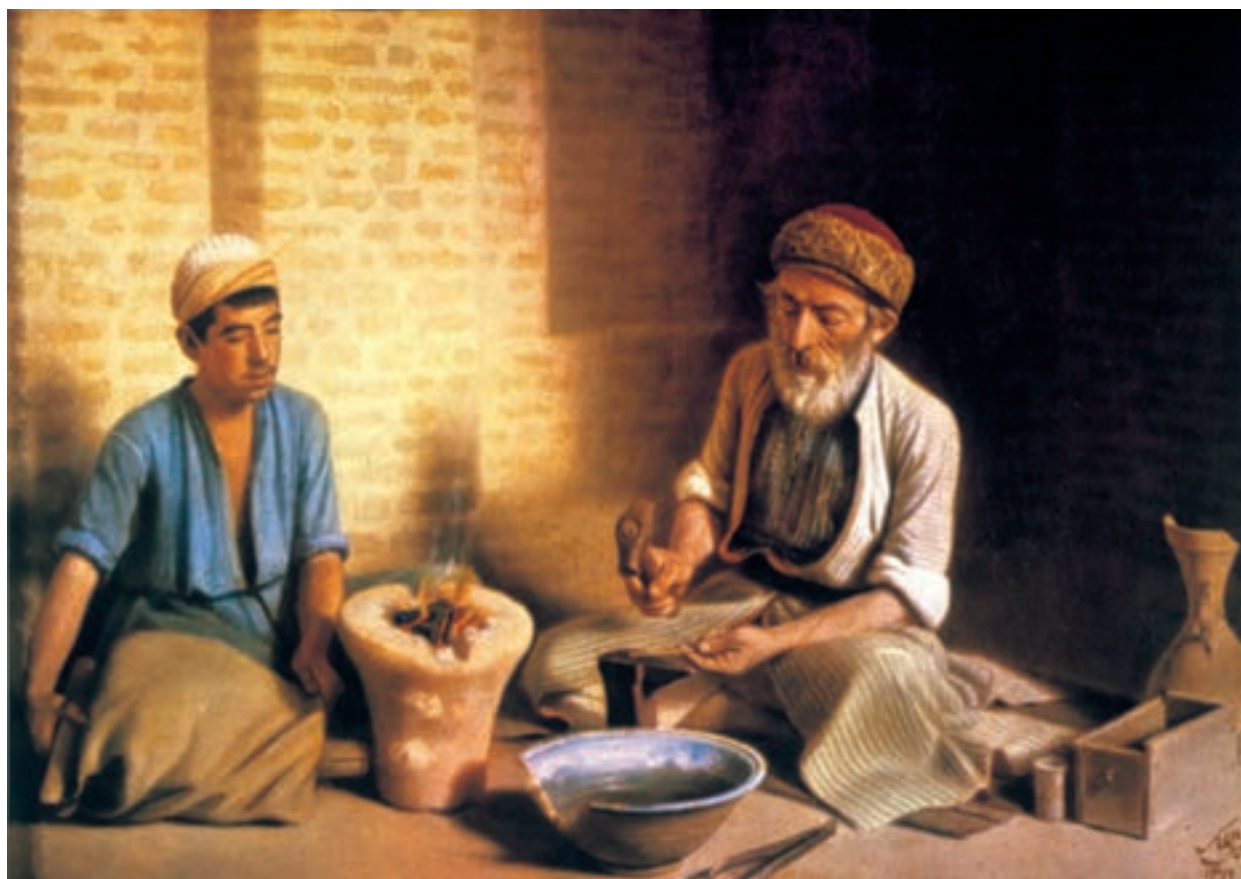
تصویر ۶۶-۲- زرگر بغدادی، اثر کمال الملک، رنگ روغن روی بوم، ۱۳۱۹ هـ.ق.