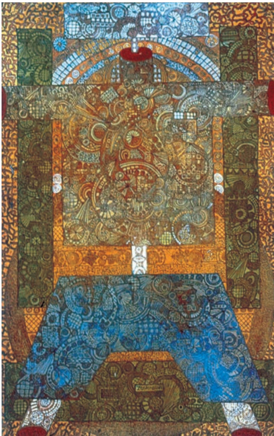
تصویر ۷۷-۲. بدون عنوان، اثر حسین زنده رودی