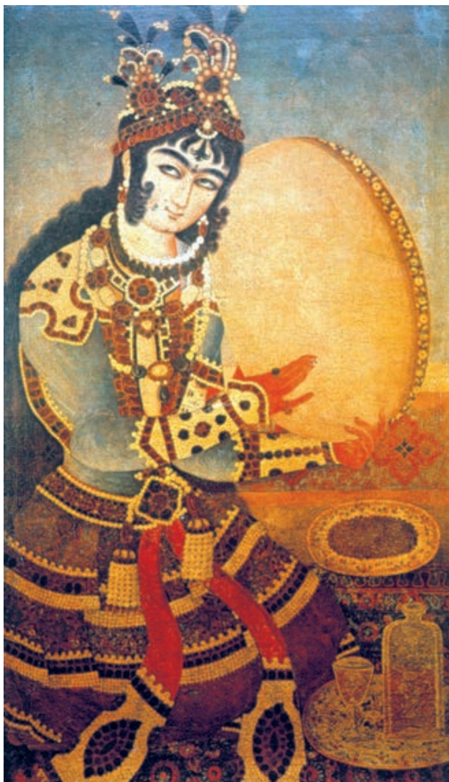
تصویر ۵۳-۲- نوازنده‌ی دف، اثر ابوالقاسم، رنگ روغن روی بوم، ۱۲۳۰ هـ.ق

موضوع اصلی نقاشی‌های عصر زند و قاجار انسان است ولی انسانی نمایشی که حالتی تصنعی دارد و به روشی تزینی تصویر می‌شود. در این تصاویر نقاش چندان در پی شبیه‌سازی نیست و بیش‌تر به شکوه و جلال ظاهری اهمیت می‌دهد. مردها غالباً افراد مهم جامعه، از جمله شاه و درباریان هستند ولی زن‌ها رامشگران و مطربان‌اند. اگرچه جایگاه اجتماعی زنان و مردان در نقاشی‌های زند و قاجار متفاوت است ولی هر دو در حالتی متظاهرانه و غرق در جواهرات، در کنار پنجره، پرده و یا نرده‌ای مشبک، در حالت روبه‌رو، که نگاهی با وقار و آرام به دور دست‌ها دارند، به تصویر درمی‌آیند. قراردادهای مشترکی در چهره و اندام آن‌ها رعایت می‌شود از جمله چشم‌های خمار، ابروان پیوسته، کمر باریک، دست‌های حنا بسته، و پوشاکی اشرافی که در آن روزگار متداول بود. در این نقاشی‌ها ترکیب‌بندی‌ها متقارن، ایستا و ساده است و اغلب کادرهای عمودی تصویر را یک یا دو پیکر در اندازه‌های بزرگ اشغال می‌کند. اندازه و شکل پرده‌های نقاشی بیش‌تر تابعی از شکل طاقچه‌ها یا فضایی است که تابلو در داخل آن نصب می‌گردد. ابزارها و لوازم موجود در