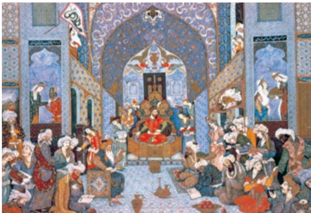
تصویر ۷۴-۲- فردوسی در بارگاه سلطان محمود غزنوی، اثر هادی تجویدی ۱۳۱۵ ه.ش.