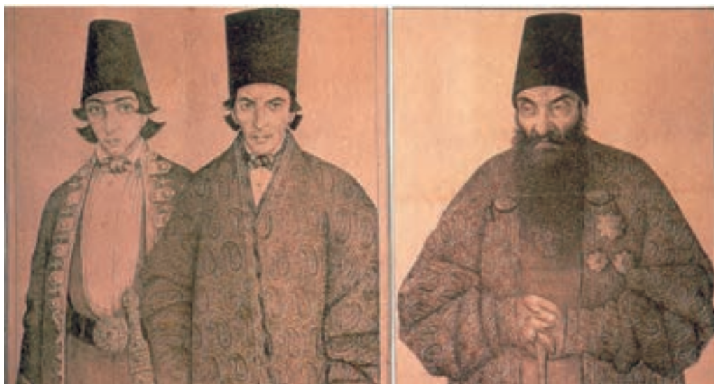
تصویر ۵۹-۲- طراحی از چهره برای چاپ در روزنامه، اثر صنیع الملک.