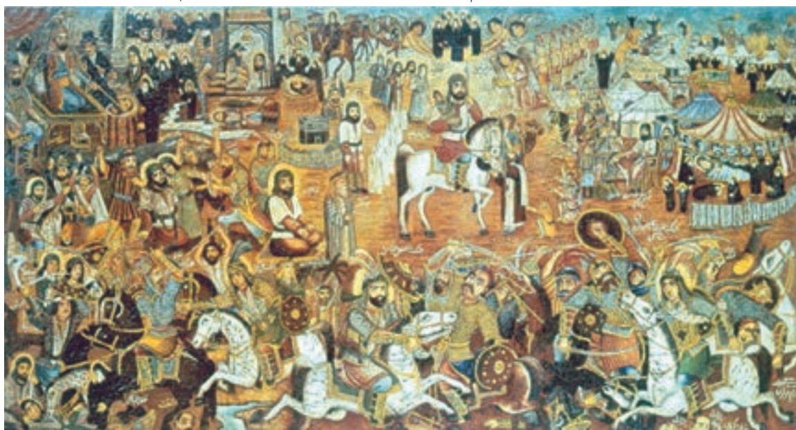
تصویر ۷۱-۲- مصیبت کربلا، اثر حسین قولر آقاسی، رنگ روغن روی بوم، حدود ۱۳۳۰ ه.ش.