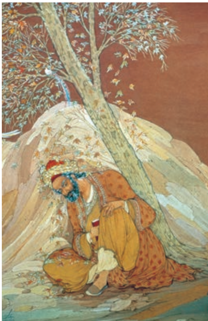
تصویر ۷۳-۲- افسوس که نامهی جوانی طی شد. اثر حسین بهزاد، ۱۳۲۸ ه.ش.