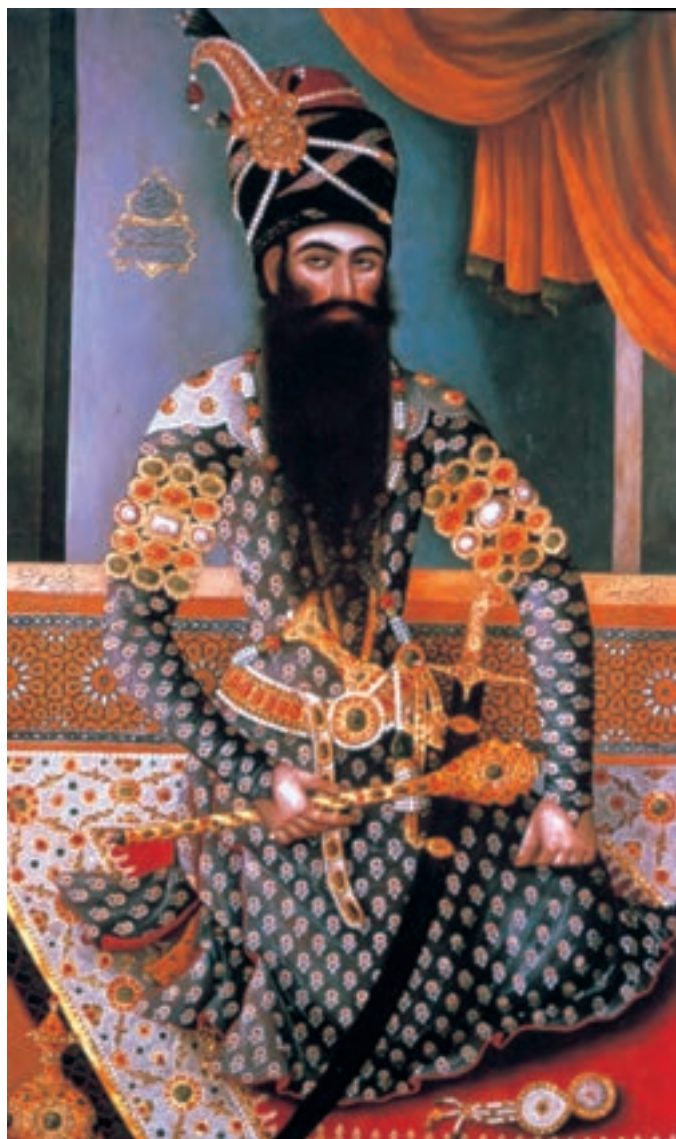
تصویر ۲-۵۴- فتحعلی شاه در لباس رسمی، اثر مهرعلی اصفهانی، رنگ روغن روی بوم، ۱۲۲۸ هـ.ق

در این پیکرنگاری‌ها ترکیب خوشایندی میان سنت‌های خاص نقاشی دو بعد نمای ایرانی و شیوه‌ی سه بعد نما و واقع‌پرداز اروپایی پدید می‌آید. نقاشانی هم‌چون آقاصادق و آقاباقر این شیوه را در شیراز آغاز کردند ولی اوج انسجام ساختاری این آثار در نقاشی استادانی نظیر میرزا بابا و مهرعلی اصفهانی در عهد فتحعلی شاه قاجار دیده می‌شود. دستاوردهای تصویری این دو استاد به مدت پنجاه سال برای نقاشان نسل بعدی یعنی عبدالله‌خان، سیدمیرزا و ابوالقاسم سرمشقی مطمئن می‌شود (تصاویر ۲-۵۴، ۲-۵۵، ۲-۵۶ و ۲-۵۷).