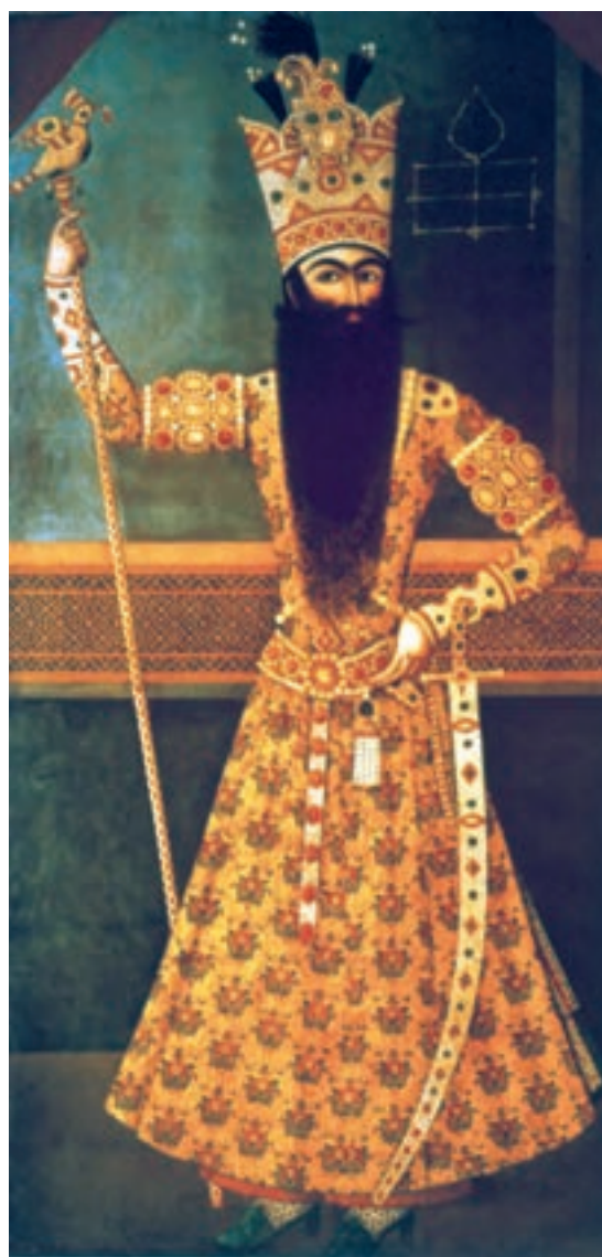
تصویر ۲-۵۵- فتحعلی شاه، اثر میرزا بابا، رنگ روغن روی بوم، ۱۲۱۳ هـ.ق

آویختن این قبیل تابلوها بر دیوار کاخ‌ها و تالارهای اشرافی نشانگر نوعی پیوند میان هنر نقاشی و معماری است در حالی که نگارگری پیوندی تنگاتنگ با ادبیات دارد.