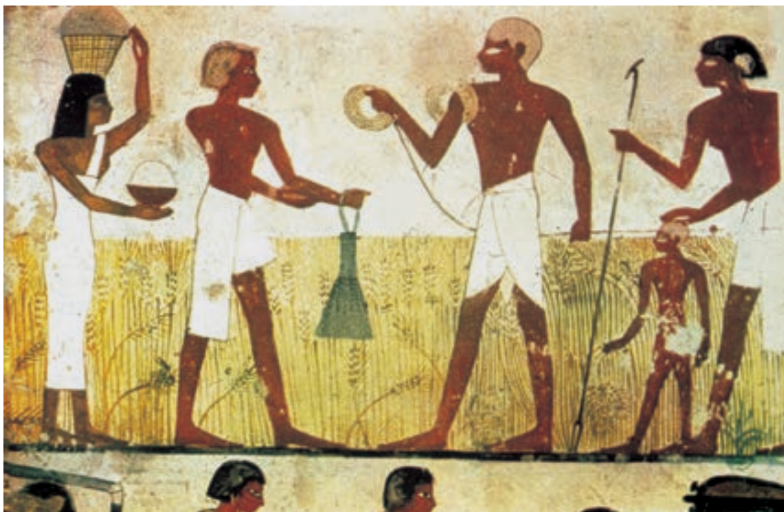
تصویر ۳-۵- پرداخت مالیات، بخشی از دیوار نگاره، حدود ۱۵۰۰ ق. م

اساس کار نقاشی مصری بر روایتگری قرار داشت، بی‌آن که طبیعت‌پردازی کند و یا اشخاص و اشیاء را به همان شکلی که هستند بنمایاند، او از قواعد معینی تبعیت می‌کرد که ناشی از تمایل وی به نمایش مستقیم و واضح و ساده‌ی اشخاص و دنیای پیرامون بود. معمولاً سر و دست و پا از زاویه‌ی نیم‌رخ ولی چشم و نیم‌تنه از زاویه‌ی روبرو ترسیم می‌گردید. این طرز ترسیم اشخاص تابع قاعده‌ای بود که آن را اصل تقابل ۱ گویند و نه تنها در هنر مصر که در هنر سایر جوامع باستانی خاورزمین، از جمله بین‌النهرین نیز، مورد پیروی قرار می‌گرفت ولی مصریان توجه و تأکید بیش‌تری به آن داشتند. (تصویر ۳-۵)