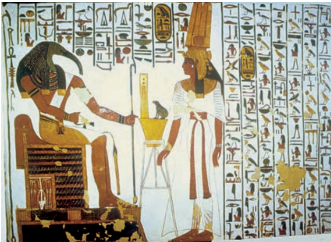
تصویر ۳-۶- نِفرتاری و خدای «توت» بخشی از دیوار نگاره، ابوسمبل، حدود ۱۲۵۵ ق. م خط هیروگلیف، علاوه بر انتقال مفاهیم به موازات دیوار نگاره‌ها، نقشی مؤثر در آراستن فضاها و داخلی بناهای مصری ایفا می‌کرد.

صحنه‌های نقاشی کم‌تر با زمان و مکان مشخصی ربط داشت و پس زمینه‌ها معمولاً دارای طرحی ساده و قراردادی بود. نقاش مصری پرسپکتیو را نمی‌شناخت و اغلب موضوع موردنظرش را در چند بخش ثبت می‌کرد. در نقاشی‌های به‌جا مانده، پایین‌ترین بخش نشان‌دهنده‌ی پیش زمینه است. در هر بخش اشیای عقب‌تر یا داخل اشیای دیگر و یا در بالای آن نشان داده می‌شوند. گاه نیز قطعات و یا پیکرهای جداگانه مراحل مختلف یک عمل را می‌نمایانند. در هر حال اصل بر آن بوده است که نمایش اشیاء و صحنه‌ها صورت توصیفی داشته باشد، نه چنان که در لحظه یا زمان و مکانی معین به نظر آید.