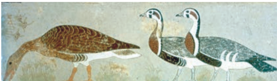
تصویر ۳-۷- غازهای مِدوم، بخشی از دیوار نگاره، بلندی حدود ۴۵ سانتی‌متر حدود ۲۶۰۰ ق. م.

با آن که در دیوار نگاره‌های مصری جنبه‌های قراردادی و خصلت‌های نمادین اهمیت دارد و این شیوه طی تقریباً سه هزار سال، کمابیش بدون تغییر اساسی، تکرار می‌شده‌اند ولی مهارت‌های فنی هنرمند گاه‌به‌گاه، در اجزای نسبتاً کم اهمیت، خود را نشان داده است، مثلاً در شکل حیوانات، و به‌خصوص پرندگان، که نزدیک به شکل طبیعی ترسیم می‌گردیده‌اند. (تصویر ۳-۷)