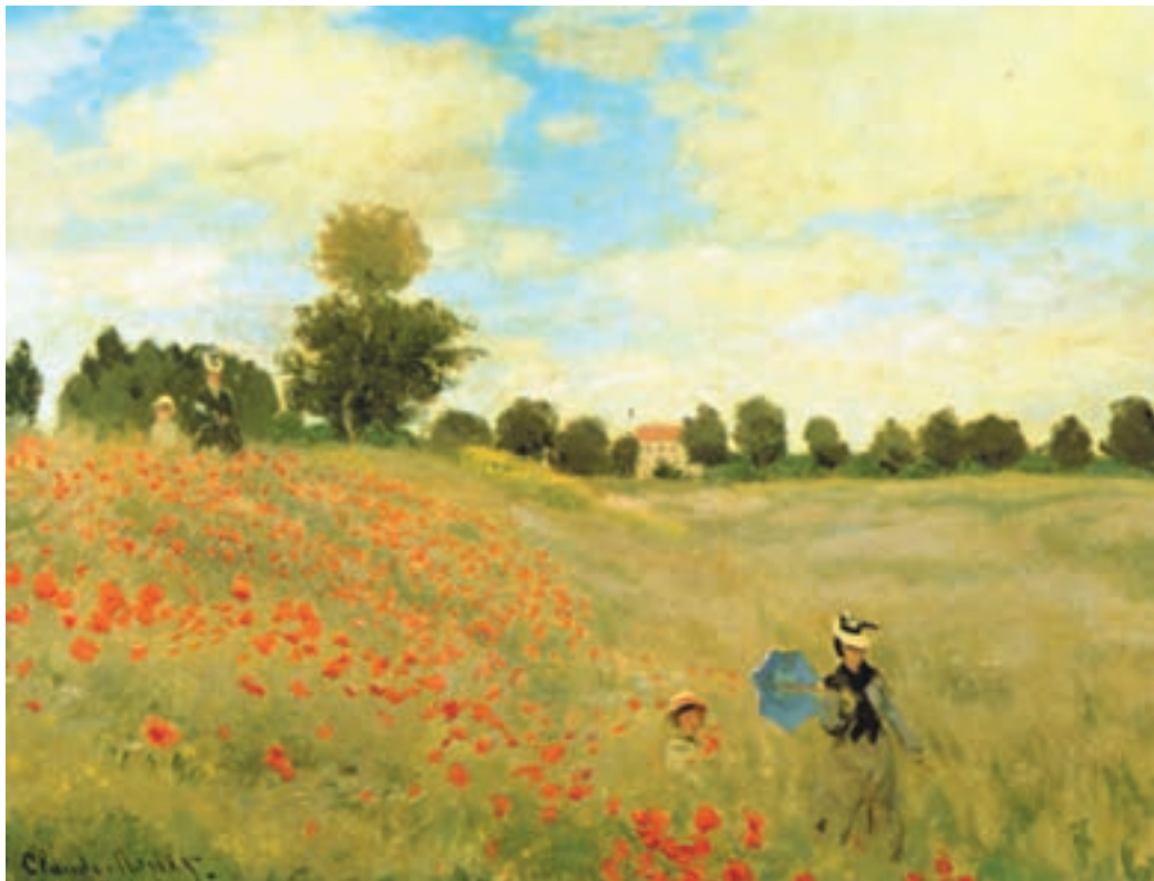
تصویر ۲-۳- اثر کلود مَنه، رنگ روغن روی بوم، (۴۹/۵×۶۴ سانتی‌متر)