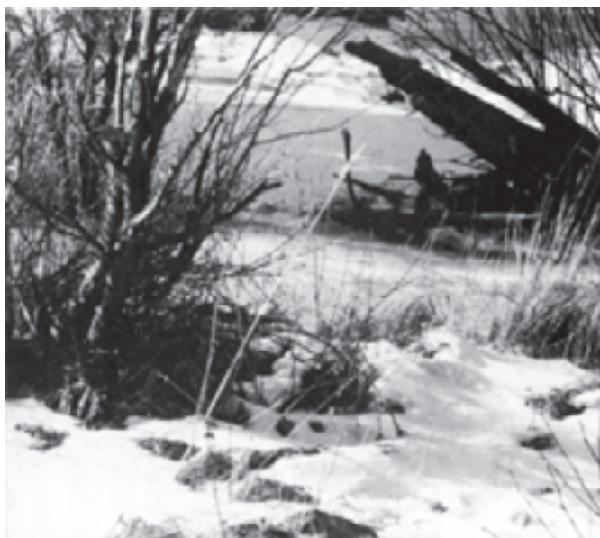
تصویر ۲-۷- عکس از منظره، اثر زابو ۱

تقسیم کادر به این ترتیب، از کل به جزء صورت می‌گیرد و شما در سطح زمین، عناصر دیگر تابلو را قرار خواهید داد که به تدریج به چشم بیننده نزدیک می‌شوند. از جمله کوهها و در جلو آن احتمالاً، درختان و عناصر دیگر را می‌توانید تعیین وضعیّت کنید. توجه به دوری و نزدیکی، پرسپکتیو خطی، وضوح و عدم وضوح عناصر تابلوی شما را به تدریج کامل و کاملتر می‌کند. در این مرحله، همیشه از کلیات شروع کنید و از تأکید بر یک جزء، جداً پرهیزید. در تصاویر (۲-۷) عکس از منظره و (۲-۸) پیش طرح از همان منظره، ملاحظه می‌کنید که در پیش طرح هنرمند چگونه از نمایش جزئیات صرف‌نظر کرده است.