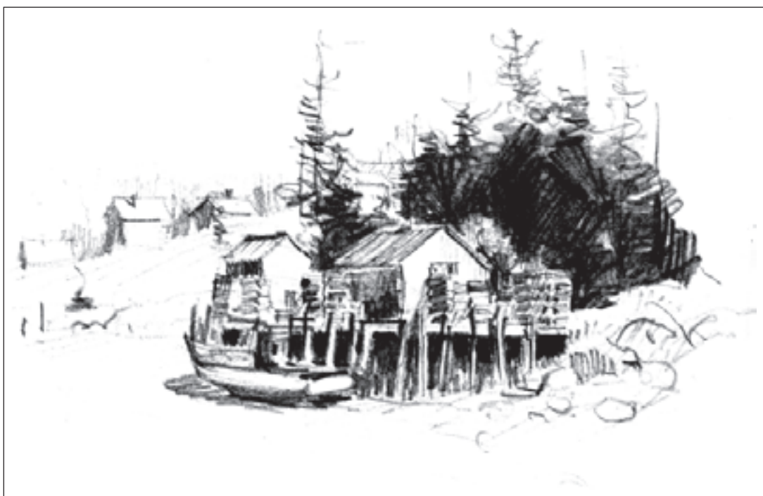
تصویر ۲-۱۰ - پیش طرح از منظره با مداد، اثر کادل