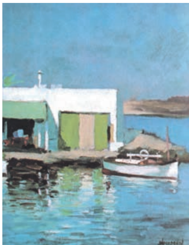
تصویر ۳۴-۲- اثر خوزه پارامون، رنگ روغن روی بوم