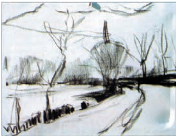
تصویر ۳۵-۲- اثر خوزه پارامون

از موضوع خود، یک پیش طرح ساده با رعایت اصول ترکیب بندی، تهیه کنید. تا حد امکان از توجه به جزئیات در طرح اولیه خود بپرهیزید. تصویر (۲-۳۵) مثال بسیار خوبی برای یک طرح اولیه از طبیعت است.