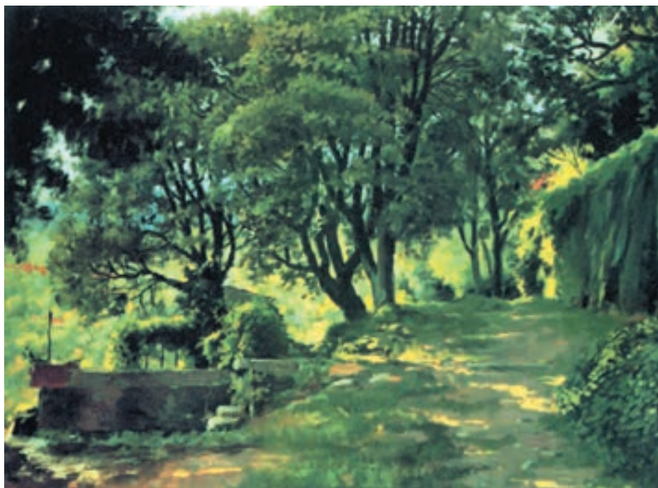
تصویر ۲۸-۲- اثر خوزه پارامون، رنگ روغن روی بوم، حاکمیت رنگ سرد

شما می‌توانید همانند تمرین قبل عمل کنید. منتهی این بار از مجموعه رنگهای خالص سرد در کنار رنگهای ترکیبی سرد بهره بگیرید. حتی مناطق گرم شما در نقاشی نیز با اندکی رنگ سرد ترکیب می‌شود (تصاویر ۲-۲۸ و ۲-۲۹).