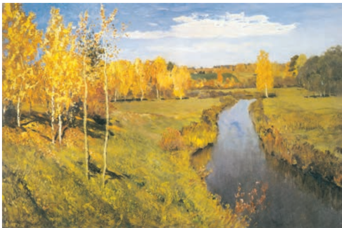
تصویر ۲-۲۶- اثر ایزاک لویتان، رنگ روغن روی بوم، (۸۲×۱۲۶ سانتی‌متر)

در تصویر (۲-۲۶) پاییز طلایی اثر ایزاک لویتان ۱ ، با وجود رنگهای آبی، حاکمیت با رنگهای گرم و به خصوص زرد است. تصویر (۲-۲۷) نیز حاکمیت رنگ گرم را نشان می‌دهد.