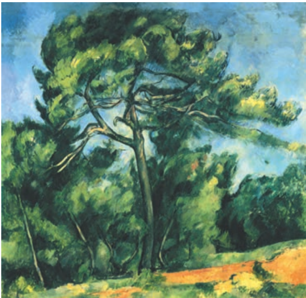
تصویر ۲-۳۰- اثر پل سزان، رنگ روغن روی بوم، (۸۵×۹۲ سانتی‌متر)

سزان نیز در تابلو نقاشی موسوم به «کاج بزرگ» تصویر (۲-۳۰) مجموعه‌ای از رنگهای سرد را به کار گرفته است و با وجود رنگهای گرم بخش پایین اثر و لکه‌های گرمی که در سطح نقاشی دیده می‌شود، حاکمیت با رنگهای سرد است و رنگهای گرم بخش پایین تابلو به عمق نمایی اثر کمک کرده است چرا که جلوتر از رنگهای دیگر دیده می‌شود، تصویر (۲-۳۱) نیز به گروه دیگری از رنگهای سرد اشاره دارد.