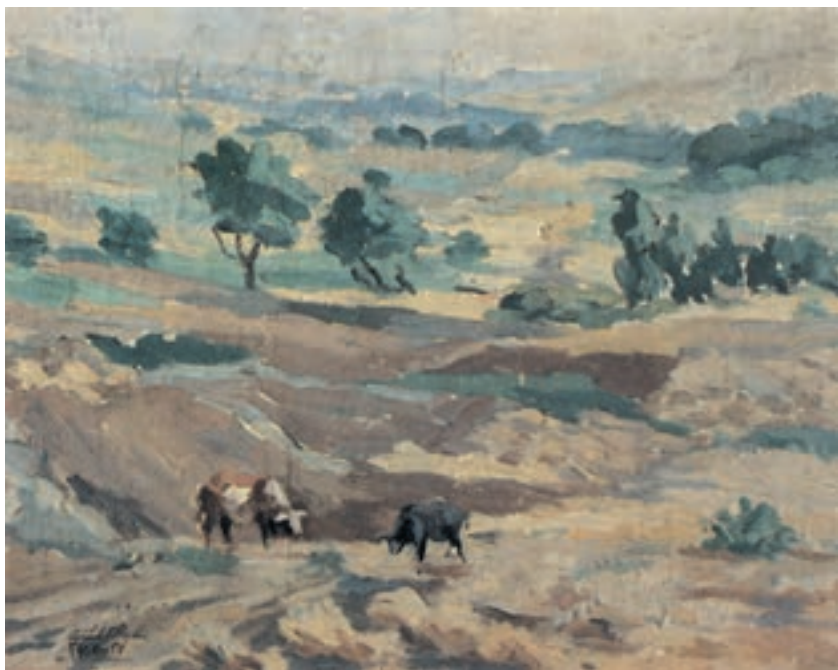
تصویر ۴۱-۲ اثر محمود جواد پور ۲ ، رنگ روغن روی بوم، (۶۰×۴۷ سانتی متر)