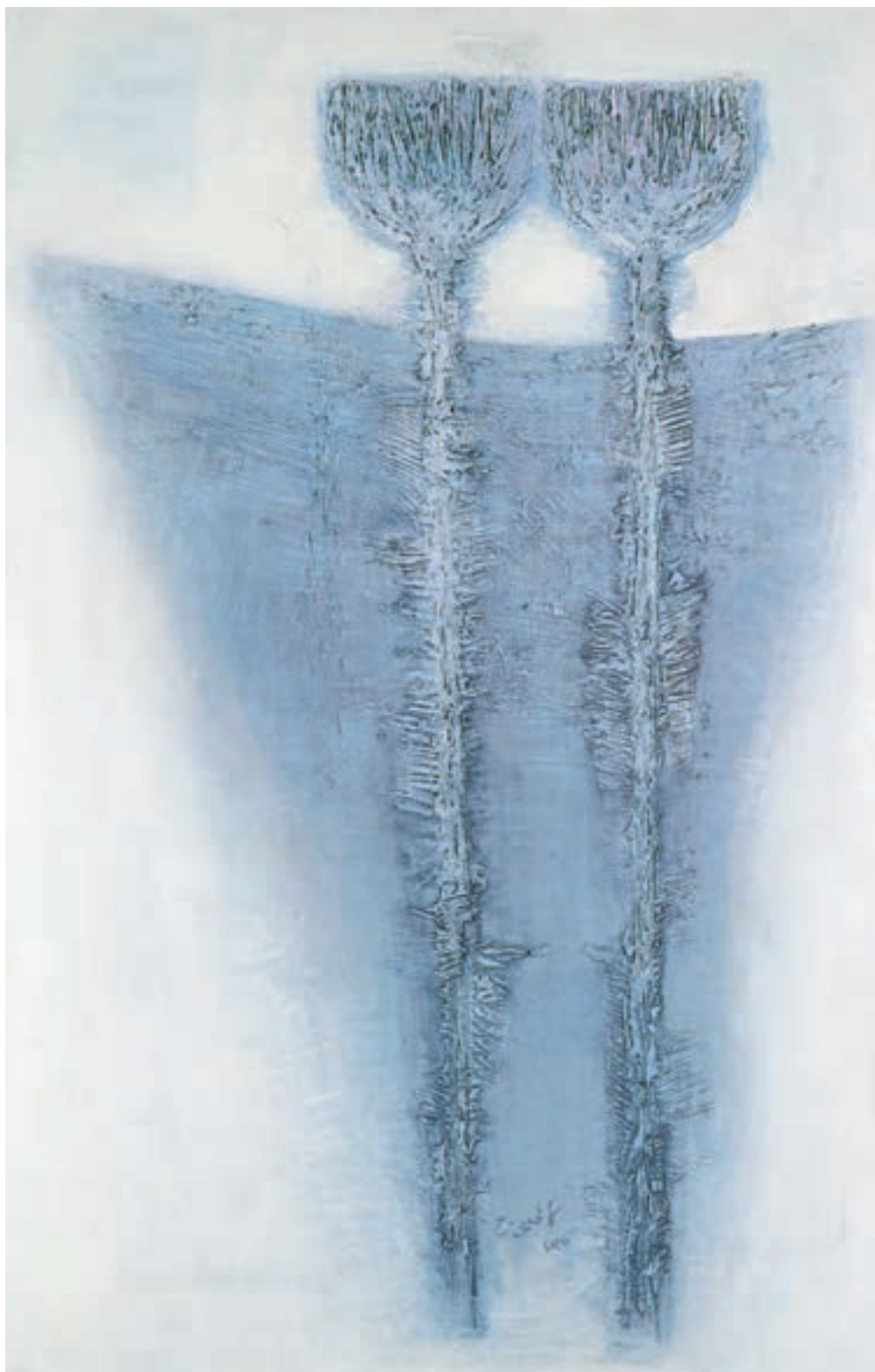
تصویر ۴۲-۲- اثر حسین کاظمی، رنگ روغن روی بوم، (۹۰×۱۴۰ سانتی متر)