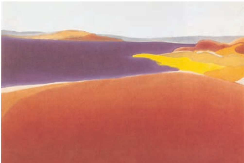
تصویر ۲۷-۲- اثر الیزابت آژُن، اکریلیک روی بوم، (۱۰۲/۶×۱۰۱/۶ سانتی متر)