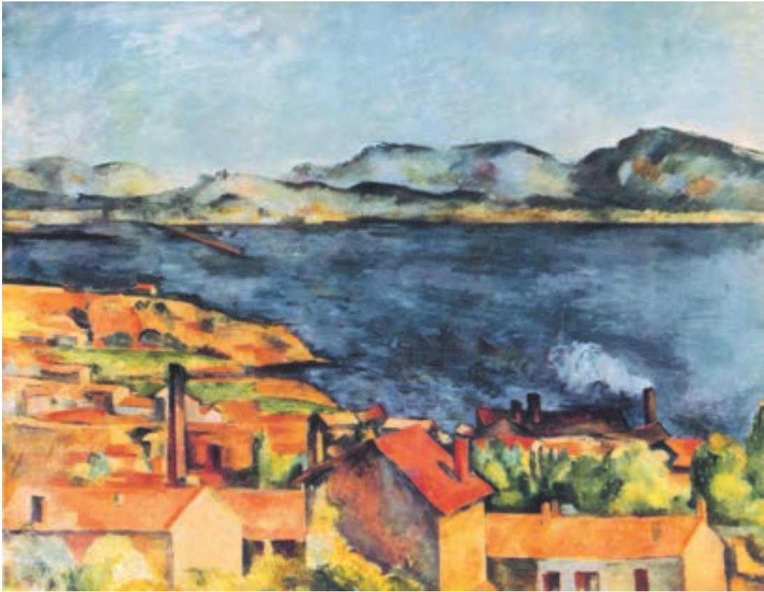
تصویر ۲-۳۲- اثر پل سزان، رنگ روغن روی بوم، (۸۰×۹۷/۷ سانتی متر)