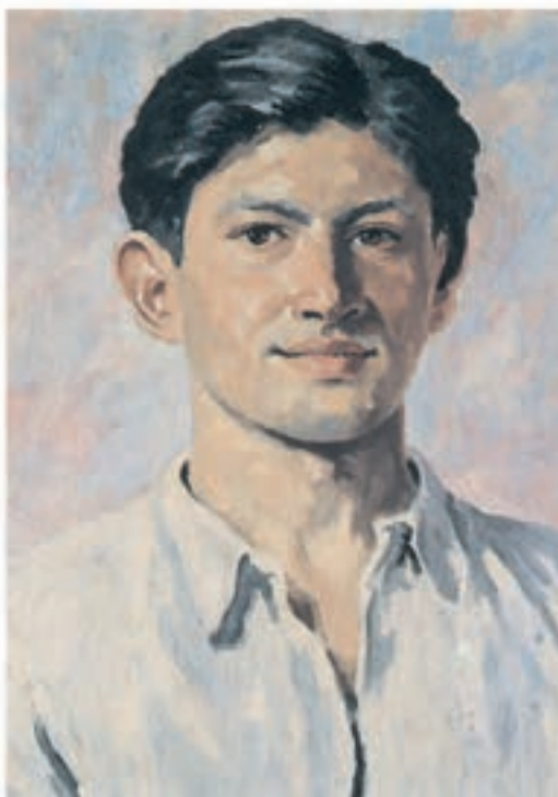
۳۹×۵۷ سانتی متر

تصویر ۲۱-۳- اثر محمود جوادی پور، رنگ روغن روی بوم