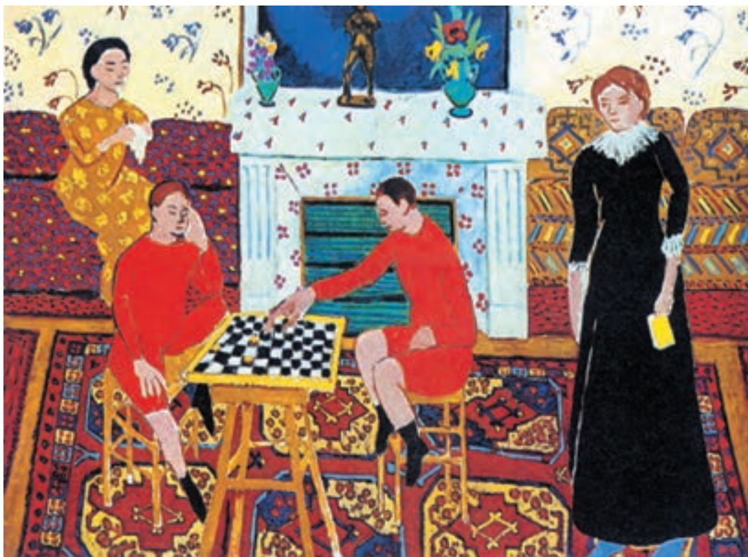
تصویر ۱۳-۳- اثر هانری ماتیس، رنگ روغن روی بوم، (۱۹۴×۱۴۳ سانتی متر)

تصویر (۱۳-۳) اثر هانری ماتیس که از مجموعه چهار پیکره در فضای بسته (اتاق) شکل گرفته است می‌تواند به شما کمک کند. شما نیز به صورت آزاد و با رنگهای اصلی و ثانویه، به صورت تخت، چند فیگور را در داخل فضایی مشخص ترکیب کنید. ماتیس در این اثر آزادی و راحتی نقاشی کودکان را دارد. از طرفی پختگی و تجربه زیاد در شناخت رنگها در ترکیب چند پیکره را به نمایش می‌گذارد. دقت کنید که با وجود حذف جزئیات پیکره‌ها و چهره‌ها و اشیاء، چگونه از نقوش فرش، کاغذ دیواری و مبلمانها، برای هماهنگی و چرخش رنگها استفاده کرده است. تصویر (۱۴-۳) نیز دارای همین ویژگیهاست.