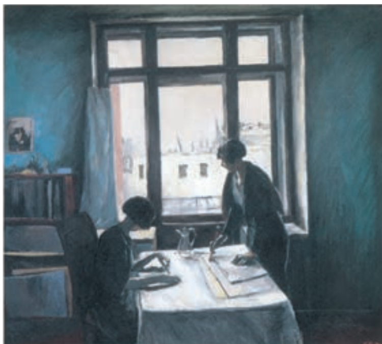
تصویر ۸-۳ اثر کنستانتین ایستومین ۲ ، رنگ روغن روی بوم، (۱۴۱/۵×۱۲۵ سانتی متر)