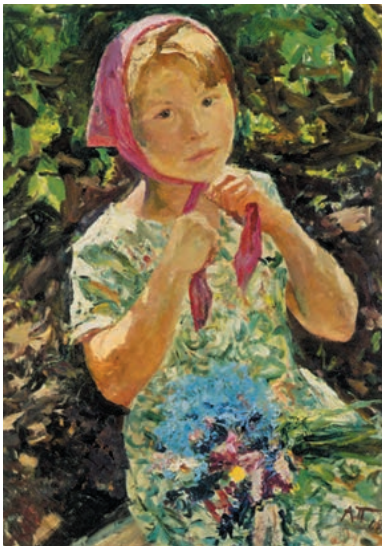
تصویر ۲۰-۳ — اثر آرکادی پلاستف، رنگ روغن روی بوم، (۷۰×۵۰ سانتی‌متر)

طرحی از او و نشانه‌هایی از فضای اطراف او، نظیر درختها و گلها و ... که حضور رنگهای سرد و گرم در آن دیده شود تهیه کنید. در این مرحله، می‌توانید از رنگهای گرم و سرد و ترکیبات آن استفاده کنید دقت کنید که وارد جزئیات نشوید و کلیت موضوع را در نظر بگیرید. بازتاب رنگهای طبیعت در پیکره و پوست و لباس و موهای مدل شما دیده خواهد شد. به تصویر (۲۰-۳) اثر آرکادی پلاستف ۱ نگاه کنید. پیکره در میان درختها نشسته است و روسری خود را محکم می‌کند. به‌خاطر نور شدید روز و بازتاب رنگ روسری، مجموعه‌ای از رنگ گرم مایل به قرمز را در چهره او مشاهده می‌کنیم. ولی در جای جای چهره و دستها بازتاب رنگ سبز لباس و برگهای اطراف را می‌بینیم. نقاش، به درستی از مجموعه رنگهای موجود بهره گرفته است تا در اثرش تعادل و هماهنگی رنگی ایجاد نماید.