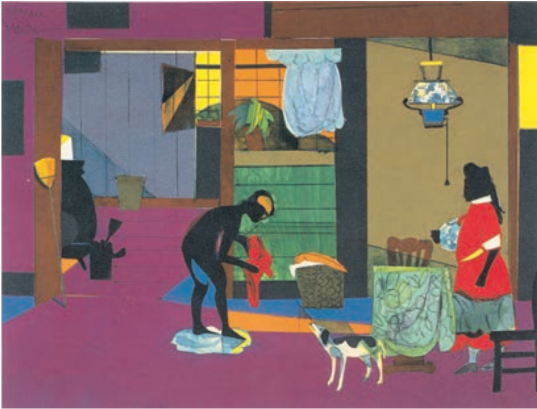
تصویر ۱۴-۳- اثر ژمار بردن ۱ ، کلاژ و ترکیب مواد، (۱/۴۵×۳۴/۹ سانتی متر)