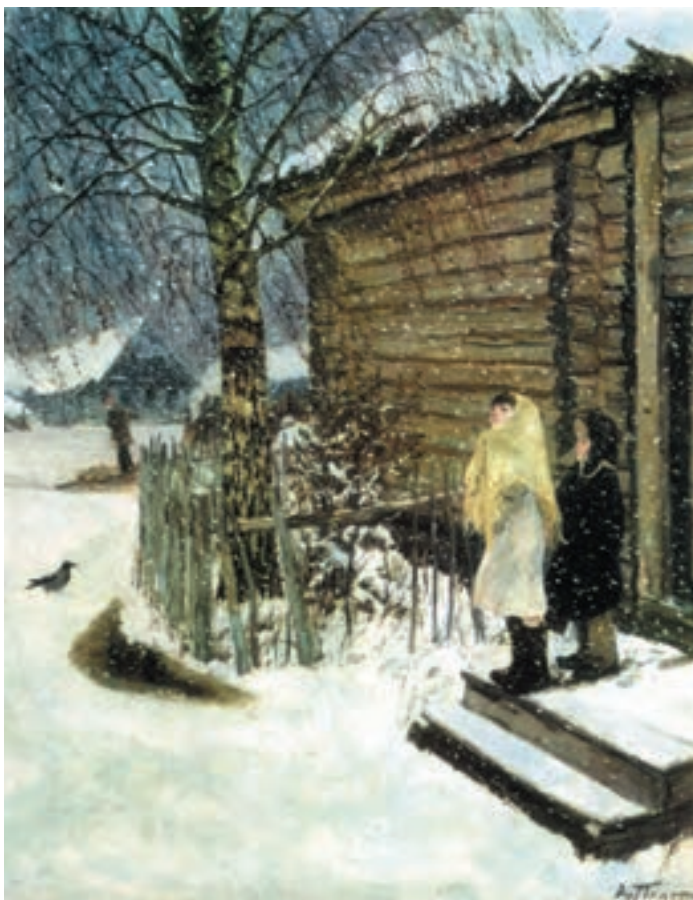
تصویر ۲۳-۳- اثر آرکادی پلاستف، رنگ روغن روی بوم، (۱۱۳×۱۴۶ سانتی متر)

تصویر (۲۳-۳) اثر پلاستف، یک روز برفی را نشان می دهد. دو کودک با شیفتگی به تماشای بارش برف ایستاده اند. این اثر از دو رنگ مکمل زرد و بنفش به همراه خاکستریهای رنگی حاصل از ترکیب دو رنگ، نقاشی شده است. رنگ زرد در روسری دخترک و بنفش در آسمان دیده می شود. زرد، به خاطر شدت درخشش نسبت به بنفش، وسعت سطح کمتری دارد. بین زرد و بنفش رنگ کلبه قرار دارد که از ترکیب این دو رنگ ساخته شده است و عامل چرخش چشم بین این دو رنگ است.