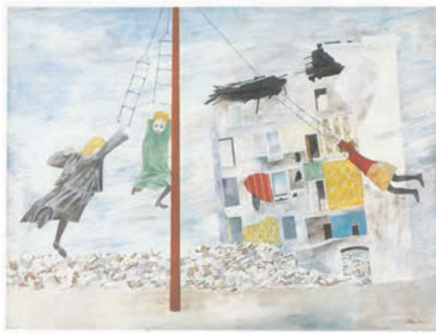
تصویر ۳۰-۳ اثر بن شان ۲ ، رنگ روغن روی بوم، (۷۵/۶×۱۰۱/۴ سانتی متر)