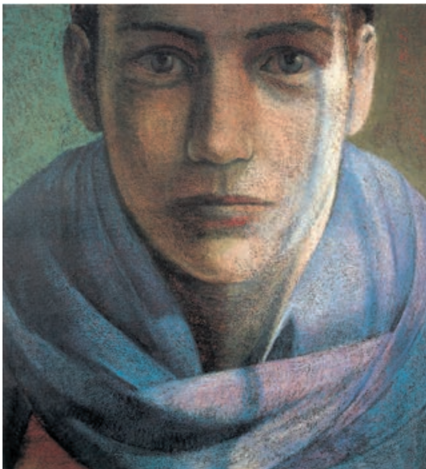
تصویر ۱۷-۳ اثر سوزان مور ۱ ، پاستل روغنی روی کاغذ، (۱۷۰/۲×۱۸۸ سانتی‌متر)