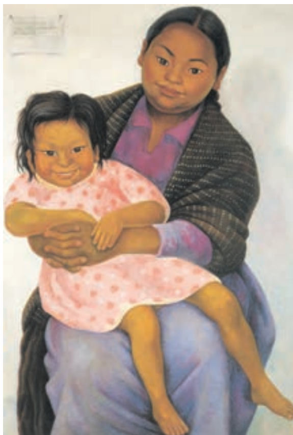
تصویر ۱۶-۳ اثر دیه‌گو ریورا، رنگ روغن روی بوم، (۱۰۴×۸۶ سانتی‌متر)