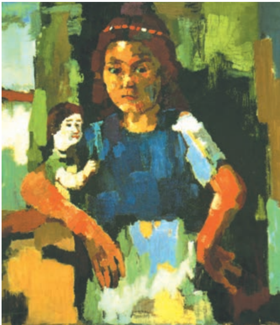
تصویر ۱۰-۳- اثر اُسکار کوکوشکا، رنگ روغن روی بوم

اُسکار کوکوشکا فقط به چهره نپرداخته، بلکه نیم تنه‌ای از یک دختر بچه با عروسکش را در کنار پنجره تصویر کرده است و نور را از سمت چپ به آن تابانده است، کوکوشکا نیز با وجود ساده کردن سطوح به کمک رنگ توانسته است حجم و فضایی را که دخترک ایستاده نشان دهد. گردش سبزه‌ها و همین‌طور رنگهای سفید، زرد، نارنجی و قهوه‌ای و سیاهها در تمام اثر، باعث احساس تعادل رنگی در چشم بیننده می‌شود.