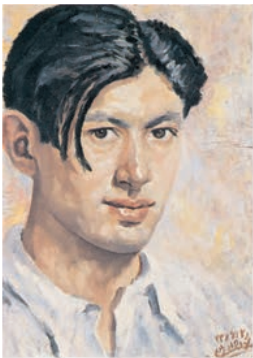
۳۰×۴۱ سانتی متر

در تصویر ۲۱-۳ چهار نقاشی از چهره هنرمند، اثر محمود جوادی پور استفاده از رنگهای گرم و سرد را در نورهای مختلف می بینیم. علی رغم این که ما محیط پیرامونی را نمی بینیم ولی بازتاب رنگهای اطراف به خوبی در چهره ها نمایان است.