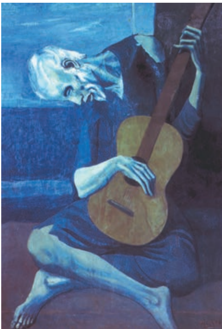
تصویر ۱۸-۳ – اثر پابلو پیکاسو، رنگ روغن روی بوم، (۱۲۱×۸۲/۵ سانتی‌متر)

تصویر (۱۸-۳)، به شما در انتخاب طرح و رنگ کمک می‌کند. این نقاشی، اثر پابلو پیکاسو ۱ نقاش کویست ۲ است و «گیتارزن پیر» نام دارد. او با خطوط منحنی و شکسته، پیکری را به‌طور فشرده در کادر قرار داده و برای آن، رنگهای سرد – آبی سبز بنفش را انتخاب کرده است. او توانسته است گیتار زن پیر را بسیار نحیف و فقیر و افسرده در فضای سرد و دل‌تنگ قرار دهد و فضای سردی بر اثر حاکم سازد.