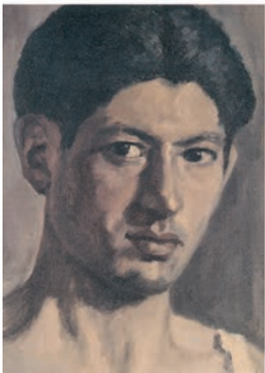
۲۷×۳۵ سانتی متر