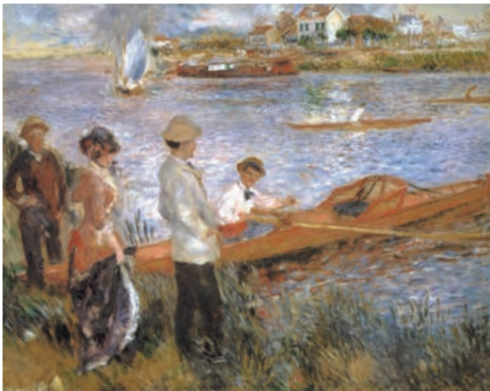
تصویر ۱۵-۳ اثر اگوست رنوار، رنگ روغن روی بوم