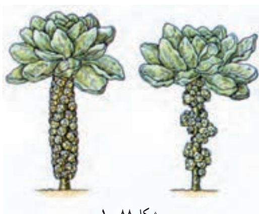
شکل ۸۸- ۱

— ارقام اصلاح شده کنونی دارای مزایای بسیاری نسبت به ارقام سنتی هستند که از آن جمله می‌توان به مقاومت در برابر بیماری‌ها، سرما یا زودرسی یا دیررسی و یکنواختی اندازه دکمه‌ها، دکمه‌بندی یکنواخت در طول ساقه و غیره را نام برد (شکل ۸۸-۱).