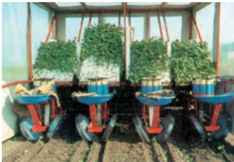
شکل ۹۴-۱- دستگاه نشاکار

– پس از نشاکاری، اطراف بوته‌ها را قدری سفت کنید. تذکر: نشاکاری را حتی المقدور در عصر و در صورت امکان در یک روز ابری انجام دهید (شکلهای ۹۴-۱ و ۹۵-۱ و ۹۶-۱).