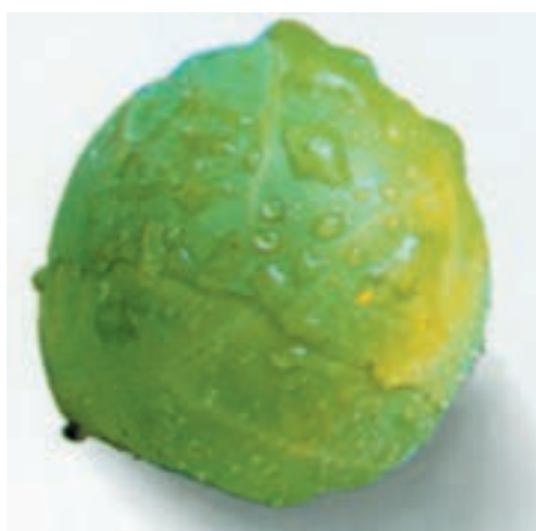
شکل ۸۷-۱- یک تکمه کلم را نشان می‌دهد.