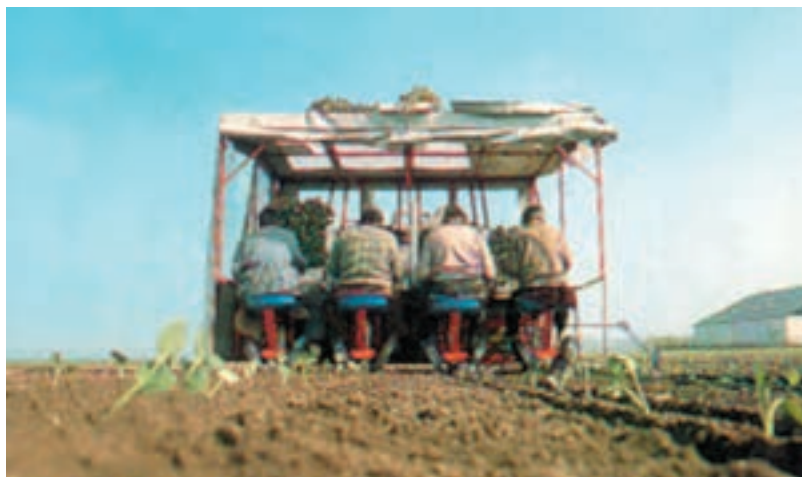
شکل ۹۵-۱- نشاکاری توسط ماشین را نشان می‌دهد.

واحد کار: تولید و پرورش کلم دکمه‌ای شماره شناسایی: ۱۱۳-۲۱۰۲۱۰۲۱۳۱