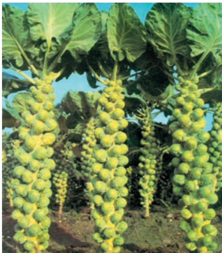
شکل ۸۶-۱- تکمه‌ها را روی گیاه کلم تکمه‌ای نشان می‌دهد.

- گیاهی از خانواده چلیپاییان ۱ و از جنس براسیکا ۲ و گونه براسیکا اولرسه ۳ آ و از واریته ژمنیفر ۴ است (شکلهای ۸۶-۱ و ۸۷-۱).