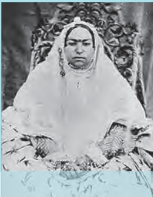
ملک نساء خانم عزت الدوله، خواهر ناصرالدین شاه و همسر امیر کبیر