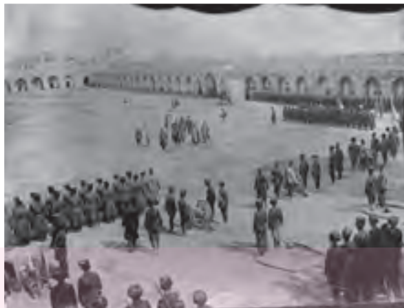
رژه واحدهای نظامی در میدان مشق - تهران

کارشناسان نظامی فرانسه و انگلستان، ارتش ایران را تجدید سازمان و مجهز به سلاح‌های مدرن کند، اما تلاش‌های او به دلیل پیمان‌شکنی دولت فرانسه، بدعهدی دولت انگلیس و موانع و مشکلات داخلی بی‌نتیجه ماند. در اوایل عصر ناصری، امیرکبیر، صدراعظم با کفایت ایران، با جدیت تمام برای تشکیل ارتش حرفه‌ای و دائم اقداماتی انجام داد. یکی از مقاصد او از تأسیس مدرسه دارالفنون، آموختن دانش نظامی جدید و اشاعه آن و نیز تقویت توان جنگی و دفاعی کشور بود. پس از امیرکبیر، این اقدام نوگرایانه او همچون سایر اقداماتش به فراموشی سپرده شد، تا اینکه ناصرالدین‌شاه امتیاز تأسیس یک واحد نظامی حرفه‌ای با عنوان بریگاد قزاق را به روسیه واگذار کرد. نیروی قزاق تشکیلات نظامی منسجم و منظمی بود که تا اواخر حکومت قاجار تحت فرماندهی افسران روسی فعالیت می‌کرد. نفرت این نیرو در اوج گسترش کمتر از ۱۰ هزار نفر بود و بیشتر به عنوان نیروی نگهبان شخص شاه و خاندان سلطنت و دفع‌کننده شورش‌ها و اعتراض‌های داخلی عمل می‌کرد و در حفظ مرزها و مقابله با هجوم خارجی کارایی چندانی نداشت.