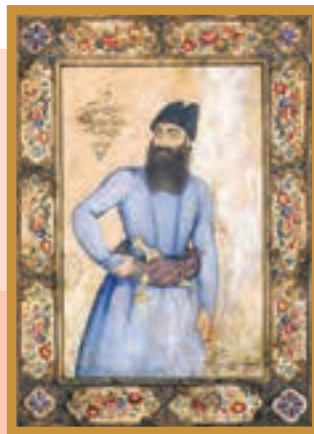
نگاره عباس میرزا (۱۲۰۳-۱۲۴۹ق) - اثر میرزا بابا نقاش