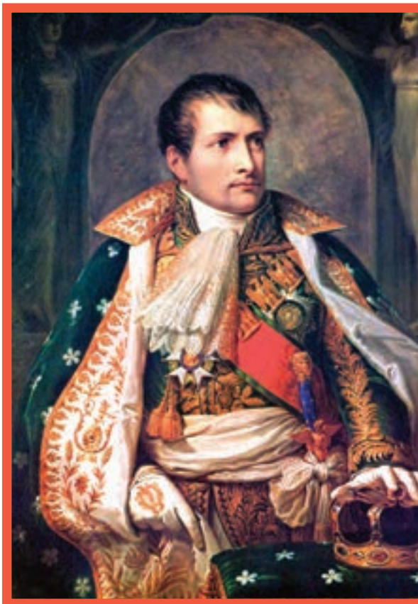
ناپلئون بناپارت، امپراتور فرانسه

هم‌زمان با روی کار آمدن قاجارها در ایران، ناپلئون بناپارت در فرانسه قدرت گرفت. ناپلئون که سیاست توسعه‌طلبانه‌ای را در اروپا و جهان دنبال می‌کرد، با مانع بزرگی همچون انگلستان روبه‌رو شد که به دلیل جزیره‌ای بودن و برخورداری از نیروی دریایی قدرتمند، توان رویارویی مستقیم با آن را نداشت. بنابراین، تصمیم گرفت رقیب خود را با هجوم به مستعمراتش از پای درآورد.