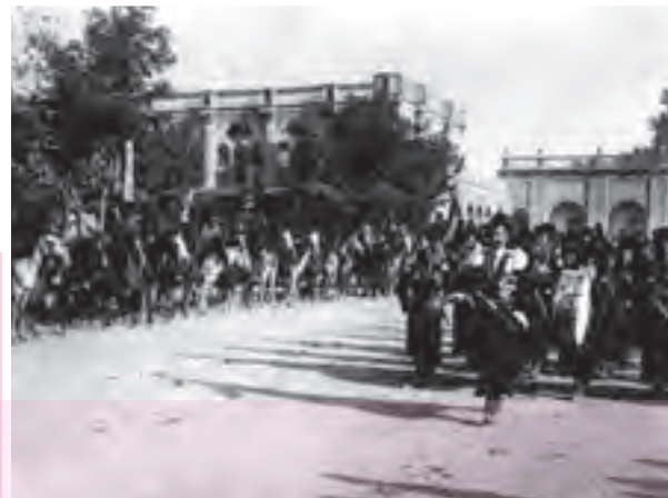
رژه نیروهای قزاق