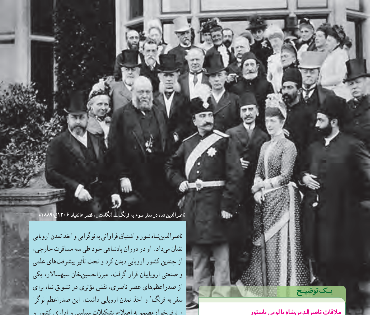
ناصرالدین شاه در سفر سوم به فرنگ - انگلستان، قصر هاتفیلد ۱۳۰۶ ق/ ۱۸۸۹ م

ناصرالدین شاه شور و اشتیاق فراوانی به نوگرایی و اخذ تمدن اروپایی نشان می‌داد. او در دوران پادشاهی خود طی سه مسافرت خارجی، از چندین کشور اروپایی دیدن کرد و تحت تأثیر پیشرفت‌های علمی و صنعتی اروپاییان قرار گرفت. میرزا حسین خان سپهسالار، یکی از صدراعظم‌های عصر ناصری، نقش مؤثری در تشویق شاه برای سفر به فرنگ ۱ و اخذ تمدن اروپایی داشت. این صدراعظم نوگرا و ترقی‌خواه مصمم به اصلاح تشکیلات سیاسی و اداری کشور و جلب سرمایه‌گذاری خارجی در ایران بود اما برنامه‌های او به سبب مخالفت‌های داخلی و تردیدهای شاه به جایی نرسید. ناصرالدین شاه اگرچه ضرورت نوگرایی و جبران عقب‌ماندگی کشور را درک کرده بود، از نتایج سیاسی آن، که کاهش قدرت و اختیارات نامحدود شاه بود، به شدت وحشت داشت. برای مثال، او مدرسه دارالفنون را نماد ترقی قلمداد می‌کرد و علاقه فراوانی به انتشار کتاب و روزنامه داشت اما در عین حال، از نشر اندیشه سیاسی جدید و ترویج افکار مشروطه‌طلبی و جمهوری‌خواهی در ایران سخت بیمناک بود. از این رو، اصلاحات عهد او به تغییر اساسی منجر نشد.