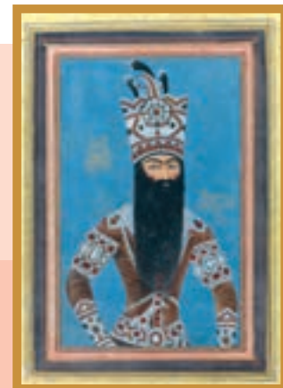
نگاره فتحعلی شاه (۱۱۸۶-۱۲۵۰ق) - اثر مهرعلی نقاش