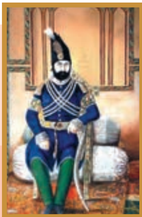
نگاره محمدشاه (۱۲۲۳-۱۲۶۴ق)

پس از مرگ آقامحمدخان، برادرزاده‌اش باباخان که به فتحعلی شاه معروف شد، زمام امور را به دست گرفت. سال‌های نخست سلطنت فتحعلی شاه به سرکوب شورش‌های داخلی و تحکیم پادشاهی در خاندان قاجار گذشت. در دوران سلطنت نسبتاً طولانی او، حکومت قاجار از یک سو با تهاجم نظامی گسترده روسیه و از سوی دیگر با رقابت دولت‌های انگلستان و فرانسه برای نفوذ سیاسی و اقتصادی در ایران مواجه بود. فتحعلی شاه در حفظ یکپارچگی کشور و سامان دادن به اوضاع داخلی موفق بود اما در مقابله با تهاجم نظامی و نفوذ سیاسی کشورهای اروپایی ناکام ماند.