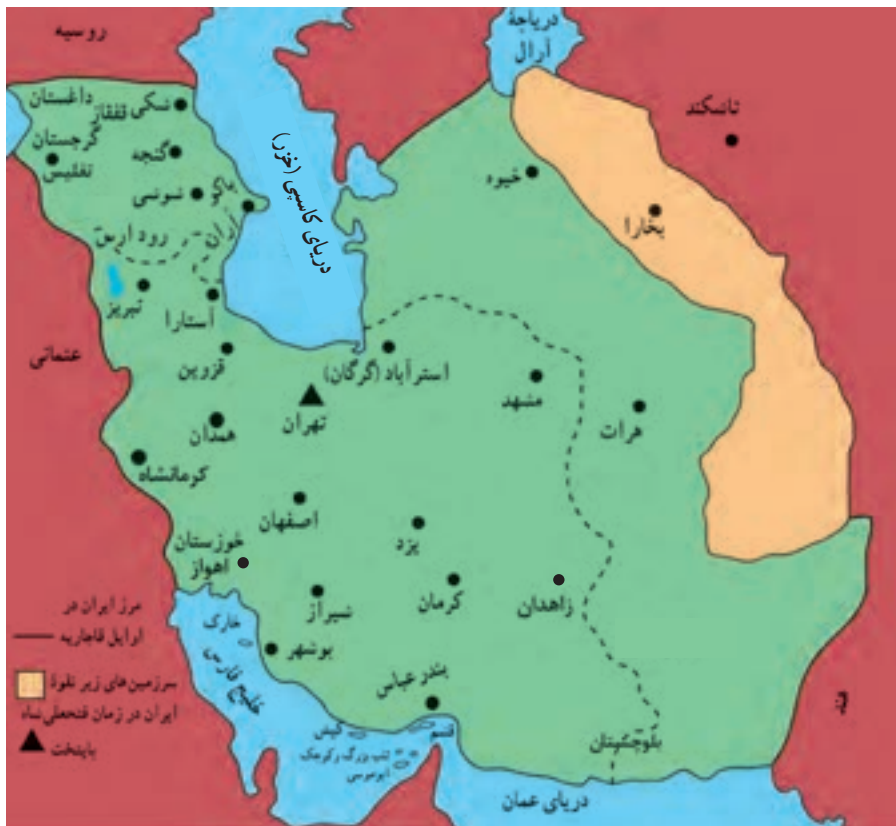
قلمرو حکومت قاجار در زمان فتحعلی شاه