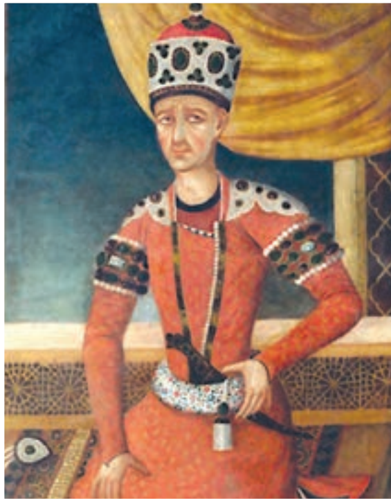
نگاره آقا محمدخان قاجار (۱۱۵۵-۱۲۱۱ق)

خود قرار داد، سپس با غلبه بر لطفعلی خان زند و سرکوب طغیان حاکم گرجستان، در سال ۱۲۱۰ق/۱۷۴۰ش در تهران تاج گذاری کرد.