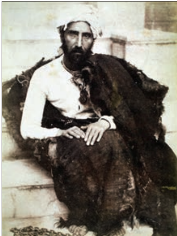
میرزا رضا کرمانی (۱۲۲۶-۱۲۷۵ ش)

با راهنمایی دبیر، بخشی از سفرنامه‌های ناصرالدین‌شاه به فرنگستان را انتخاب و گزارشی از خاطرات و بازدیدهای او در یک صفحه تهیه کنید.