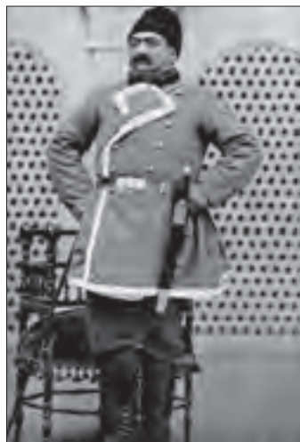
مسعود میرزا ظل السلطان (۱۲۲۸-۱۲۹۷ش)، پسر ناصرالدین شاه ۳۴ سال متوالی حاکم اصفهان و حدود ۴۵ سال متناوب حاکم مازندران، اصفهان و فارس بود.

والیان و حاکمان ایالات و ولایات، شهرها و روستاها عمدتاً از میان خاندان‌های زمین‌دار، اعیان یا بزرگان محلی، سران ایلات و عشایر و شاهزادگان قاجاری برگزیده می‌شدند. حاکمان ایالات و ولایات تا حدودی خودمختار بودند و بخش اعظم درآمد منطقه تحت فرمان خویش را برای خود نگه می‌داشتند. شاهان قاجار از طریق برقراری پیوند ازدواج با خاندان‌های زمین‌دار، بزرگان محلی و مقام‌های بلند پایهٔ حکومتی به دنبال گسترش نفوذ و استحکام سلطنت خود بودند. ادارهٔ ایالت آذربایجان با مرکزیت شهر تبریز، همواره