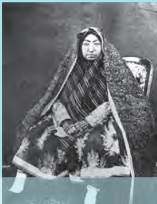
مهدعلیا (۱۲۲۰-۱۲۹۰ق)، مادر ناصرالدین شاه، از زنان بانفوذ دربار قاجار