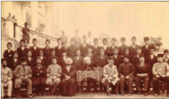
معلمان و استادان مدرسه علوم سیاسی - این مدرسه را میرزا نصرالله خان مشیرالدوله در زمان مظفرالدین شاه به منظور تربیت نیروهای سیاسی وزارت امور خارجه تأسیس کرد.

که به همت امیر کبیر و با هدف آموزش علوم و فنون جدید به دانشجویان ایرانی در داخل کشور، بنیان نهاده شد. دارالفنون در واقع نخستین مدرسه عالی بود که در رشته‌های نظامی، پزشکی، ریاضی و هندسه، فیزیک، شیمی و معدن فعالیت می‌کرد.