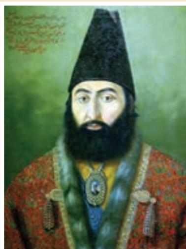
نگاره امیر کبیر اثر محمد ابراهیم نقاش باشی

به دنبال سقوط صفویان، هنر نگارگری نیز در سایه جنگ‌های داخلی رو به افول نهاد. نقاشی در عصر قاجاریه به دنبال وحدت سیاسی و استقرار امنیت و در سایه حمایت پادشاهان و دربار از یک سو و ارتباط با غرب از سوی دیگر، دچار تحولی اساسی شد. فتحعلی‌شاه برجسته‌ترین هنرمندان نقاش را در تهران گرد آورد و آنها را به کشیدن پرده‌های بزرگ برای نصب در کاخ‌ها تشویق کرد.