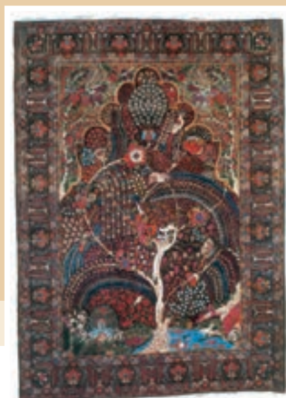
قالیچه کرمان – دوره قاجار