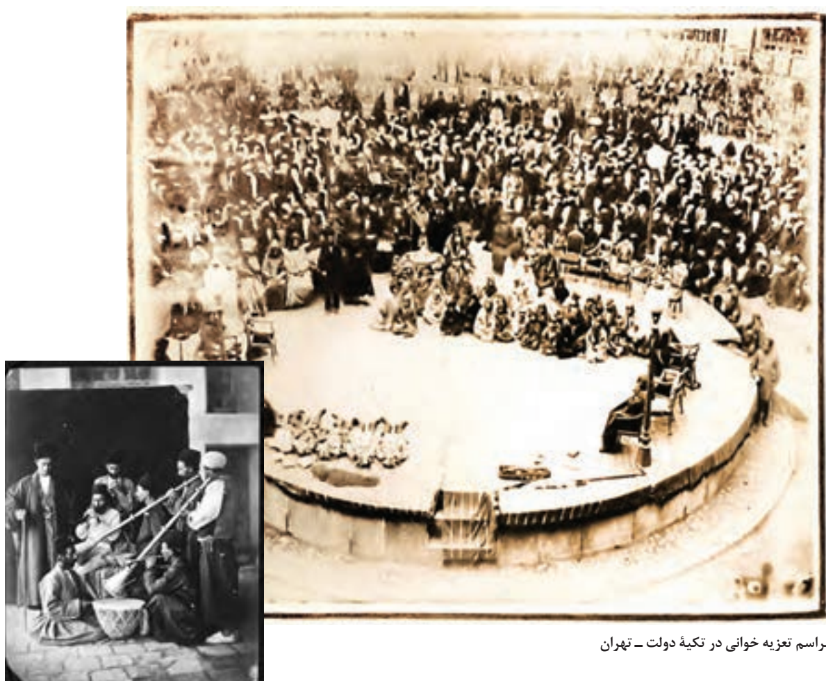
مراسم تعزیه خوانی در تکیه دولت - تهران

تعزیه که ریشه در آیین‌های باستانی داشت، در عصر صفوی برای بزرگداشت حماسه کربلا و شهادت امام حسین علیه السلام رواج یافت. هنر تعزیه در دوره ناصرالدین شاه گسترش پیدا کرد. یکی از مکان‌های اجرای تعزیه در تهران، تکیه دولت بود. زنان و مردان زیادی در این تکیه به تماشای تعزیه گردانان می‌نشستند.