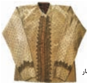
نمونه‌ای از لباس‌های دوره قاجار