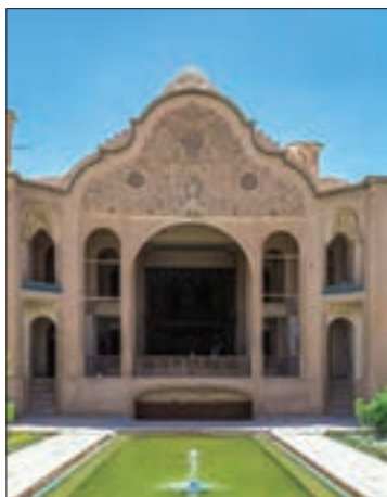
خانهٔ بروجردی‌ها - کاشان

سنت معماری ایرانی اسلامی که در دوران سلجوقی، تیموری و صفویان درخشش بی‌نظیری داشت، در عصر قاجار با توجه به شرایط اقلیمی و آب و هوایی و نوع مصالح ساختمانی تداوم یافت. پس از اختراع دوربین عکاسی، مسافرانی که در عصر ناصری به اروپا می‌رفتند، تصاویر زیادی از بناهای آن سرزمین با خود به ایران آوردند. بسیاری از معماران به سفارش دربار و ثروتمندان با استفاده از برخی از عناصر معماری فرنگی و تلفیق آن با معماری ایرانی، سبکی از معماری را به وجود آوردند که در آن عناصر و ویژگی‌های معماری ایرانی و اروپایی ترکیب شده بود. این بناها که به بناهای «کارت پستالی» معروف شد، بیشتر به تقلید از بناهای اروپایی ساخته می‌شدند. یکی از این بناهای معروف، کاخ شمس‌العماره واقع در مجموعهٔ کاخ گلستان است که به دستور ناصرالدین‌شاه ساخته