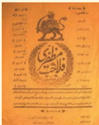
روزنامه فلاح مظفري

متن زیر را بخوانید و به پرسش‌های مربوط به آن پاسخ دهید.