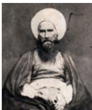
حاج ملاهادی سبزواری

در دوره قاجار تحولی چشمگیر در فلسفه اسلامی به وجود آمد. ملا عبدالله زنوزی مؤسس حوزه فلسفی تهران و شاگرد برجسته ملاعلی نوری، از فیلسوفان مشهور این دوره است. زنوزی دو اثر ارزشمند در موضوع فلسفه به زبان فارسی نوشت. نگارش آثار فلسفی به زبان فارسی در دوره صفویه به تدریج از رونق افتاده بود. حوزه فلسفی تهران را فیلسوفان برجسته دیگری گسترش دادند و موجب رشد و توسعه فلسفه اسلامی و شاخه‌های گوناگون آن مثل مکتب مشاء، حکمت اشراق و حکمت متعالیه صدرایی و عرفانی شدند.