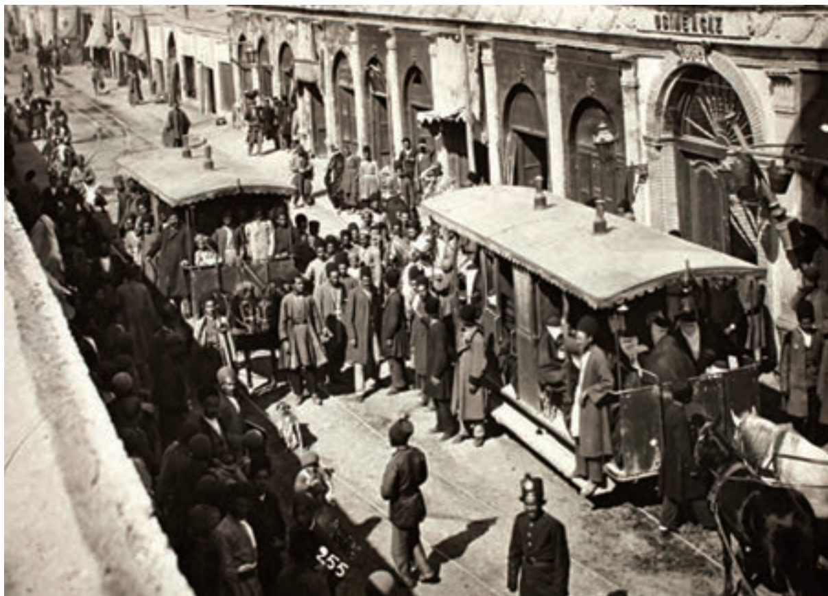
خیابان چراغ گاز (امیرکبیر کنونی) تهران - دوره قاجار

آشنایی با اوضاع اجتماعی، تحولات اقتصادی و جنبه‌های مختلف حیات علمی و فرهنگی ایران دوره قاجار نظیر هنر و معماری، از مباحث مهم و کلیدی در مطالعات تاریخی این دوره محسوب می‌شود. شما در این درس با استفاده از شواهد و مدارک تاریخی، برخی از وجوه زندگی اجتماعی، اقتصادی و فرهنگی عصر قاجار را بررسی و تحلیل خواهید کرد.