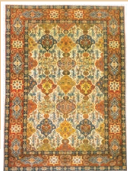
قالیچه بافته شده در آذربایجان – دوره قاجار