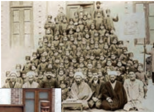
معلمان و دانش آموزان مدرسه رشديه تهران

به نظر شما چرا امیر کبیر دستور داد، استادان و معلمان مدرسه دارالفنون از کشورهایی غیر از روسیه و انگلستان (مانند فرانسه و اتریش) استخدام شوند؟