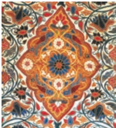
نمونه‌ای از پارچه‌های دوره قاجار

از لحاظ کیفیت و دوام در وضعیت مطلوبی بودند. با پایان یافتن جنگ در اروپا و سرازیر شدن سیل کالاهای اروپایی، صنایع دستی ایران به تدریج رو به انحطاط رفت. بسیاری از اروپاییان که در این زمان از ایران دیدن کرده‌اند، از نابودی و ضعف مراکز قدیمی و پررونق صنایع دستی ایران مثل کاشان، اصفهان، شیراز، کرمان و یزد خبر داده‌اند. کالاهای اروپایی، به ویژه محصولات صنعتی انگلستان، صدمه شدیدی به صنایع ایران وارد آورد. در دوره صدارت امیرکبیر تلاش‌های زیادی برای احیای صنایع دستی ایران صورت گرفت اما با مرگ او این تلاش‌ها پیگیری نشد.