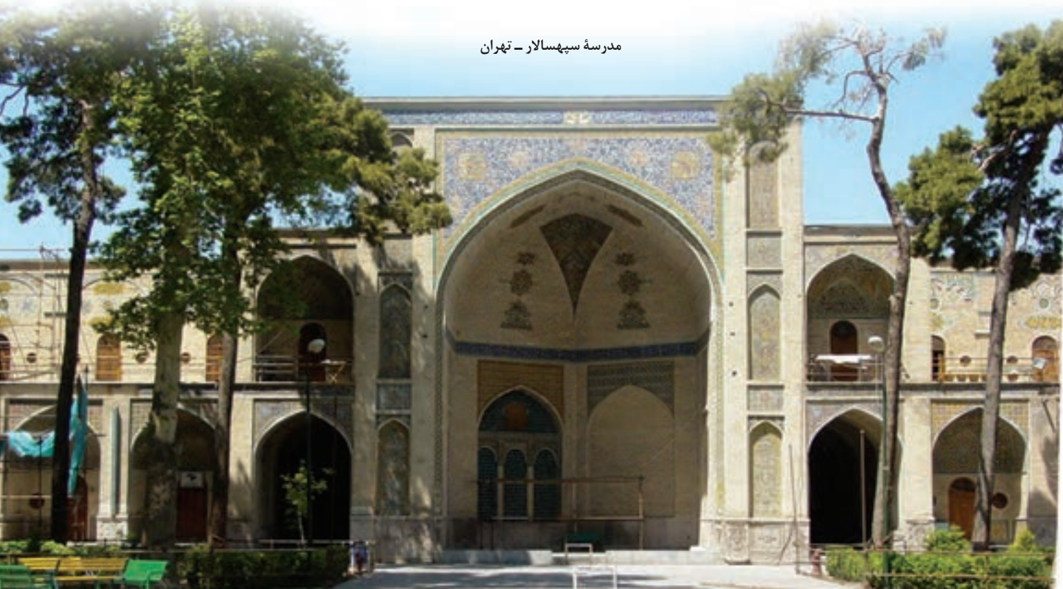
مدرسه سپهسالار – تهران

در دوره قاجار نیز نظام تعلیم و تربیت سنتی ایران تداوم و گسترش یافت. در آن زمان سوادآموزی مقدماتی در مکتب‌خانه‌ها یا از طریق معلمان خصوصی و یا معلمان سرخانه انجام می‌گرفت. دانش‌آموزانی که توانایی مالی و علاقه به ادامه تحصیل داشتند، وارد مدرسه‌های قدیم و حوزه‌های علمیه می‌شدند. در این مراکز آموزشی، علوم نقلی و عقلی تعلیم داده می‌شد. مدرسه‌های مروی و سپهسالار (مدرسه عالی شهید مطهری کنونی) از جمله مراکز علمی و آموزشی مهم و بزرگ این دوره بودند که در پایتخت تأسیس شدند. عالمان و اندیشمندان برجسته‌ای در این مراکز تحصیل و تدریس می‌کردند.