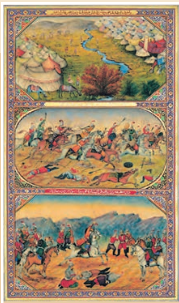
سه پرده از نقاشی‌های هزار و یک شب اثر ابوالحسن غفاری (صنیع‌الملک)، نقاش باشی ناصرالدین‌شاه