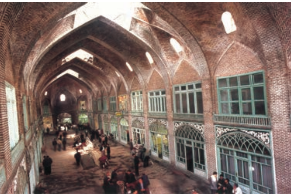
تیمچه مظفریه - تبریز

یکی از گروه‌های اجتماعی عصر قاجار، که در شهرها و روستاها زندگی می‌کردند، روحانیون بودند. آنان از دیرباز به دلیل بافت و ساختار مذهبی جامعه سنتی ایران در میان اقشار مختلف مردم نفوذ فراوانی داشتند و متکفل امور دینی بودند. روحانیون به سبب نظارت بر موقوفات و دریافت وجوهات شرعی از نظر مالی مستقل از حکومت بودند. معمولاً این قشر به دلیل عدم وابستگی به حکومت، در مقاطعی از تاریخ معاصر ایران در برابر قدرت‌های خارجی ایستادگی کردند و اقدامات شاهان و درباریان قاجار را به چالش کشیدند.