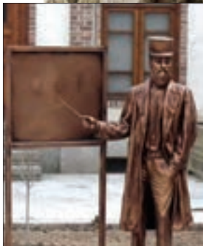
تندیس میرزا حسن رشديه

میرزا حسن رشديه یکی از شخصیت‌های فرهنگی عصر قاجار بود که برای تأسیس مدرسه‌های جدید به ویژه در دوره تحصیلی ابتدایی در شهرهای مختلف ایران بسیار تلاش کرد و در این راه رنج‌ها و سختی‌های فراوانی کشید. هدف رشديه از برپایی مراکز آموزشی جدید، فراهم آوردن شرایط برای سوادآموزی به فرزندان تمام قشرهای مختلف جامعه بود. در دوره قاجار، برخی از زنان فاضل نیز در تأسیس مدارس جدید مشارکت داشتند. از جمله این زنان می‌توان به بی بی خانم استرآبادی اشاره کرد که مدرسه دوشیزگان را به منظور تحصیل دختران در تهران تأسیس کرد (۱۲۸۵ ش).