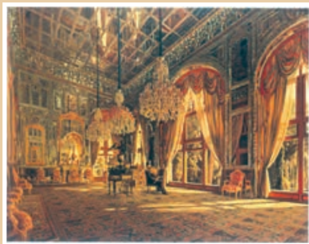
تابلوی تالار آینه اثر کمال‌الملک، نقاش عصر قاجار و پهلوی