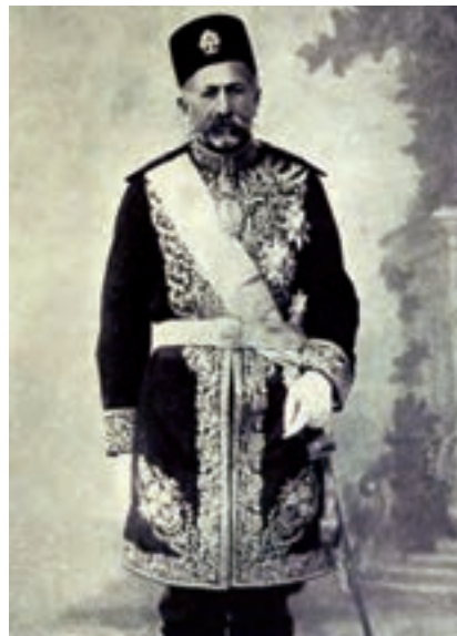
محمد ولی خان تنکابنی (۱۲۲۵-۱۳۰۵ ش)