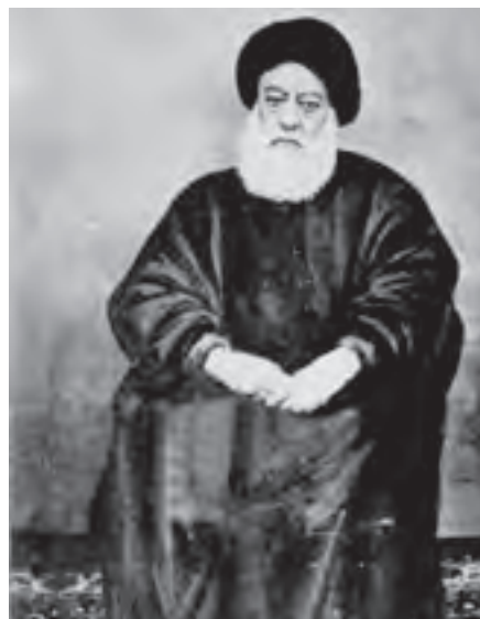
آیت الله سید محمد طباطبایی (۱۲۲۱ - ۱۲۹۹ ش)

و میرزا حسین خلیلی تهرانی) نیز به دفاع از انقلاب و نظام مشروطه برخاستند. هواداران مشروطه هم آثار متعددی در تأیید و وجوب مشروطه و رد دیدگاه مخالفان نوشتند که یکی از شاخص ترین آنها نوشته آیت الله میرزای نائینی است.