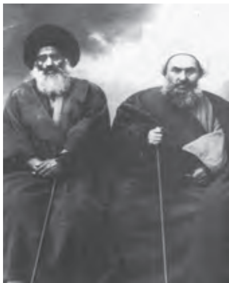
آیت الله شیخ فضل الله نوری و آیت الله سید عبدالله بهبهانی

پس از جبهه گیری شیخ فضل الله نوری در مقابل مشروطه، دو جریان فکری - سیاسی قدرتمند در برابر هم صف آرای کردند. در یک سو شیخ فضل الله نوری و شمار زیادی از روحانیان و طلاب از تهران و سایر شهرهای ایران و عتبات عالیات قرار داشتند که با مشروطه به مخالفت برخاسته بودند. آیت الله سید کاظم طباطبایی یزدی از مراجع ساکن نجف نیز از جمله این مخالفان بود. اعضای این جریان فکری، علاوه بر بست نشینی و برپایی گردهمایی های اعتراضی، کتاب ها و رساله های متعددی در نقد و