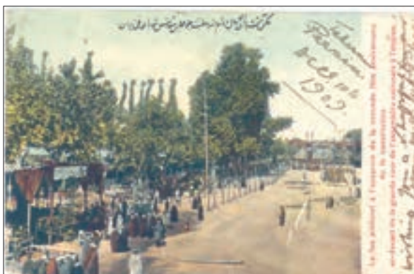
جشن‌های سالگشت پیروزی انقلاب مشروطه