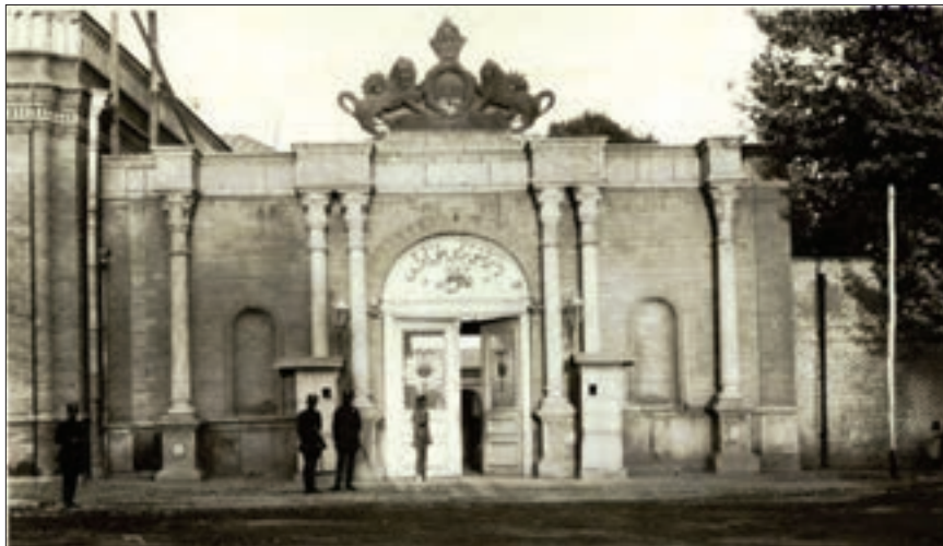
ساختمان مجلس شورای ملی در میدان بهارستان - تهران

انقلاب مشروطه، جنبش سیاسی و اجتماعی گسترده و قدرتمندی بود که در زمان مظفرالدین شاه به وقوع پیوست. آرمان و هدف انقلاب مشروطه این بود که آزادی و برابری را در کشور برقرار سازد و با تدوین و اجرای قانون اساسی و برپایی مجلس شورای ملی، حکومت مستبد، ناکارآمد و ناسالم قاجار را به حکومتی قانونمند و کارآمد تبدیل کند. در واقع، ایرانیان با این انقلاب برای نخستین بار، خواهان تغییر شیوه اداره کشور شدند و در صدد برآمدند که حکومت خودکامه قاجار را به سلطنتی مشروطه، در چارچوب قانون و تحت نظارت نمایندگان خود در مجلس شورای ملی در آورند.