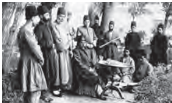
مظفرالدین‌شاه به همراه جمعی از درباریان و ملازمان

در چنین شرایطی بود که منتقدان و مخالفان، فرصت و جرئت یافتند که حکومت قاجار و عملکرد مقام‌های آن را بیش از گذشته