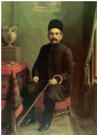
نگاره سردار اسعد بختياری (۱۲۳۶-۱۲۹۶ ش) اثر کمال الملک

یکی از زمین‌داران بزرگ به نام محمد ولی خان تنکابنی (سپهدار)، قدرت را به دست گرفتند و آماده حرکت به سوی تهران شدند. در مرکز ایران نیز بختیاری‌ها به انقلابیون گرایش یافتند. علیقلی خان سردار اسعد، برادرش صمصام السلطنه، ایل خان بختیاری را به هواداری از مجلس و مشروطه فراخواند. جنگاوران ایل بزرگ بختیاری پس از تصرف اصفهان به قصد تسخیر پایتخت به حرکت درآمدند. سرانجام نیروهای بختیاری به فرماندهی سردار اسعد و مجاهدان گیلانی با هدایت محمدولی خان تنکابنی و بیرم خان ارمنی در عملیاتی هماهنگ تهران را فتح کردند. با پناهندگی محمدعلی شاه به سفارت روسیه، دوره استبداد صغیر به سر آمد (تیر ۱۲۸۸).