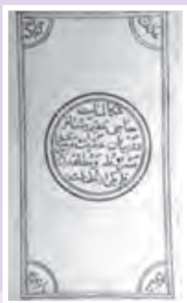
رساله مقیم و مسافر اثر حاج آفانورالله نجفی اصفهانی در دفاع از مشروطه