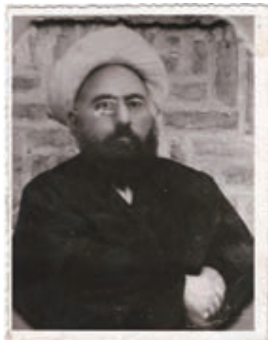
شهید ثقة الاسلام تبریزی

با وجود اینکه دولت ایران اولتیماتوم روسیه را برای برکناری شوستر پذیرفت، نظامیان روس مناطقی از ایران را اشغال کردند و مرتکب جنایت‌های هولناکی شدند. آنان در تبریز عده‌ای از آزادی‌خواهان، از جمله ثقة الاسلام تبریزی، روحانی آزادیخواه را به دار آویختند و به شهادت رساندند. در مشهد نیز سربازان متجاوز روس حرم امام رضا علیه السلام را به توپ بستند و تعدادی از زائران را شهید کردند.