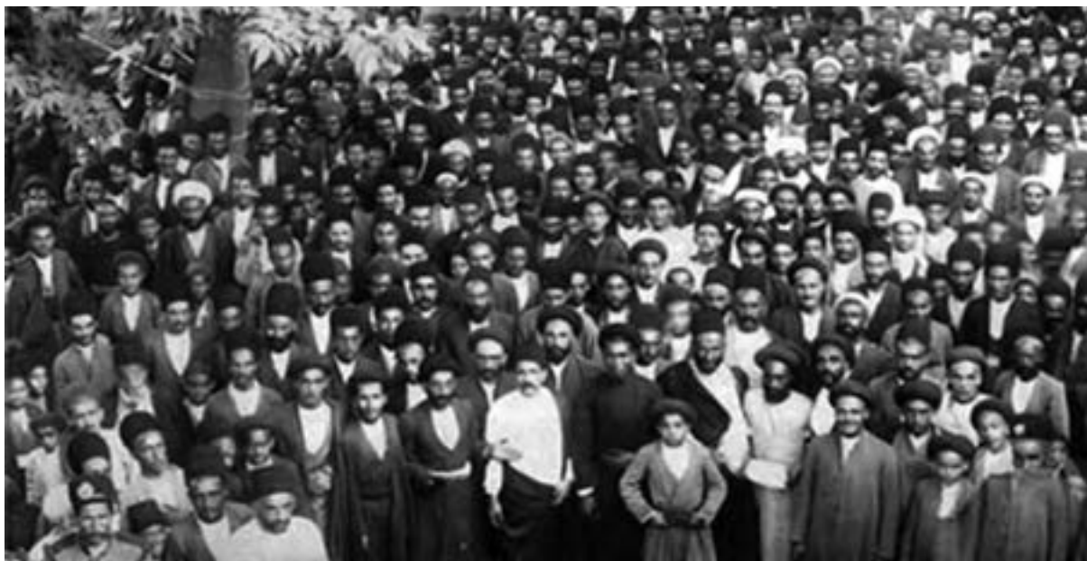
بست‌نشینان مشروطه خواه - سفارتخانه انگلستان - تهران

الف) چند مورد از ویژگی‌های مشترک رویدادهایی را که منجر به انقلاب مشروطه شد، استخراج و فهرست کنید. ب) در خواسته‌های معترضان، از مهاجرت صغرا تا مهاجرت کبرا چه تغییر و تحولی صورت گرفت؟