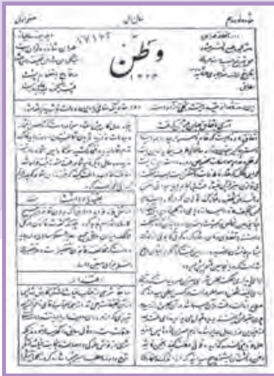
صفحه اول روزنامه وطن

برخی از روزنامه‌نگاران از نقد اشخاص و نهادها فراتر رفتند و به تخریب، توهین و ناسزاگویی روی آوردند. این تندروی‌ها بر روند رویدادها و تحولات بعدی انقلاب مشروطه و تشدید اختلاف‌ها و دشمنی‌های داخلی تأثیر چشمگیری داشت.