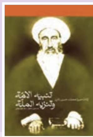
کتاب تنبيه الامه و تنزيه المله نوشته میرزای نائینی