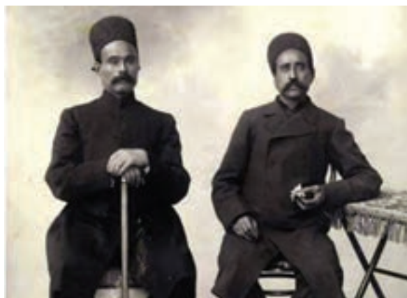
ستارخان و باقرخان

پس از کودتای محمدعلی شاه علیه مجلس، شهر تبریز با هدایت انجمن ایالتی و پایداری مجاهدان مشروطه خواه آذربایجانی، پایگاه آزادی خواهی و مقاومت در برابر استبداد و مستبدان شد. در رأس این مجاهدان ستارخان و باقرخان قرار داشتند. نیروهای مستبد محلی با پشتیبانی واحدهای نظامی که از تهران به تبریز اعزام شده بود، شهر را محاصره کردند و نبرد سختی در گرفت. احمد کسروی،