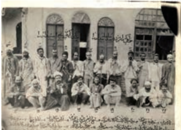
جمعی از مشروطه‌خواهان که پس از به توپ بستن مجلس در باغ شاه غل و زنجیر شدند.

واقعاً، تعدادی از مشروطه‌خواهان از جمله آیت‌الله سیدمحمد طباطبایی و آیت‌الله سیدعبدالله بهبهانی تبعید شدند و گروهی نیز به سفارتخانه‌های کشورهای خارجی پناه بردند (تیر ۱۲۸۷). چند تن از مشروطه‌خواهان پرشور مانند میرزا جهانگیرخان صوراسرافیل، حاجی میرزا نصرالله ملک‌المکلمین و