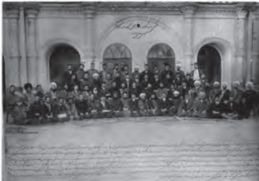
نمایندگان نخستین دوره مجلس شورای ملی

به طرز کار مجلس شورای ملی مربوط می شد. به همین سبب، مئتمنی برای آن تدوین شد که مشتمل بر اصول اساسی درباره حقوق و تکالیف متقابل دولت و ملت بود و محمدعلی شاه با اکره و به ناگزیر، آن را تأیید کرد. عمده اصول این قانون، از اصول قانون اساسی کشورهای فرانسه و بلژیک اقتباس شده بود. قانون اساسی مشروطه و مئتمن آن با اصلاحیه‌هایی جزئی که در دوران حکومت پهلوی در آن صورت گرفت، تا پیروزی انقلاب اسلامی (۱۳۵۷ش) رسمیت داشت.