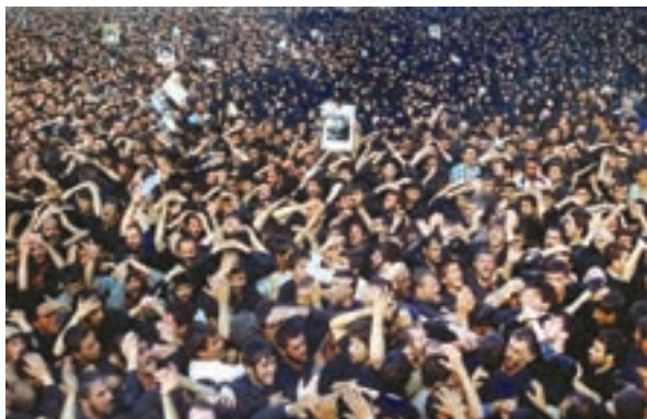
نمایی از تشییع جنازهٔ میلیونی امام خمینی علیه السلام