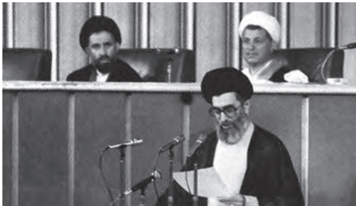
حضرت آیت الله خامنه‌ای هنگام خواندن وصیت‌نامهٔ حضرت امام در مجلس خبرگان - ۱۴ خرداد ۱۳۶۸

مجلس خبرگان رهبری تشکیل جلسه داد و با اکثریت قریب به اتفاق آرا، حضرت آیت الله سید علی خامنه‌ای را به دلیل داشتن شرایط و ویژگی‌های مندرج در اصل یکصد و نهم قانون اساسی ۱ به مقام رهبری برگزید (۱۴ خرداد ۱۳۶۸).