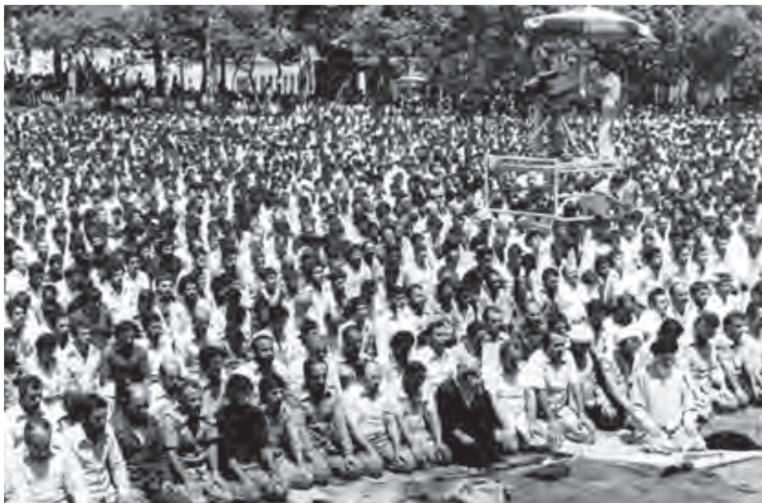
اقامه نخستین نماز جمعه تهران به امامت آیت‌الله طالقانی در دانشگاه تهران

در بُعد آیینی و مناسکی نیز اولین نماز جمعه به امامت آیت‌الله طالقانی (۵ مرداد ۱۳۵۸) در تهران و سپس به تدریج در سایر شهرستان‌ها اقامه گردید.