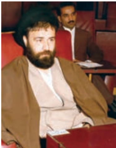
حاج سید احمد آقا خمینی

حجت‌الاسلام سید احمد خمینی در ۲۴ اسفند ۱۳۲۴ در قم به دنیا آمد. تحصیلات دوره ابتدایی و متوسطه را در زادگاهش گذرانید و از دبیرستان حکیم نظامی قم در رشته طبیعی (علوم تجربی) دیپلم گرفت. هم‌زمان با تحصیل در دبیرستان، ورزش فوتبال را نیز با جدیت دنبال کرد. ایشان پس از اخذ دیپلم، تحصیلات حوزوی را پی گرفت. قیام ۱۵ خرداد ۱۳۴۲، علاقه‌اش به سیاست و عزمش را به مبارزه با حکومت پهلوی بیش از گذشته آشکار ساخت. حاج سید احمد آقا از سال ۱۳۴۳ و به دنبال دستگیری و تبعید رهبر نهضت اسلامی، امام خمینی، و برادر بزرگش، حاج آقا مصطفی خمینی، به ترکیه و سپس عراق، مسئولیت‌های سنگینی را در خانواده حضرت امام و نیز در عرصه مبارزه با حکومت ستم‌شاهی بر عهده گرفت. به همین دلیل ساواک فعالیت‌هایش را زیر نظر گرفته بود. با این حال، او با تیزی و درایت دستورات امام را انجام می‌داد.