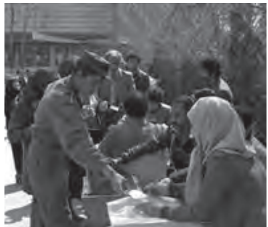
همه‌پرسی جمهوری اسلامی - ۱۰ و ۱۱ فروردین ۱۳۵۸