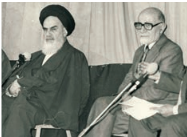
مهندس مهدی بازرگان، رئیس دولت موقت انقلاب، در کنار امام خمینی ره

این همه‌پرسی روزهای ۱ و ۱۱ فروردین ۱۳۵۸ برگزار شد و نتیجه آن که در ۱۲ فروردین اعلام شد، نشان داد که بیش از ۹۸ درصد شرکت‌کنندگان به جمهوری اسلامی رأی مثبت داده‌اند. به همین دلیل، ۱۲ فروردین در تقویم به عنوان روز جمهوری اسلامی نام‌گذاری شده است.