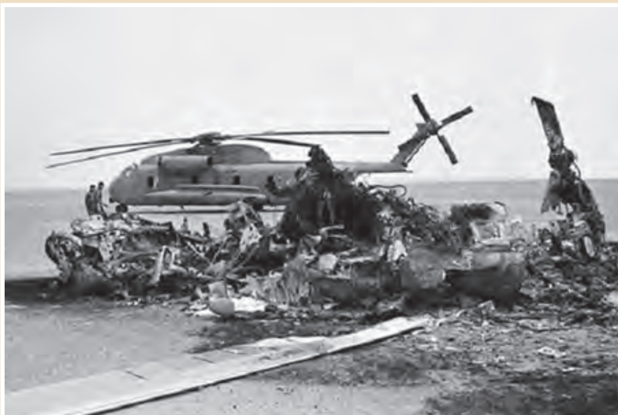
بقایای لاشهٔ هواپیماها و بالگردهای آمریکایی در طبس