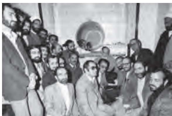
اعضای هیئت دولت شهید محمدعلی رجایی در دیدار با حضرت امام خمینی

پس از شروع به کار مجلس شورای اسلامی، ابتدا محمدعلی رجایی به عنوان نخست‌وزیر معرفی گردید و سپس وزرای معرفی شده توسط او از مجلس شورای اسلامی رأی اعتماد گرفتند؛ دولت دائم بر سر کار آمد و مدیریت امور کشور را از شورای انقلاب تحویل گرفت.