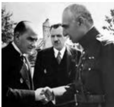
رضاشاه و آتاتورک

رضاشاه که تصور می‌کرد مهم‌ترین راه پیشرفت و توسعه کشور تقلید از غرب و اشاعه فرهنگ غربی است، پس از مسافرت به ترکیه و آشنایی با آتاتورک، رئیس‌جمهور آن کشور، به تقلید از او به مبارزه با همه سنت‌های اسلامی پرداخت. او در این راه حتی مأموران مخصوص در کوچه و خیابان شهر گماشت که وظیفه داشتند به زور چادر را از سر زنان بکشند. رضاشاه برای تضعیف روحانیت، دستور داد که روحانیون نیز لباس‌های مخصوص خود را کنار بگذارند. به دستور وی، دفترخانه‌های شرعی تعطیل شدند و دخالت روحانیون در مسائل اجتماعی اکیداً ممنوع اعلام شد. عزاداری سیدالشهدا قدغن شد و از انجام پذیرفتن بسیاری از آداب مذهبی به شدت جلوگیری به عمل آمد.