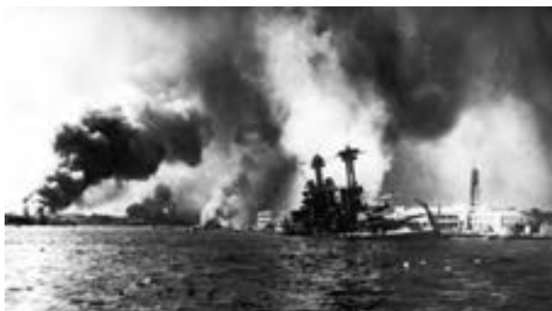
حمله هوایی ژاپن به ناوگان دریایی آمریکا در پل هاربر

همگام با تاخت و تازهای ارتش‌های آلمان و ایتالیا در اروپا و شمال آفریقا، نیروهای ژاپن که یکی دیگر از کشورهای عضو محور بود، جسورانه به ناوگان ایالات متحده آمریکا در پل هاربر ۱ واقع در اقیانوس آرام نیز یورش بردند و ضربه سختی به آن زدند. آمریکا که تا آن زمان به طور رسمی در جنگ بی‌طرف بود اما در عین حال، به انگلستان و فرانسه کمک‌های مالی، تدارکاتی و تجهیزاتی می‌کرد پس از حمله ژاپنی‌ها به ناوگانش، این کشور به نفع متفقین وارد جنگ شد. با ورود آمریکا به جنگ، جبهه قدرتمندی در برابر