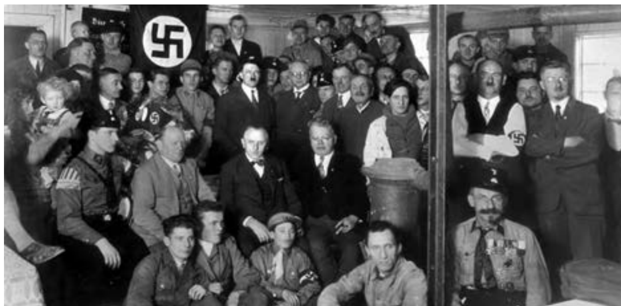
هیتلر و اعضای حزب نازی - دسامبر ۱۹۳۰

در بُعد روابط خارجی، نازی‌ها به رهبری هیتلر علاوه بر بستن پیمان‌های دو و چندجانبه با برخی کشورها، برنامه‌های توسعه طلبانه سرحدی و سرزمینی خود را به پیش بردند. هیتلر عقیده داشت که آلمان برای به دست آوردن فضای حیاتی، باید سرزمین‌هایی را در اروپا فتح کند.