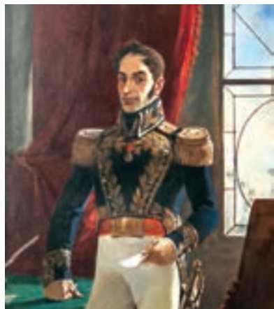
سیمون بولیوار (۱۷۸۳-۱۸۳۰م)

مقاومت در برابر استعمار؛ مردم بسیاری از مستعمره‌ها در قرن ۱۹ و نیمه اول قرن ۲۰ در برابر ورود استعمارگران به سرزمینشان مقاومت کردند یا علیه سلطه آنان جنبش‌های اعتراضی به راه انداختند. قیام مهدیون در سودان به رهبری مهدی سودانی در مقابل انگلیس، مبارزات