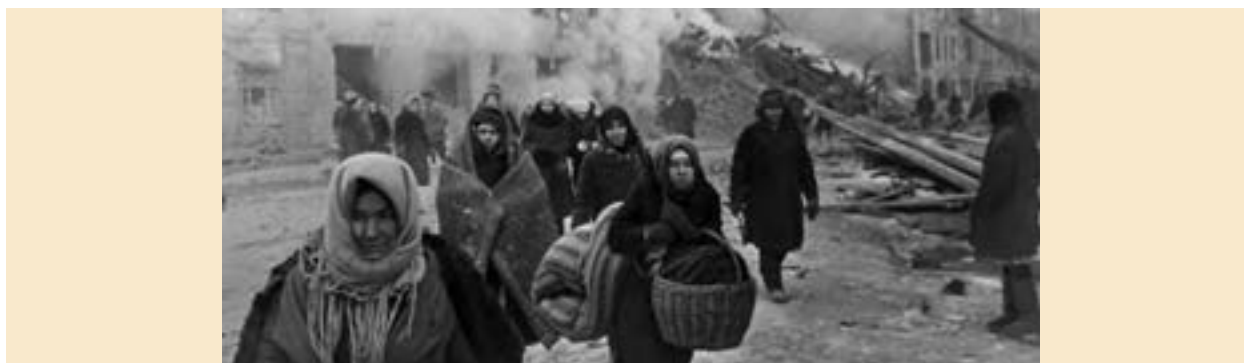
مردم لنینگراد هنگام ترک خانه و کاشانه خود در جنگ جهانی دوم

جنگ جهانی دوم مهلک‌ترین و مخرب‌ترین رویداد در تاریخ بشر است که طی آن حدود ۴۰ تا ۵۰ میلیون نفر انسان بر اثر این جنگ کشته شدند. گرسنگی، بیماری‌های مسری، آوارگی و اختلال‌های روحی و روانی نیز از دیگر مصیبت‌های ناشی از جنگ بود که بسیاری از مردم جهان را به شدت آزار داد.