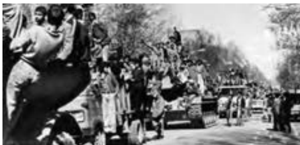
تهران - ۲۲ بهمن ۱۳۵۷

با حمله نیروهای گارد شاهنشاهی به افراد نیروی هوایی که به انقلاب پیوسته بودند (۲۰ بهمن)، تهران به شهری نظامی مبدل شد. حکومت پهلوی قصد داشت در بعد از ظهر ۲۱ بهمن و شب ۲۲ بهمن حکومت نظامی برقرار کند؛ سپس، به کمک نظامیان وابسته به خود و با نظارت ژنرال