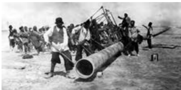
کارگران شرکت نفت هنگام احداث خط لوله نفت در خوزستان

در زمان مظفرالدین‌شاه، امتیاز کشف و استخراج نفت و گاز در سرتاسر ایران به مدت ۶۰ سال به یک سرمایه‌دار انگلیسی به نام ویلیام ناکس دارسی ۱ واگذار شد (۱۲۸۰ش/۱۹۰۱م). در مقابل، او تعهد کرد که ۲۰ هزار لیتر نقد، ۲۰ هزار لیتر به شکل سهام و ۱۶ درصد سود خالص سالانه به دولت ایران پرداخت کند. فعالیت‌های انگلیسی‌ها برای یافتن منابع نفت در مناطق مختلف ایران، با فوران نخستین حلقه چاه نفت در منطقه مسجد سلیمان به نتیجه رسید (۱۲۸۷ش/۱۹۰۸م). پس از آن، شرکت جدیدی به نام «شرکت نفت پارس و انگلیس» ۲ تشکیل شد. این شرکت چاه‌های زیادی در منطقه مسجد سلیمان حفر کرد و خط لوله‌ای هم از آنجا تا آبادان کشید. دولت انگلستان پس از آنکه از ارزش منابع عظیم نفت ایران و اهمیت آن برای نیروی دریایی خود آگاه شد، ۵۱ درصد سهام شرکت نفت پارس و انگلیس را خریداری کرد و حق نظارت کامل بر آن شرکت را به‌دست آورد (۱۹۱۴م). بدین گونه این شرکت به بازوی پر قدرت اقتصادی و سیاسی دولت انگلیس تبدیل شد و زمینه اعمال نفوذ و مداخله بیشتر انگلیسی‌ها را در ایران فراهم آورد. پس از انقلاب مشروطه، همواره میان دولت ایران و انگلیس اختلافات دامن‌داری درباره نحوه عملکرد شرکت نفت ایران و