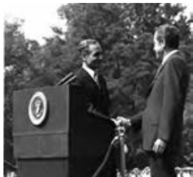
محمدرضا شاه پهلوی هنگام ملاقات با نیکسون، رئیس‌جمهور آمریکا

در زمینه فرهنگی نیز رژیم پهلوی کوشید، میان فرهنگ ایرانی و فرهنگ اسلامی تقابلی مصنوعی ایجاد کند. پیرو همین سیاست و به بهانه ناهمخوانی تاریخ هجری شمسی با فرهنگ ایرانی، تاریخ شاهنشاهی را جایگزین تقویم هجری شمسی کرد.