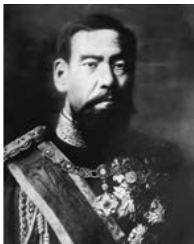
موتسو هیتو (Mutsuhito)، امپراتور ژاپن (۱۸۶۸-۱۹۱۲م) در دوران انقلاب میجی

ژاپن در اثر تحولات سیاسی و اقتصادی و فرهنگی قرن ۱۹م، در ابتدای سده ۲۰م به کشوری نیرومند تبدیل شده و سیاست خارجی تهاجمی در پیش گرفته بود. پیروزی این کشور بر امپراتوری قدرتمند روسیه (جنگ ۱۹۰۴-۱۹۰۵م)، انگیزه و جسارت ژاپنی‌ها را برای حمله به دیگر کشورها تقویت کرد.