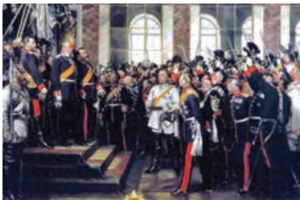
نگارهٔ مراسم تاج‌گذاری ویلهلم اول در کاخ ورسای پاریس پس از شکست فرانسه

پیمان‌ها توازن قدرت جدیدی در اروپا به وجود آورد. با این حال، تشدید رقابت و دشمنی میان دو طرف سرانجام به جنگ جهانی اول انجامید. مهم‌ترین علل بروز این جنگ، اختلافات مرزی و دشمنی شدید آلمان و فرانسه، مسابقهٔ تسلیحاتی، رقابت بر سر مستعمرات و اقدام برای توسعهٔ نفوذ و دخالت در منطقهٔ شبه‌جزیرهٔ بالکان بود.