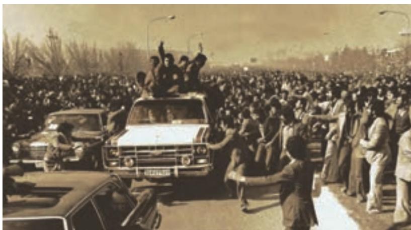
استقبال باشکوه از امام خمینی هنگام ورود به میهن در ۱۲ بهمن ۱۳۵۷

شاپور بختیار را، که قبلاً عضو جبهه ملی و از مخالفان رژیم بود، نخست‌وزیر خود کرد. امام خمینی در ۲۳ دی با ارسال پیامی تشکیل شورای انقلاب را به اطلاع مردم رساندند. این شورا که از افراد شایسته، مسلمان، متعهد و مورد اعتماد ایشان تشکیل شده بود، وظیفه داشت زمینه انتقال قدرت را فراهم کند. ده روز پس از تشکیل دولت بختیار، در ۲۶ دی، شاه از ایران رفت و شور و شعف مردم ایران بیشتر شد.