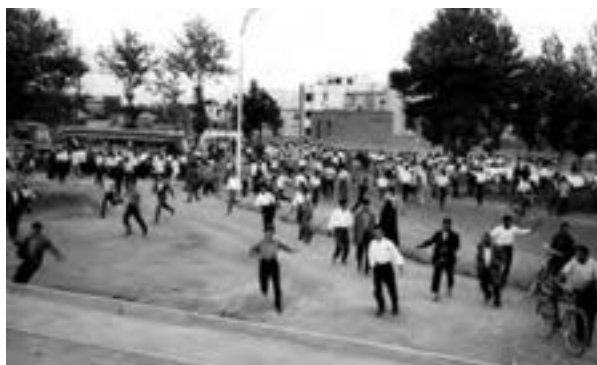
صحنه‌ای از قیام مردم تهران در ۳۰ تیر ۱۳۳۱