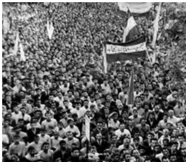
صحنه‌ای از تظاهرات مردم تهران در پشتیبانی از ملی شدن صنعت نفت ایران

پس از اعدام انقلابی رزم‌آرا به دست خلیل طهماسبی ۳ یکی از اعضای جمعیت فدائیان اسلام (۱۶ اسفند ۱۳۲۹)، مهم‌ترین مانع بر سر راه ملی شدن صنعت نفت برداشته شد. چند روز بعد از آن، نخست مجلس شورای ملی (۲۴ اسفند ۱۳۲۹) و سپس مجلس سنا در ۲۹ اسفند ۱۳۲۹ طرح ملی شدن صنعت نفت را تصویب کردند و جنبش ضد استعماری ملت ایران در گام نخست به پیروزی رسید. بی‌تردید، پیروزی جنبش‌های ضد استعماری مردم هندوستان علیه انگلستان به عنوان استعمار پیر و نیز موفقیت حرکت‌های استقلال‌طلبانه در برخی از کشورهای آسیایی و آفریقایی، تأثیر بسزایی بر خیزش ملت ایران برای طلب کردن و گرفتن حقوق ملی خود داشته است.