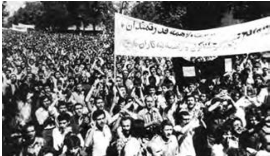
تظاهرات مردم تهران در شهریور ۱۳۵۷