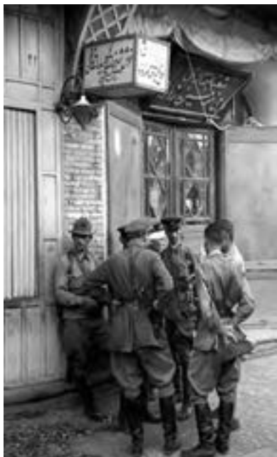
نظامیان شوروی در ایران، قزوین، جنگ جهانی دوم

وقتی جنگ جهانی دوم درگرفت، دولت ایران اعلام بی‌طرفی کرد. در آن زمان، کشور ما روابط بازرگانی گسترده‌ای با آلمان داشت و تعداد زیادی از کارشناسان (تکنسین‌های) آلمانی در ایران مشغول کار بودند. تلاش‌های انگلستان برای جلوگیری از داد و ستد آلمان با کشورهای بی‌طرف، اعتراض حکومت رضاشاه را برانگیخت و باعث شد که ایران از طریق شوروی به تجارت با آلمان ادامه دهد.