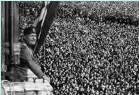
موسولینی هنگام سخنرانی در میان هواداران پرشور خود — ونیز ۱۹۳۳ م

یکی از رایج‌ترین شیوه‌های تبلیغات فاشیستی طرح شعارهایی چون «موسولینی همواره درست می‌گوید» به‌صورت پوستر و چسباندن آن بر در و دیوار در سرتاسر ایتالیا بود (فوگل، تمدن مغرب‌زمین، ج ۲، ص ۱۲۰۵). درباره نسبت این شعار با مرام و مسلک فاشیستی با یکدیگر مباحثه کنید.