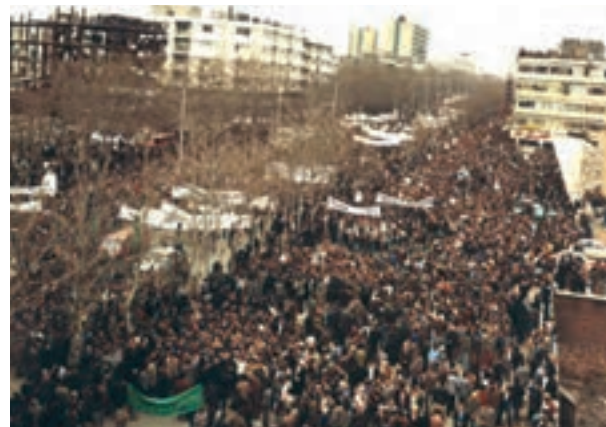
راه‌پیمایی میلیونی مردم تهران در تاسوعای حسینی، ۱۹ آذر ۱۳۵۷

این تظاهرات عظیم، دولت آمریکا را به این نتیجه رساند که روی کار آوردن دولت نظامی ازهاری نتیجه‌ای نداشته است؛ به