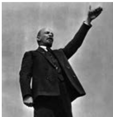
لنین، رهبر انقلاب نوامبر ۱۹۱۷ روسیه

با طرح سه شعار اساسی: «صلح، زمین، نان»، «تسلط کارگران بر تولید» و «همه قدرت از آن شوراها» پشتیبانی سربازان، کشاورزان و کارگران را جلب کرد. ۱ انقلابیون بلشویک سرانجام، با تسخیر مقر حکومت موقت در پتروگراد، قدرت را به دست گرفتند (نوامبر ۱۹۱۷). از آن پس، نام روسیه به اتحاد جماهیر شوروی تغییر یافت.