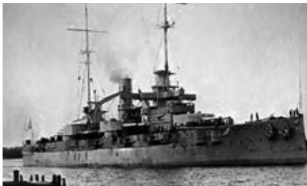
ناوگان جنگی آلمان در جنگ جهانی اول

در پی قتل ولیعهد اتریش و همسرش به دست یک صرب ملی‌گرا در شهر سارایوو و مرکز بوسنی، اتریش به حکومت صربستان مستقل اعلان جنگ کرد. طولی نکشید که کشورهای عضو اتحاد مثلث با کشورهای اتفاق مثلث وارد جنگ شدند (اوت ۱۹۱۴/ تابستان ۱۲۹۳ش). اندکی بعد، امپراتوری عثمانی و بلغارستان به صف متحدین و ژاپن، یونان، پرتغال، رومانی و برخی کشورهای دیگر به جبههٔ متفقین پیوستند و دامنهٔ جنگ به سرعت از اروپا به آسیا و آفریقا کشیده شد. ایتالیا نیز در میانهٔ جنگ از متحدین جدا شد و به متفقین پیوست.