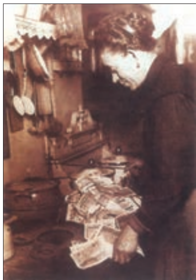
در سال ۱۹۲۳، ارزش مارک آلمان به اندازه‌ای سقوط کرد که از اسکناس به جای سوخت، به عنوان کاغذ دیواری و برای پر کردن تشک استفاده می‌شد.

یکی از مسائل مهم جهان و به خصوص اروپا در دوران پس از جنگ جهانی اول، بازسازی ویرانی‌های ناشی از جنگ و ایجاد رونق و رفاه اقتصادی بود. برخی از کشورها، مانند انگلستان، به اتکای منابع خود و ثروت مستعمراتشان تا حدودی از عهده این کار برآمدند؛ اما بسیاری دیگر با مشکلات شدیدی مانند رکود و تورم روبه‌رو شدند. آلمان از جمله کشورهایی بود که در نخستین سال‌های پس از جنگ جهانی اول شرایط اقتصادی وخیمی داشت؛ زیرا علاوه بر خرابی‌های حاصل از جنگ، مستعمراتش را از دست داده و محکوم به پرداخت غرامت‌های سنگین شده بود.