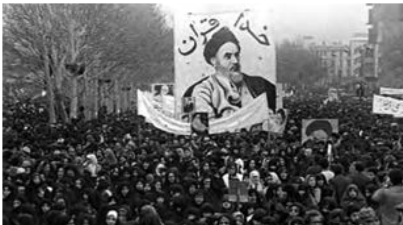
حضور گسترده زنان در راه پیمایی‌های دوران انقلاب اسلامی

در سال ۱۳۵۷ اعتراضات به شهرهای دیگر گسترش یافت. پیام این قیام تجدید عهد با رهبری انقلاب و افزایش تنفر از رژیم شاهنشاهی بود. با گسترش قیام، جمشید آموزگار در مرداد ۱۳۵۷ در اصفهان حکومت نظامی برقرار کرد، اما این تدبیر ثمری نداشت؛ در نتیجه، شاه مجبور شد