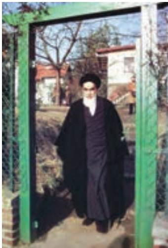
حضرت امام خمینی در نوفل لوشاتو