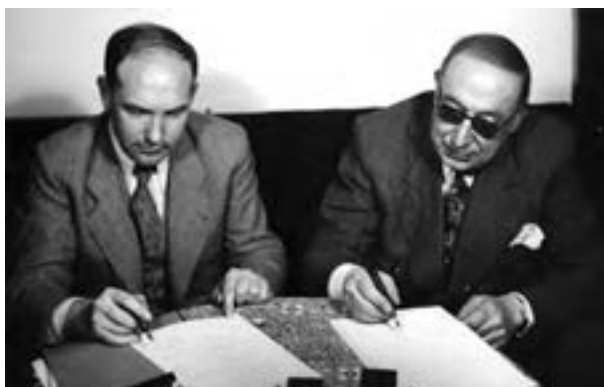
قوام و سادچیکف، سفیر شوروی، هنگام امضای موافقت‌نامه امتیاز نفت شمال

در دوران اشغال ایران، دولت‌های آمریکا و شوروی برای کسب امتیاز استخراج نفت در مناطقی که در خارج از محدوده قرارداد ۱۳۱۲ ش/ ۱۹۳۳م ایران و انگلیس قرار داشتند، از جمله نفت شمال، به شدت با هم رقابت می‌کردند. در این میان، نمایندگان مجلس شورای ملی (دوره چهاردهم) به پیشنهاد دکتر محمد مصدق طرحی را به تصویب رساندند که دولت را از مذاکره و انعقاد قرارداد با کشورهای خارجی در خصوص نفت ایران بدون تأیید و تصویب مجلس منع می‌کرد (۱۳۲۳ش). این مصوبه در حکم اتخاذ سیاست «موازنه منفی»، یعنی ایستادگی در برابر امتیازخواهی دولت‌های سلطه‌جو،