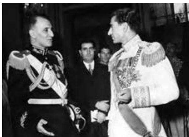
شاه و سرلشکر زاهدی، فرمانده کودتاجیان

طراحی کودتای ۲۸ مرداد حاصل توافق آمریکا و انگلیس بود. پس از ملاقات‌ها و مذاکرات نمایندگان و مأموران انگلیسی و آمریکایی، آن دو کشور در اواخر سال ۱۳۳۱ دربارهٔ سرنگونی دولت مصدق و انتصاب سرلشکر فضل‌الله زاهدی به نخست‌وزیری به توافق رسیدند. براساس طرح مشترک انگلیس و آمریکا، ایجاد آشوب‌های خیابانی در ایران و به راه انداختن جنگ روانی علیه مصدق در مطبوعات در دستور کار شبکهٔ جاسوسی دو کشور قرار گرفت. علاوه بر آن، طراحان کودتا از طریق اشرف پهلوی و ژنرال نورمن شوارتسکف ۱ آمریکایی، محمدرضا پهلوی را که در ابتدا در پذیرش کودتا مردد بود، متقاعد کردند که با کودتا موافقت کند. با ورود مأمور ویژه ۲ سیا ۳ به ایران در اواسط تیر ۱۳۳۲ و ملاقات او با فضل‌الله زاهدی، مقدمات اجرای کودتا فراهم شد. سرانجام، با نقشه و حمایت سیاسی و مالی دولت‌های انگلستان و آمریکا و عوامل داخلی آنان، در ۲۸ مرداد ۴ ۱۳۳۲ واحدهایی از ارتش به فرماندهی فضل‌الله زاهدی علیه دولت دکتر مصدق اقدام به کودتا کردند. کودتاجیان که از پشتیبانی سازماندهی شدهٔ گروه‌هایی از طرفداران شاه و دربار برخوردار بودند، مراکز مهم دولتی را در پایتخت تسخیر و دولت دکتر مصدق را سرنگون کردند. پس از موفقیت کودتا، زاهدی نخست‌وزیر شد و اعلام حکومت نظامی کرد. دکتر مصدق و تعدادی از همکاران و یاران نزدیکش