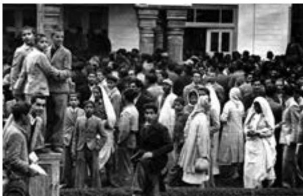
نمایی از تظاهرات مردم تهران در اعتراض به کمبود و گرانی نان در برابر مجلس شورای ملی در میدان بهارستان (آذر ۱۳۲۱)

در فاصله سال‌های ۱۳۲۰ تا ۱۳۳۲، شاه فقط بر ارتش مسلط بود و نظارت و قدرت اداری و اجرایی کشور در اختیار مجلس شورای ملی و هیئت دولت بود. اعیان و اشراف زمین‌دار و غیرزمین‌دار در مجلس، کابینه و در سطح محلی، قدرت و نفوذ زیادی داشتند. در این دوره، مطبوعات و احزاب نیز به صورت گسترده و با شور و شوق فراوان فعالیت می‌کردند و نقش مؤثری در تحولات سیاسی و اجتماعی داشتند.