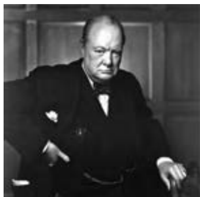
وینستون چرچیل، نخست وزیر انگلستان در دوران جنگ جهانی دوم

در اول سپتامبر ۱۹۳۹/ شهریور ۱۳۱۸، ارتش آلمان برق‌آسا به لهستان یورش برد و نیمه غربی ۱ این کشور را تصرف کرد. بلافاصله انگلستان و فرانسه، که با عنوان متفقین شناخته می‌شدند، به آلمان اعلان جنگ کردند. چند ماه بعد، نیروهای آلمانی نروژ، بلژیک و هلند را تسخیر کردند و سپس، به فرانسه هجوم آوردند و این کشور را اشغال کردند. ایتالیا نیز با حمله به فرانسه وارد جنگ شد. هیتلر پس از فتح پاریس، از انگلیسی‌ها خواست که تسلیم شوند اما چرچیل، نخست وزیر جدید انگلستان، با سخنرانی‌های قاطع، مهیج و تأثیرگذار خود مردم کشورش را به مقابله با نازی‌ها فراخواند. نبرد شدیدی در هوا، دریا و زیر دریا میان دو کشور در گرفت؛ نیروی هوایی آلمان چندین ماه انگلستان را به شدت بمباران می‌کرد (۱۹۴۰-۱۹۴۱م) اما انگلیسی‌ها سخت پایداری کردند و ضربه سنگینی به آن کشور زدند.