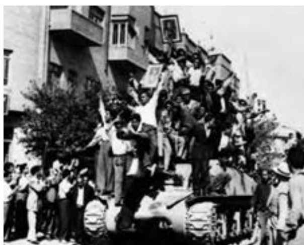
کودتاجیان در خیابان‌های تهران، ۲۸ مرداد ۱۳۳۲

تحلیل یکی از مورخان معاصر دربارهٔ اتحاد آمریکا و انگلستان علیه نهضت ملی شدن نفت را بخوانید و نظر خود را دربارهٔ آن بیان کنید. «از نظر واشنگتن و همچنین لندن، کنترل ایرانی‌ها بر نفت احتمالاً پیامدهای درازمدت ویرانگری به همراه داشت. این امر صرفاً یک ضربهٔ مستقیم به منافع بریتانیا نبود. ممکن بود کنترل نفت را کاملاً در اختیار ایران قرار دهد. ممکن بود الهام‌بخش دیگر کشورها – به ویژه اندونزی، ونزوئلا و عراق – شود؛ به طوری که آنان نیز از این رویه پیروی کنند و در نتیجه، کنترل بازار بین‌المللی نفت از شرکت‌های نفت غربی به کشورهای تولیدکننده منتقل شود. همچنین، تهدیدی بالقوه برای شرکت‌های آمریکایی و سایر کشورهای غربی – و طبعاً دولت آمریکا و بریتانیا – بود» (آبراهامیان، تاریخ ایران مدرن، ص ۲۱۸).