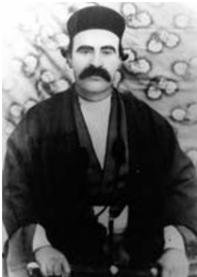
ناصر دیوان‌کازرونی (۱۲۵۳-۱۳۲۱ ش)

اگر چه حکومت قاجار اراده محکم و توان کافی برای رویارویی با نیروهای اشغالگر را نداشت، اما مردم و به‌خصوص عشایر در قسمت‌های مختلف ایران مانند فارس، بوشهر و خوزستان، تحت تأثیر فتوای مراجع تقلید در برابر متجاوزان ایستادند و از استقلال وطن خویش تا سرحد جان دفاع کردند. دلاورمردان تنگستانی، دشتستانی و دشتی به فرماندهی رئیس‌علی دلواری و مردم کازرون به رهبری ناصر دیوان‌کازرونی با شجاعت و شهامت با نیروهای انگلیسی نبرد کردند و ضربه‌های سنگینی به آنان وارد آوردند. عشایر عرب خوزستان نیز در «نبرد جهاد» غیورانه با قوای بیگانه جنگیدند.