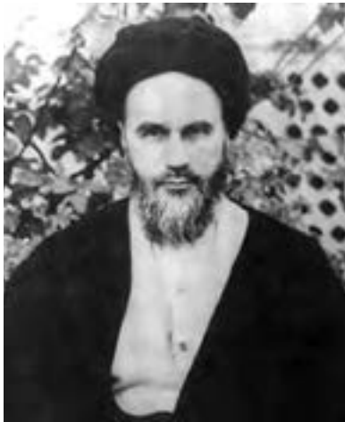
امام خمینی، رهبر نهضت اسلامی

اعتراض به تصویب نامه انجمن ها و همه پرسی انقلاب سفید