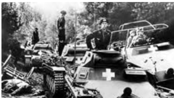
نیروهای ارتش آلمان در حمله به لهستان

نیروهای محور به شبه‌جزیره بالکان و اروپای شرقی نیز هجوم بردند و کشورهای آن منطقه را اشغال کردند یا به زیر سلطه خود درآوردند. با تهاجم نیروهای ایتالیایی و آلمانی به شمال آفریقا، سرتاسر این منطقه هم صحنه کارزار شد.