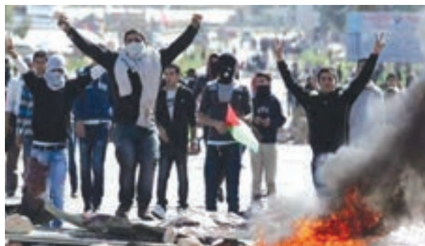
نمایی از انتفاضة مردم فلسطین علیه اشغالگران صهیونیست

با اسرائیل پیمان صلح امضا کرد. بعدها یاسر عرفات، رئیس سازمان آزادی بخش فلسطین، نیز به روند سازش پیوست. با این حال، قیام فلسطینیان علیه صهیونیست ها به ویژه پس از پیروزی انقلاب اسلامی ایران با قوت و قدرت ادامه دارد.