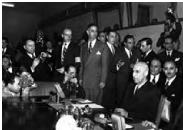
سخنرانی دکتر مصدق در نشست شورای امنیت سازمان ملل متحد درباره ملی شدن صنعت نفت ایران

در اردیبهشت ۱۳۳۰، دکتر مصدق با حمایت گسترده افکار عمومی، اتحاد و همکاری تنگاتنگ نیروهای ملی و مذهبی و پشتیبانی قاطع آیت‌الله کاشانی، نخست‌وزیر شد تا قانون ملی شدن صنعت نفت و خلع ید از شرکت نفت ایران و انگلیس را با قاطعیت به اجرا درآورد. دولت دکتر مصدق پس از روی کار آمدن، بی‌درنگ هیئتی را به ریاست مهندس مهدی بازرگان به خوزستان فرستاد تا مراکز و تأسیسات نفتی را از حوزه اختیار شرکت نفت ایران و انگلیس خارج کند. اجرای این قانون نقطه عطفی در تاریخ معاصر و مبارزه مردم ایران برای رهایی از سلطه استعمار و نجات سرمایه‌های ملی از تسلط بیگانگان به‌شمار می‌رود.