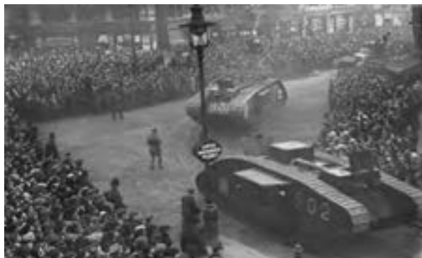
رژهٔ تانک‌ها در خیابان‌های لندن پس از جنگ جهانی اول