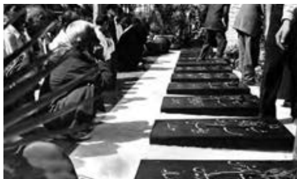
مزار شهدای قیام ۳۰ تیر در گورستان ابن بابویه

نهضت ملی شدن صنعت نفت با اتحاد و یکپارچگی احزاب و گروه‌های سیاسی و مذهبی مختلف بر محور مبارزه با استعمار انگلیس آغاز شد. با همدلی و یگانگی دکتر مصدق و آیت الله کاشانی، موانع داخلی و خارجی یکی پس از دیگری از سر راه برداشته شد و موفقیت‌های بزرگی به دست آمد اما پس از پیروزی قیام ۳۰ تیر، شرایط تغییر کرد؛ همکاری و اتحاد رهبران، شخصیت‌ها، احزاب و گروه‌های دست‌اندرکار نهضت بر اثر غلبه روحیه اجابت، خودمحوری، قدرت‌طلبی و منفعت‌جویی‌های فردی و گروهی به تفرقه و دشمنی تبدیل شد. با گسترش اختلاف‌ها و نزاع‌های سیاسی میان شخصیت‌ها و گروه‌های ملی و مذهبی، منافع کشور و اهداف نهضت ملی شدن نفت به فراموشی سپرده شد.