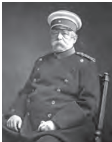
نگاره بیسمارک، صدراعظم آلمان (۱۸۱۵-۱۸۹۸م)

در سده ۱۹م، دو جریان فکری ملی‌گرایی و آزادی‌خواهی در بسیاری از سرزمین‌ها و جوامع اروپایی پا گرفت و زمینه‌ساز شکل‌گیری کشورها و دولت‌های ملی جدیدی شد. تفکر ملی‌گرایی، مردمان و گروه‌های قومی را که تاریخ و فرهنگ و زبان مشترکی داشتند، برانگیخت تا با هم یکی شوند و زیر پرچم حکومتی یکپارچه و مستقل قرار گیرند. ایتالیایی‌ها، آلمانی‌ها، لهستانی‌ها، صرب‌ها و مجارها از جمله این اقوام بودند که تحت تأثیر اندیشه ملی‌گرایی، برای تأسیس حکومت ملی به پا خاستند.