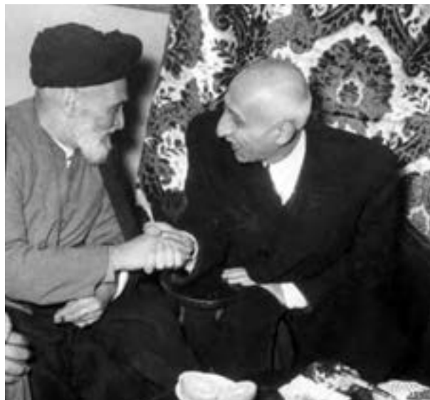
دکتر مصدق و آیت الله کاشانی

نمایندگان مخالف قرارداد الحاقی در مجلس شانزدهم، ضمن مخالفت با این قرارداد، طرح ملی شدن صنعت نفت ایران را پیشنهاد کردند. ۱ این طرح با استقبال گسترده شخصیت‌ها، قشرها و گروه‌های مختلف سیاسی، ملی و مذهبی روبه‌رو شد و بسیاری از مطبوعات