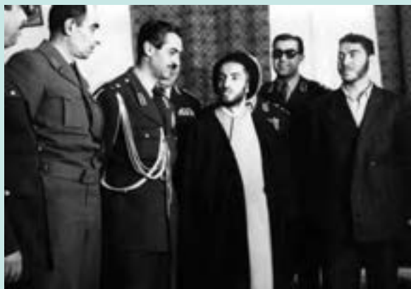
شهیدان نواب صفوی و سیدمحمد واحدی لحظاتی پس از بازداشت در حضور سرلشکر تیمور بختیار، فرماندار نظامی تهران

فداییان اسلام تشکلی مذهبی، سیاسی و انقلابی بود که در سال ۱۳۲۴ش به همت طلبه جوانی به نام سید مجتبی نواب صفوی به وجود آمد و تا سال ۱۳۳۴ش نقش مؤثری در رویدادهای سیاسی کشور داشت. هدف این جمعیت برقراری حکومتی بود که اجرای قوانین اسلام را در دستور کار خود قرار دهد. شهرت و تأثیر این جمعیت بیشتر مدیون اقدامهای مسلحانه و ترورهای بود که به دست اعضای آن صورت گرفت. آنها نخست احمد کسروی را به اتهام افکار و نوشته‌های ضدشیعی‌اش به قتل رساندند