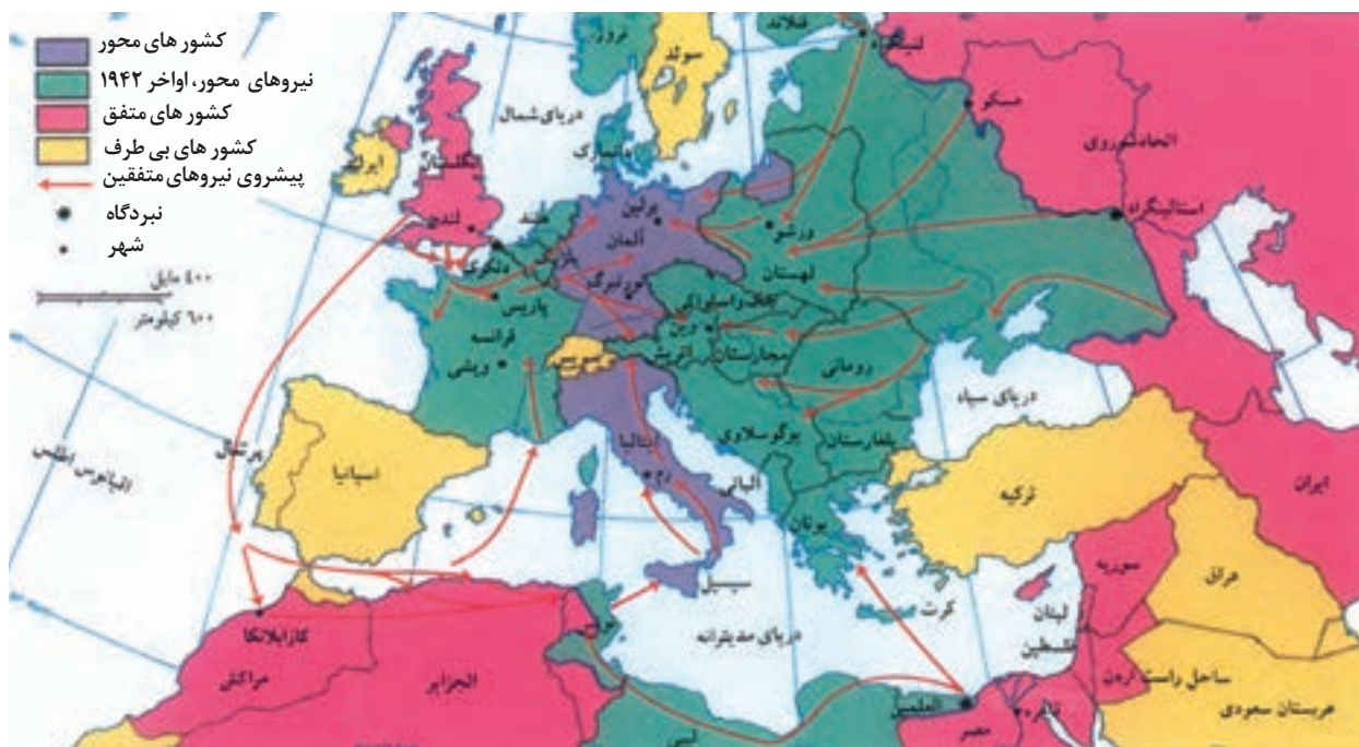
جنگ جهانی دوم در اروپا و شمال آفریقا؛ ۱۹۴۱-۱۹۴۵