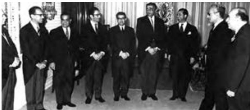
امیرعباس هویدا، هنگام معرفی اعضای کابینه خود به شاه