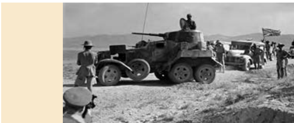
نیروهای انگلیسی در ایران، جنگ جهانی دوم

پس از اشغال ایران توسط نیروهای متفقین، رضاشاه به نفع پسرش محمدرضا، وادار به کناره‌گیری از سلطنت شد و به جزیرهٔ موریس در جنوب غربی اقیانوس هند تبعید گردید.