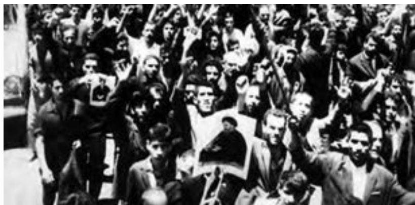
نمایی از تظاهرات مردم تهران در ۱۵ خرداد ۱۳۴۲

برخلاف تصور و خواست حکومت، مردم در عاشورای این سال با سردادن شعارهایی، حمایت خود را از امام خمینی علنی ساختند. با وجود محدودیت‌های امنیتی، امام خمینی طی نطقی در عصر عاشورا در قم، شخص شاه را مخاطب قرار دادند و از تسلط آمریکا و اسرائیل بر حکومت پهلوی پرده برداشتند. این سخنرانی باعث خشم رژیم و دستگیری و انتقال امام به تهران شد. خبر دستگیری امام، مردم و روحانیون و مراجع را به واکنش واداشت. اعتراضات زیادی در شهرهای مختلف ایران برپا شد؛ مردم در قم، تهران و ورامین به خاک و خون کشیده شدند و به دنبال آن عده‌ای از مبارزان، زندانی، اعدام و یا تبعید شدند. نتایج قیام پانزده خرداد: قیام پانزده خرداد به رغم اینکه با سرکوب شدید حکومت پهلوی مواجه شد، نتایج مهمی داشت: