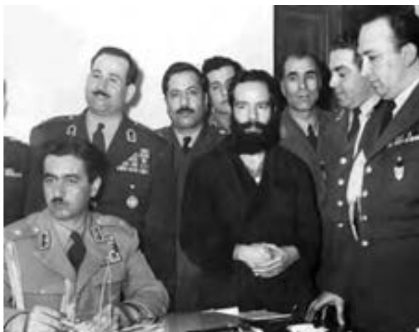
دکتر سید حسین فاطمی، وزیر خارجه و یار نزدیک دکتر مصدق (ردیف جلو نفر وسط) در فرمانداری نظامی تهران، فاطمی چند ماه پس از کودتا دستگیر و پس از محاکمه تیرباران شد.

دستگیر و سپس محاکمه شدند. احزاب و گروه‌های سیاسی و روزنامه‌های مخالف، غیرقانونی اعلام شدند و منحل گردیدند.