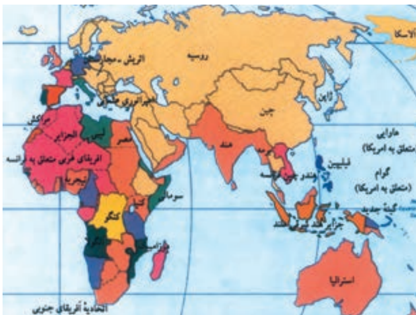
نقشه مستعمرات دولت‌های اروپایی در مناطق مختلف جهان در ۱۹۱۴م

روسیه و ایالات متحده آمریکا نیز در سده ۱۹م با قدرت یافتن دست به استعمار زدند.