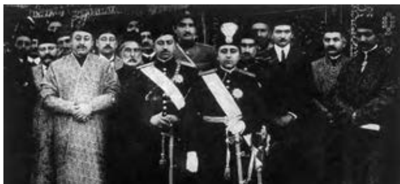
احمدشاه قاجار به همراه رضاخان و رجال درباری

با آماده‌شدن شرایط، قوای قزاق در بامداد روز سوم اسفند ۱۲۹۹ وارد تهران شدند و بی‌آنکه با مقاومت جدی روبه‌رو شوند، نقاط حساس پایتخت را تسخیر کردند. در پی این حادثه، شاه تحت فشار انگلیسی‌ها به ناچار سیدضیاءالدین طباطبایی را به نخست‌وزیری منصوب کرد. رضاخان نیز به عنوان فرمانده ارتش، لقب «سردار سپه» گرفت. به فاصله کوتاهی، سیدضیاء استعفا کرد و به اروپا رفت؛ اما رضاخان (مهره نظامی کودتا) در مقام وزیر جنگ روزبه‌روز بر قدرت و نفوذ خود افزود.