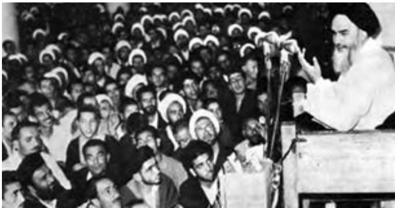
امام خمینی هنگام سخنرانی در مدرسه فیضیه، ۱۳۴۲

امام خمینی به همراه مراجع دیگر، در اعتراض به عملکرد حکومت، عید نوروز ۱۳۴۲ را عزای عمومی اعلام کردند و به افشای اقدامات