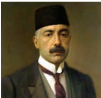
حسن وثوق الدوله (۱۲۵۴-۱۳۲۹ ش)

به دنبال پیروزی انقلاب روسیه (نوامبر ۱۹۱۷ م/ پاییز ۱۲۹۶)، دولت بلشویکی این کشور نیروهایش را از ایران فراخواند. انگلستان با