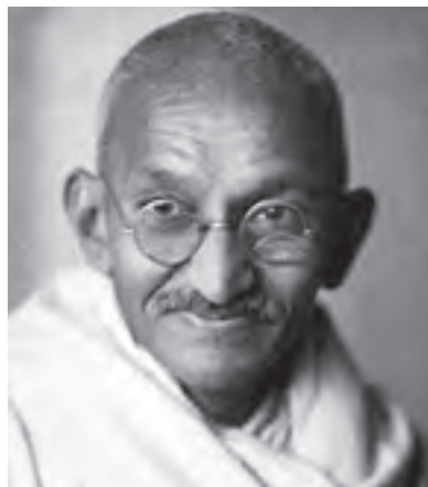
مهاتما گاندی (۱۸۶۹-۱۹۴۸م)

مردم الجزایر به فرماندهی امیر عبدالقادر بر ضد ارتش فرانسه، شورش سپاهیان هندی و مبارزات ضد استعماری گاندی در هندوستان و جنبش استقلال طلبانه مردم آمریکای لاتین به رهبری سیمون بولیوار نمونه‌هایی از مبارزه مردم در سرزمین‌های مستعمره بود.