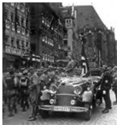
رژه نازی‌ها - ۱۹۳۵م

هیتلر و نازی‌ها پس از به دست گرفتن زمام امور و لغو قرارداد ورسای، برای متحول کردن اقتصاد آلمان و تحقق وعده‌های خویش برنامه‌های گوناگونی را اجرا کردند. ساخت شبکه وسیعی از جاده‌ها و راه‌آهن، ایجاد مؤسسات عمومی و راه‌اندازی کارخانه‌های بزرگ به خصوص صنایع تسلیحاتی از جمله طرح‌های عمرانی و اقتصادی بود که به اجرا درآمد و به بحران رکود و بیکاری در آلمان پایان داد.