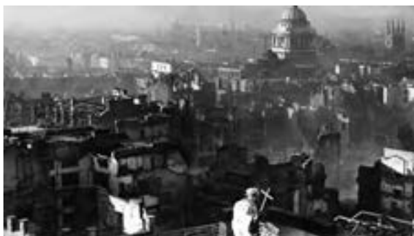
در جریان نبرد هوایی در سال‌های ۱۹۴۰ و ۱۹۴۱ م بارها هواپیماهای آلمانی شهر لندن را بمباران کردند و خسارت‌های فراوانی به این شهر وارد آوردند.