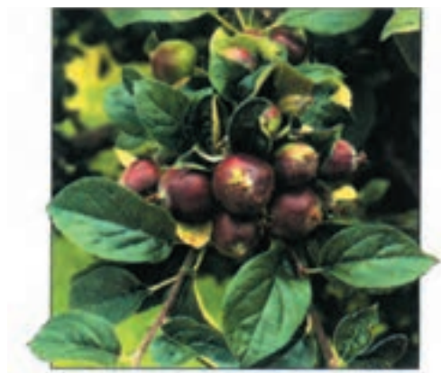
شکل ۵۵-۳ الف

در شکل ۵۴-۳ تنک گل، در شکل‌های ۵۵-۳ الف و ب میوه‌های روی یک شاخه درخت سیب قبل و بعد از تنک و نیز در شکل‌های ۵۶-۳ الف و ب میوه‌های روی یک شاخه آلو قبل و بعد از تنک مشاهده می‌شوند.