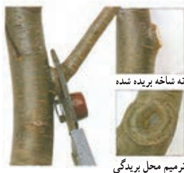
شکل ۳-۴۵ - طرز برش در شاخه نسبتاً قطور