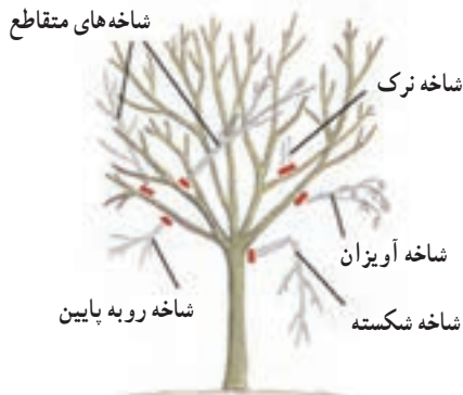
شکل ۵۲-۳- شاخه‌هایی را که با فلش مشخص شده‌اند باید در موقع هرس حذف کنید.