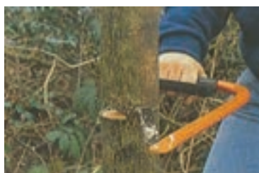
شکل ۳-۵۱ ج