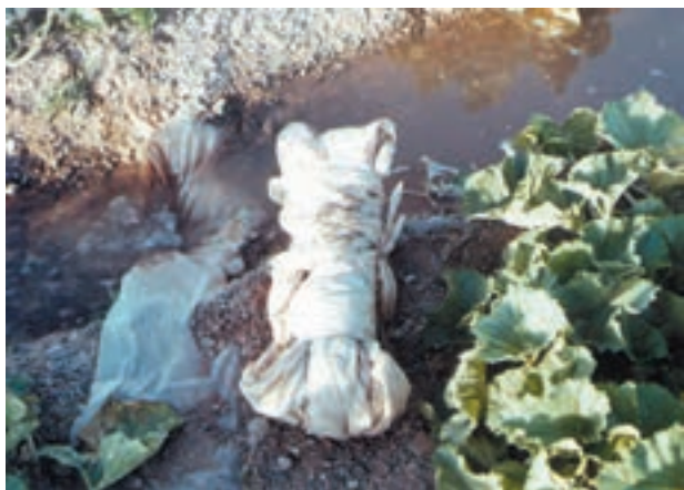
شکل ۱۸- ۴

– برای کم و زیاد کردن جریان آب در طول جویها می‌توانید به جای کاه و کلش از پلاستیکهای به هم پیچیده، استفاده کنید (شکل‌های ۴-۱۸ و ۴-۱۹).