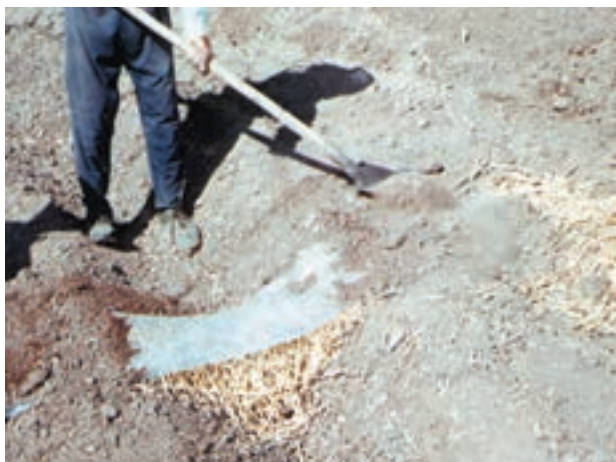
شکل ۱۶- ۴

– در این حالت لبه‌های نایلون از سه طرف زیر خاک قرار گرفته است (شکل ۴-۱۶).