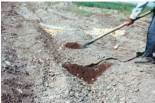
شکل ۱۷- ۴

– نسبت به شیب زمین و تراز سطح آب در جویها، عملیات گوشه‌بندی را در فواصل مناسب تکرار کنید (شکل ۴-۱۷).