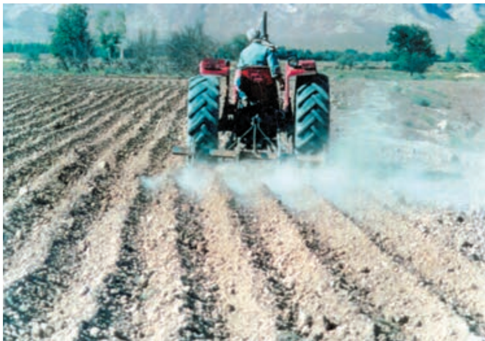
شکل ۴-۷- ايجاد جويچه‌هاي آبياري پس از بذركاري دستي