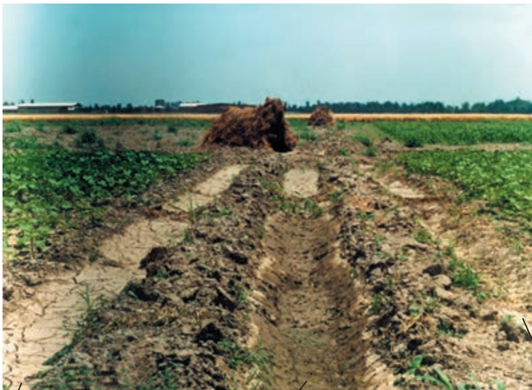
نهر زهکشی در پائین دست قطعه اول