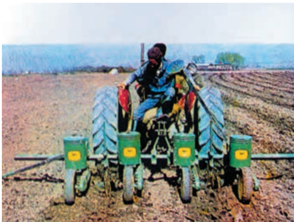
شکل ۵-۴ کاشت با استفاده از ردیفکار مکانیکی