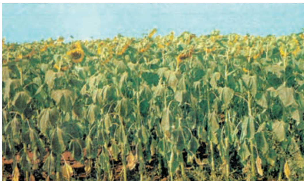
شکل ۴-۵ اثر تنش رطوبتی در آفتابگردان