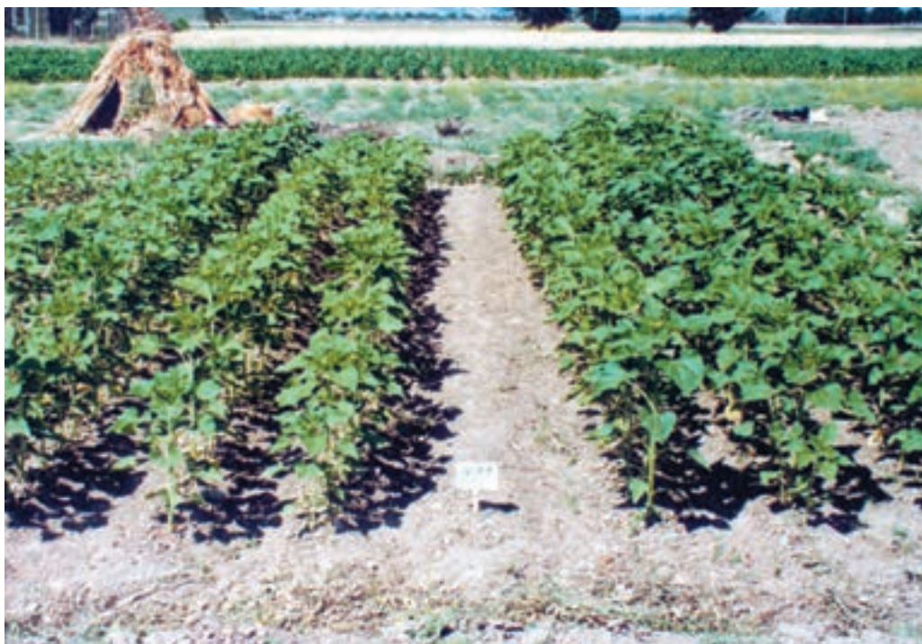
شکل ۹-۵- مزرعه‌ای که عملیات داشت، به‌درستی و به موقع در آن صورت گرفته است.

چکیده مصاحبه را در یادداشت خود ثبت کنید.