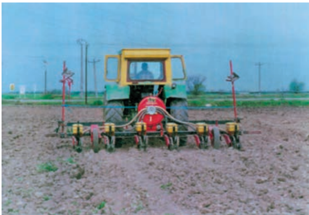
شکل ۴-۶- کاشت آفتابگردان با بذركار پنوماتيكي