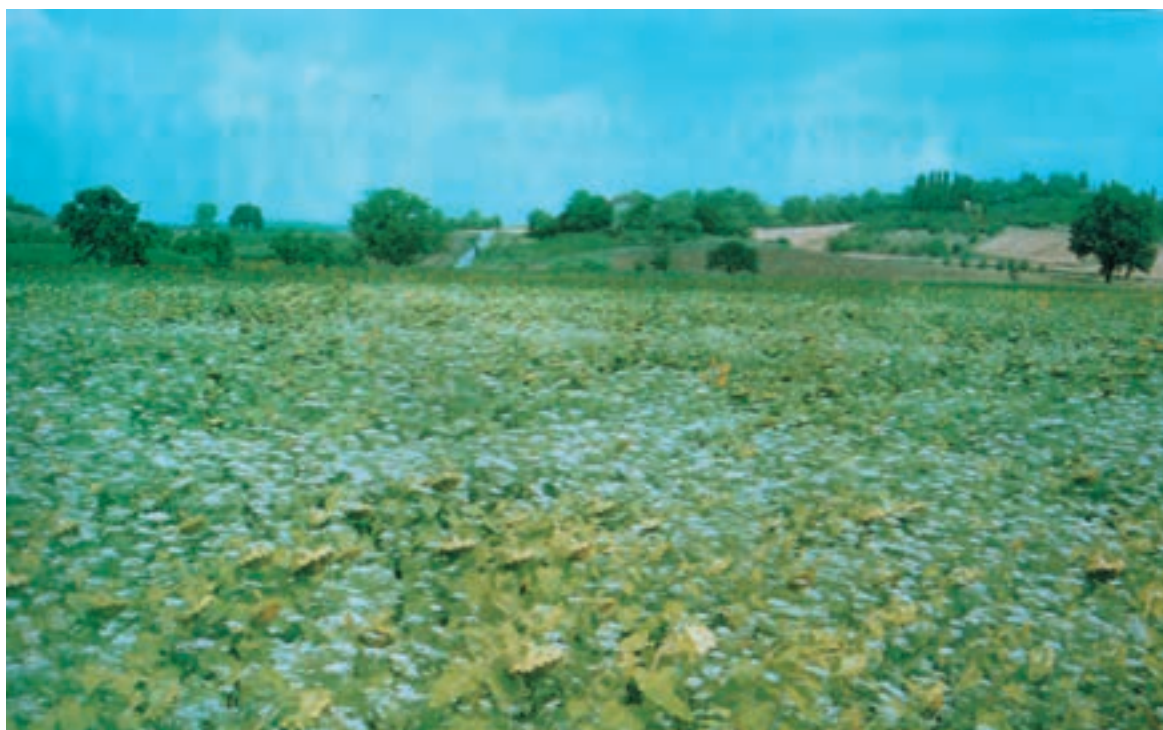
شکل ۷-۵ مزارع آفتابگردان که علفهای هرز آن کنترل نشده است.