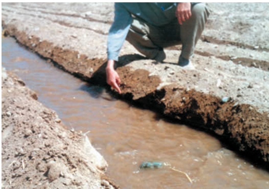
شکل ۱-۵– نهر اصلی آبیاری مزرعه در بالا دست زمین

۲۱– آبیاریهای بعدی را با توجه به نظام حق آبه و عرف منطقه انجام دهید.