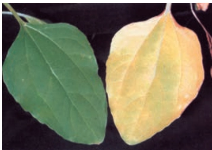
شکل ۱۵-۵- (راست) ازت غیرکافی - (چپ) ازت کافی در برگهای پایین آفتابگردان