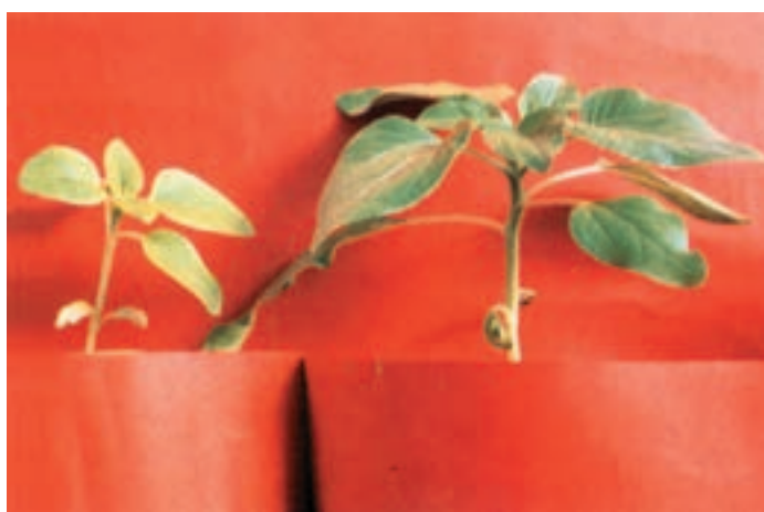
شکل ۱۱-۵- (راست) دارای ازت کافی در محلول غذایی (چپ) کمبود ازت در محلول غذایی