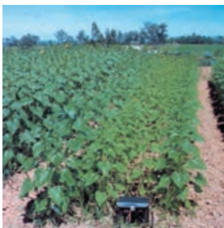
شکل ۱۲-۵- کمبود ازت در آفتابگردان

ضرورت مصرف کود سرک در آفتابگردان: باید توجه داشته باشید هرچند که کمبود ازت شایع ترین کمبود در طی رشد و نمو گیاه و معمولی ترین کود سرک است اما منحصر به فرد نیست. آفتابگردان همانند سایر گیاهان در مراحل مختلف رشد و نمو خود ممکن است دچار کمبود عناصر غذایی متعددی بشود. وظیفه شماس است که اولاً مانع از بروز کمبود شوید و ثانیاً نسبت به رفع به هنگام آنها اقدام نمایید. حفظ حاصلخیزی خاک با مصرف کودهای آلی و رعایت آیش بندی و تناوب زراعی، رعایت اصول بهزراعی و ارتباط مداوم