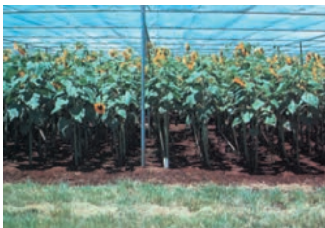
شکل ۱۳-۵- آفتابگردان در محیط بدون ازت - (چپ) مصرف ۱۸۰ کیلوگرم در هکتار ازت