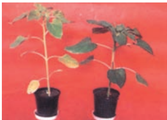
شکل ۱۶-۵- (چپ) ساقه نازک به دلیل کمبود ازت - (راست) ازت کافی