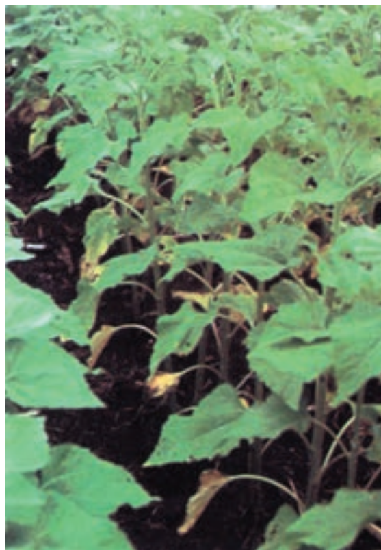
شکل ۱۴-۵- رنگ پریدگی برگهای پایین بر اثر کمبود ازت