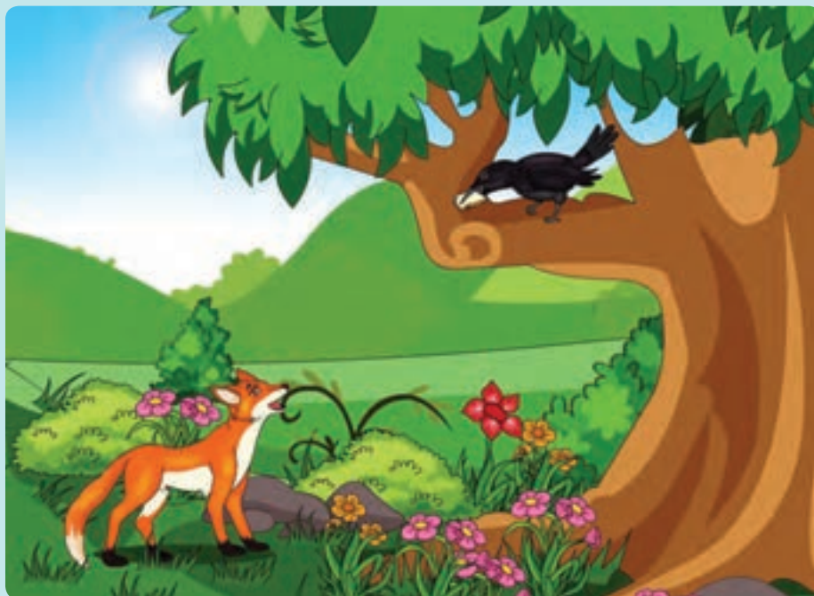
شکل ۳- قصه زاغک و روباه

فعالیت ۵: همه قصهٔ پند آموز ۱ زاغک و روباه را شنیده یا خوانده‌اید. جملات روباه تحسین بود یا تشویق؟ در این مورد گفت‌وگو کنید.