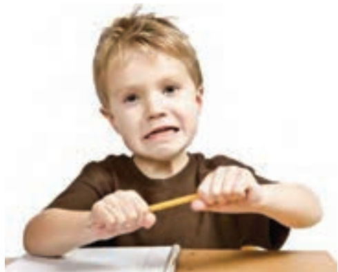
شکل ۹- کودک انتقام جو

چنین کودکی چنان که اصلاح نشود به سمت کارهای پرخطر پیش می‌رود و سر دستة گروه‌هایی چون خود می‌شود (دزدی، خرابکاری، شکستن شیشه‌ها و...). گاهی هم ممکن است با پرتاب سنگ و لگد زدن به هم‌کلاسی‌ها، بزرگ‌ترها و