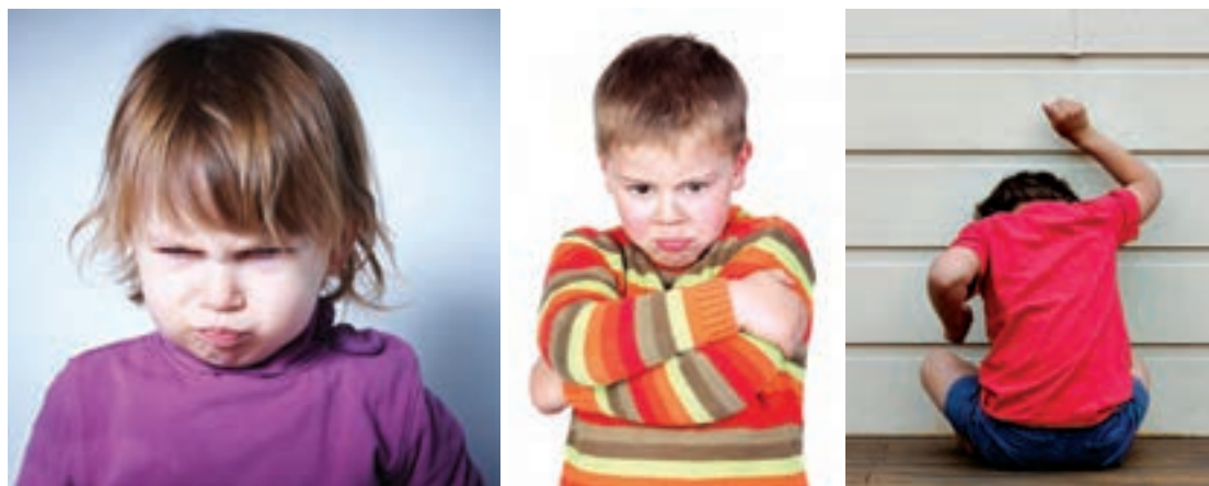
شکل ۵- کودک بدقلق

■ قادر نیستند احساسات و افکار خود را به روشنی بیان کنند: وقفه در رشد، بر کسب مهارت گفتاری اثر می‌گذارد و مهارت کلامی ناقص می‌شود. این در مورد بزرگسالانی که نمی‌توانند احساسات واقعی خود را بروز دهند نیز صادق است. ما اغلب، سکوت کودکان را به اشتباه، اعتماد نکردن آنها به بزرگسال یا بی‌ میلی در