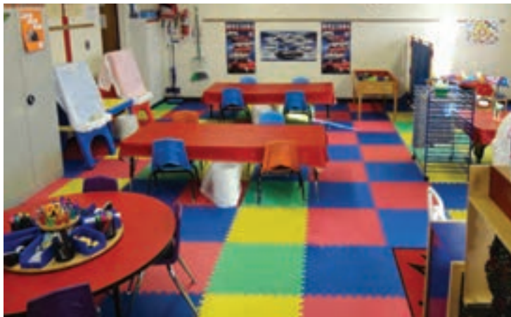
شکل ۴ - نمایی از کلاس