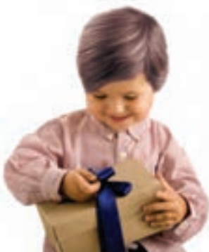
شکل ۲ - تشویق