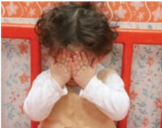
شکل ۱۰- کودک خجالتی

«عزیزم می‌توانی حیوانات قصه‌ای را که برایت تعریف کردم بکشی» یا «نقاشی‌ای که دوست داری بکش». نه نمی‌توانم! گروهی از کودکان با ابراز ناتوانی، می‌توانند من خود را پنهان کنند. این ناتوانی گاهی واقعی است (نمی‌تواند نقاشی کند یا با قیچی شکلی را ببرد) و گاه فقط ابراز ناتوانی است و در چنین حالتی ترجیح می‌دهد کاری نکند، زیرا راحت طلب است یا از اینکه مقایسه شود می‌ترسد و احساس حقارت می‌کند یا بدین‌وسیله توجه شما را بیشتر به خود جلب می‌کند.