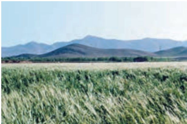
شکل ۱-۵۲- خوابیدگی در گندم

پیمانه مهارتی: انتخاب ارقام مناسب گندم و جو برای کشت شماره شناسایی: ۱۱-۱-۷۴/ک