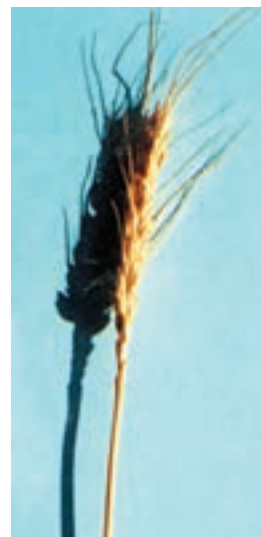
شکل ۴۸-۱- کرج ۲