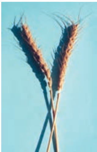
شکل ۲۹-۱- شاه‌پسند

۲-۷-۱- ارقام اصلاح شده: ارقام اصلاح شده از سوی مراکز اصلاح بذور و یا سایر مؤسسات وابسته تهیه گردیده است. گندمهای اصلاح شده را می‌توان به صورت زیر تقسیم بندی نمود. ارقام اصلاح شده داخلی: این ارقام از میان رقمهای موجود بومی در ایران، پس از تحقیقات و بررسی انتخاب و تکثیر شده‌اند که می‌توان به انواع زیر اشاره کرد: