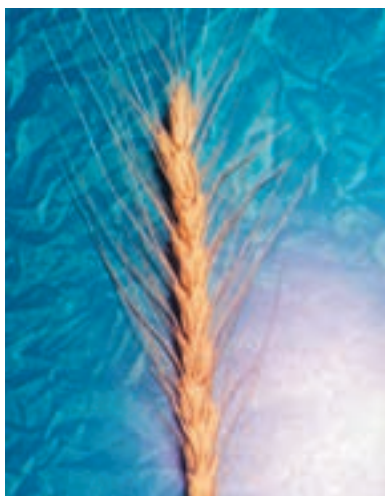
شکل ۱-۳۵ - گندم اینیا ۶۶

پیمانۀ مهارتی: انتخاب ارقام مناسب گندم و جو برای کشت شماره شناسایی: ۱۱-۱-۷۴/ک