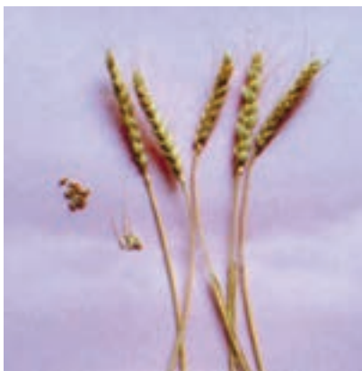
شکل ۱-۳۱ - گندم بکراس - روشن

پیمانۀ مهارتی: انتخاب ارقام مناسب گندم و جو برای کشت شماره شناسایی: ۱۱-۱-۷۴/ک