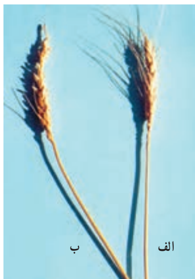
شکل ۱-۵۳- الف- گندم مقاوم در برابر ریزش، ب- گندم حساس نسبت به ریزش