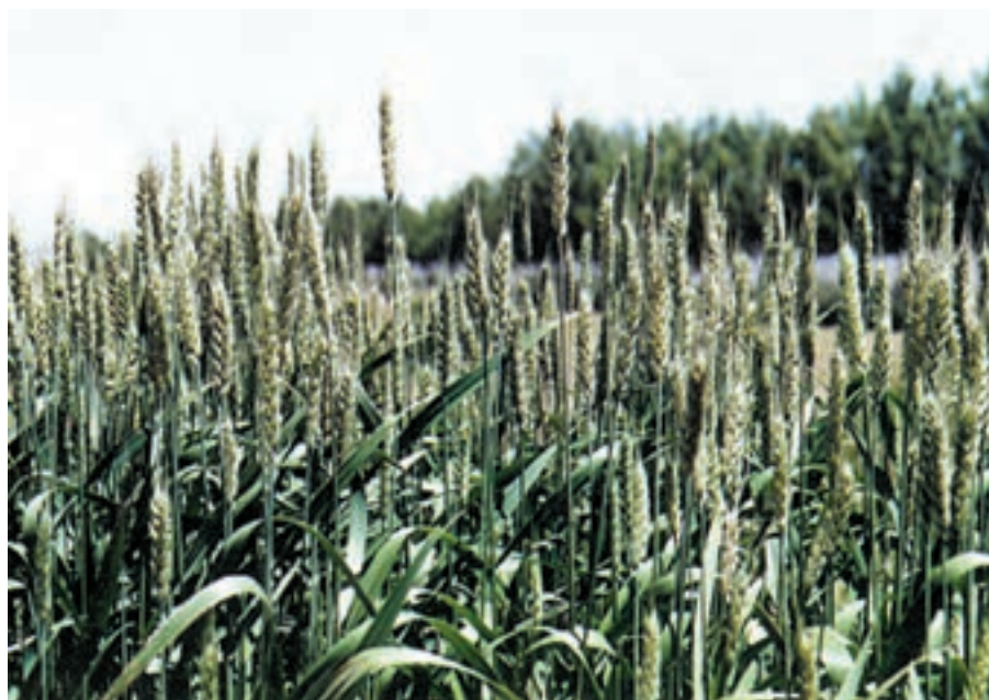
شکل ۵۱-۱- گندم نوید

ارقامی از گندمهای اصلاح شده خارجی و ایرانی