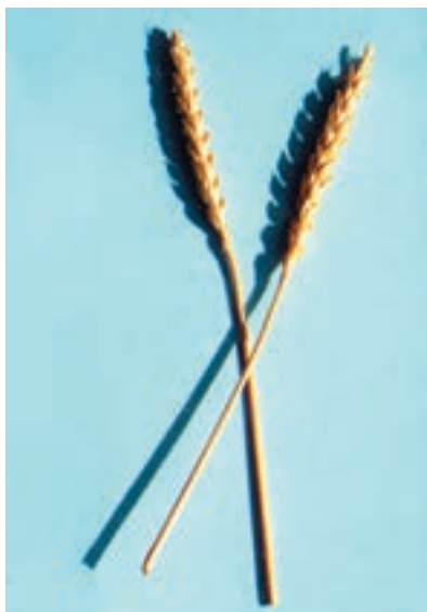
شکل ۱-۳۴ - بزوستایا

گندم آرژانتین: مبدأ آن کشور آرژانتین، سنبله آن بدون ریشک، زردرنگ، ارتفاع بوته متوسط، زودرس، رنگ دانه زرد و درشت می باشد. گندمی است که در برابر سرما حساس و نسبت به خوابیدگی، گرما، ریزش دانه و بیماریهای قارچی مقاوم است. وزن هزار دانه بین ۴۰ تا ۵۰ گرم، عملکرد، ۳ تا ۵ تن در هکتار و مناسب کاشت در مناطق گرم و معتدل است (شکل ۱-۳۳).