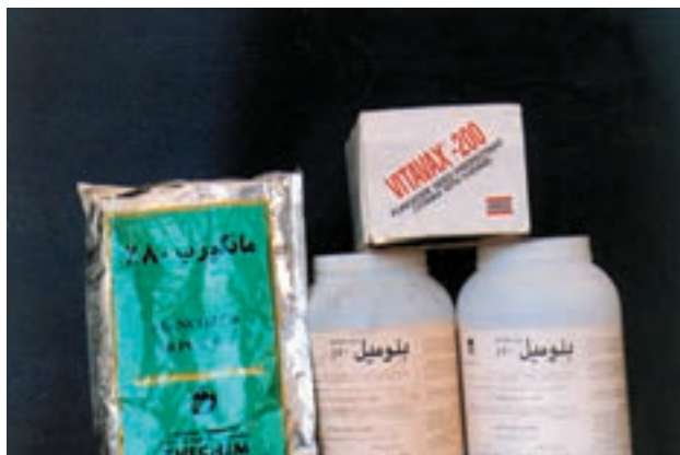
شکل ۱-۵۹- انواع سموم ضد عفونی کننده گندم

مهارت: کشت گندم و جو شماره شناسایی: ۱۱-۱-۷۴/ک