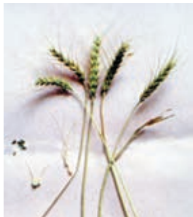
شکل ۵۰-۱- گندم گلینسون

مهارت: کشت گندم و جو شمارۀ شناسایی: ۱۱-۱-۷۴/ک