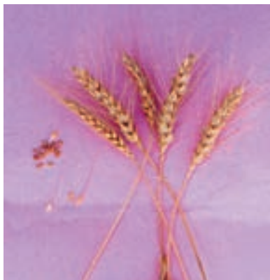
شکل ۴۹-۱- گندم .....