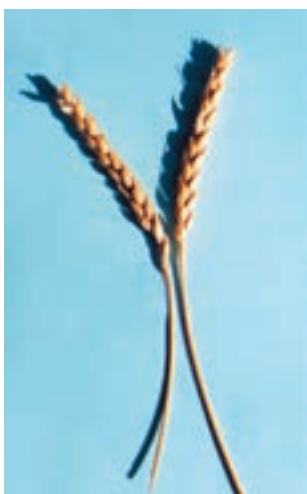
شکل ۳۰-۱- سفیدک