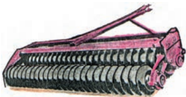
شکل ۵-۴- غلتک پره‌ای دو ردیفه