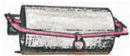
شکل ۵-۳- غلتک معمولی صاف

پره غلتک داخل شیار قرار می گیرد که ضمن فشردن داخل شیارها