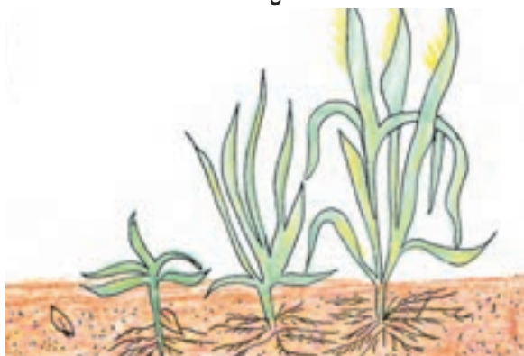
ظهور خوشه قبل از ساقه رفتن پنجه زنی هنگام کاشت